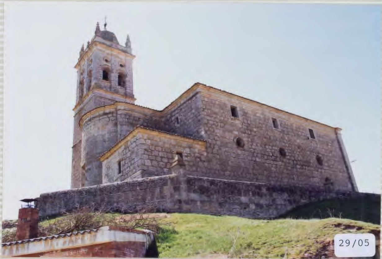
03.-IGLESIA DE SAN CRISTOBAL.