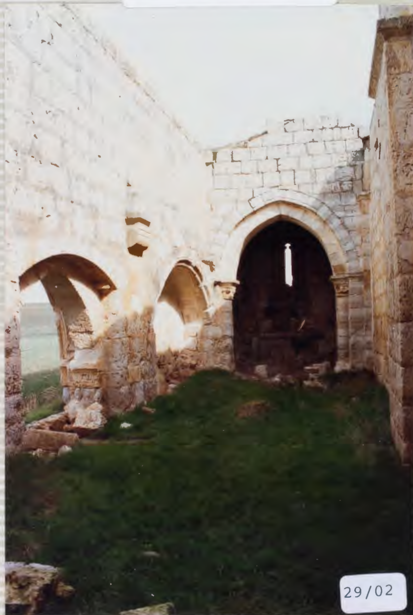
01.-ERMITA DE SAN NICOLAS DE BARI.