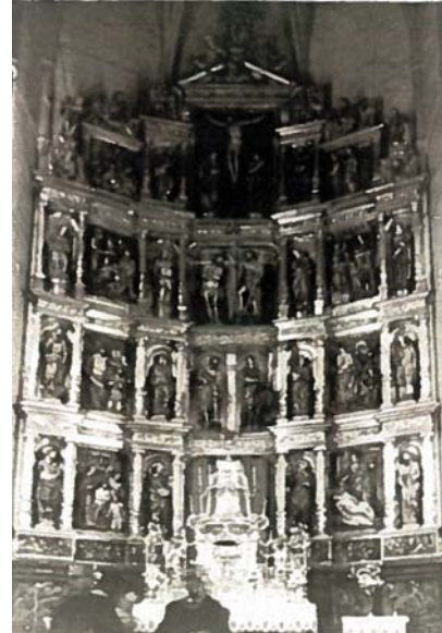
Altar mayor de la iglesia de San Juan Bautista.