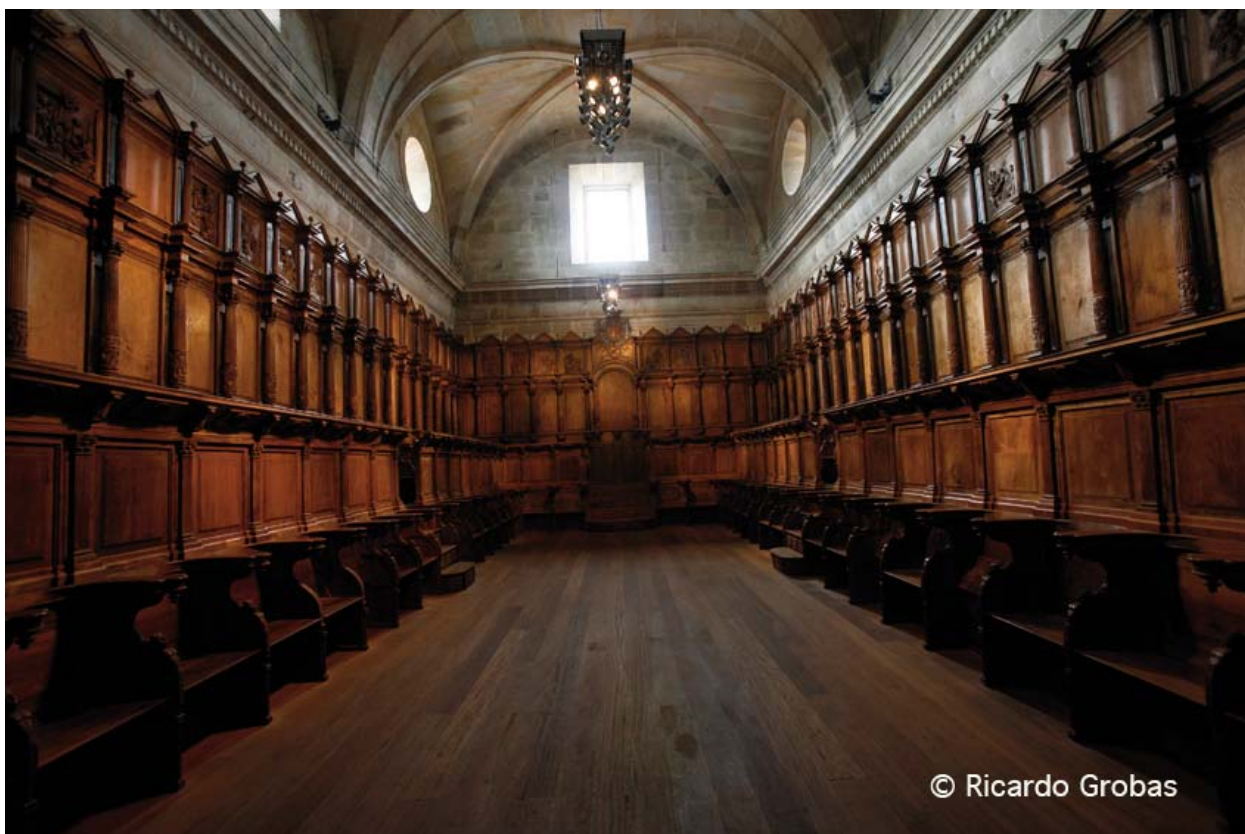
Monasterio de Santa Cristina de Ribas de Sil.