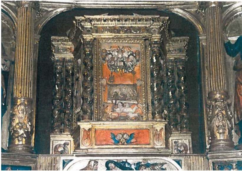
Sagrario del altar mayor de la iglesia de San Juan Bautista.