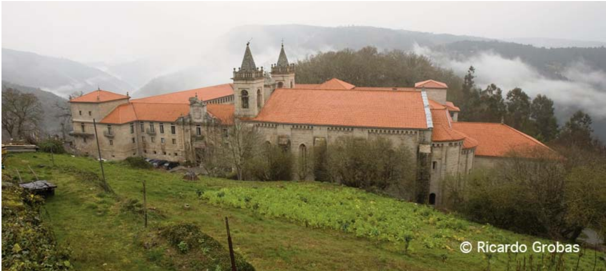
Parador de Turismo Monasterio de Santo Estevo de Ribas de Sil.