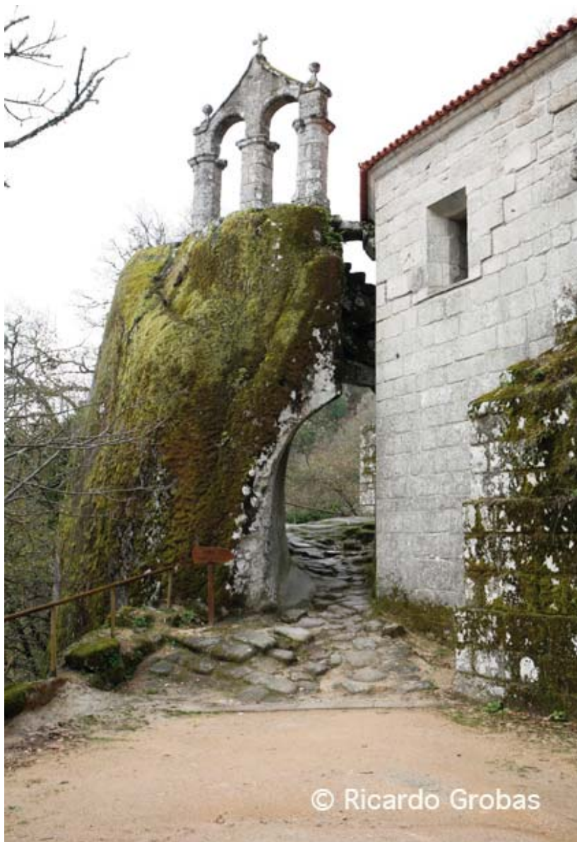
Campanario característico del monasterio de San Pedro de Rocas.

Lo más llamativo, casi mágico, de esta ruta de los monasterios de A Ri-