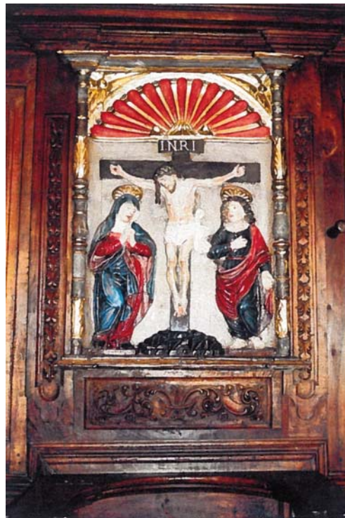
Pequeño calvario en el coro de San Pedro de la Rúa.

De la iglesia de San Pedro de la Rúa . Una Píxide alejandrian (del siglo VI) o caja de marfil, se encuentra