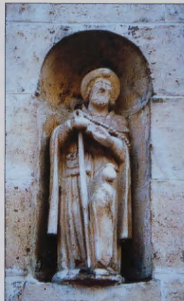
IMAGEN DE SANTIAGO. Oratorio de la Divina Pastora en Burgos.

• Pájaros perdidos de verano vienen a mi ventana, cantan, y se van volando.