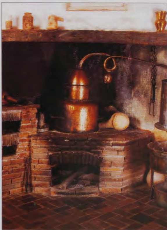
DETALLE DEL LABORATORIO DE LA BOTICA.

El sepulcro conmemorativo de Santo Domingo que se encuentra en el claustro bajo es de factura gótica. En él aparecen tres leones sosteniendo la gran lauda con la efigie del santo que aparece con un libro y el báculo abacial. En la parte superior de la lauda dos ángeles llevan una corona sobre su cabeza. A sus pies aparecen dragones y monjes.