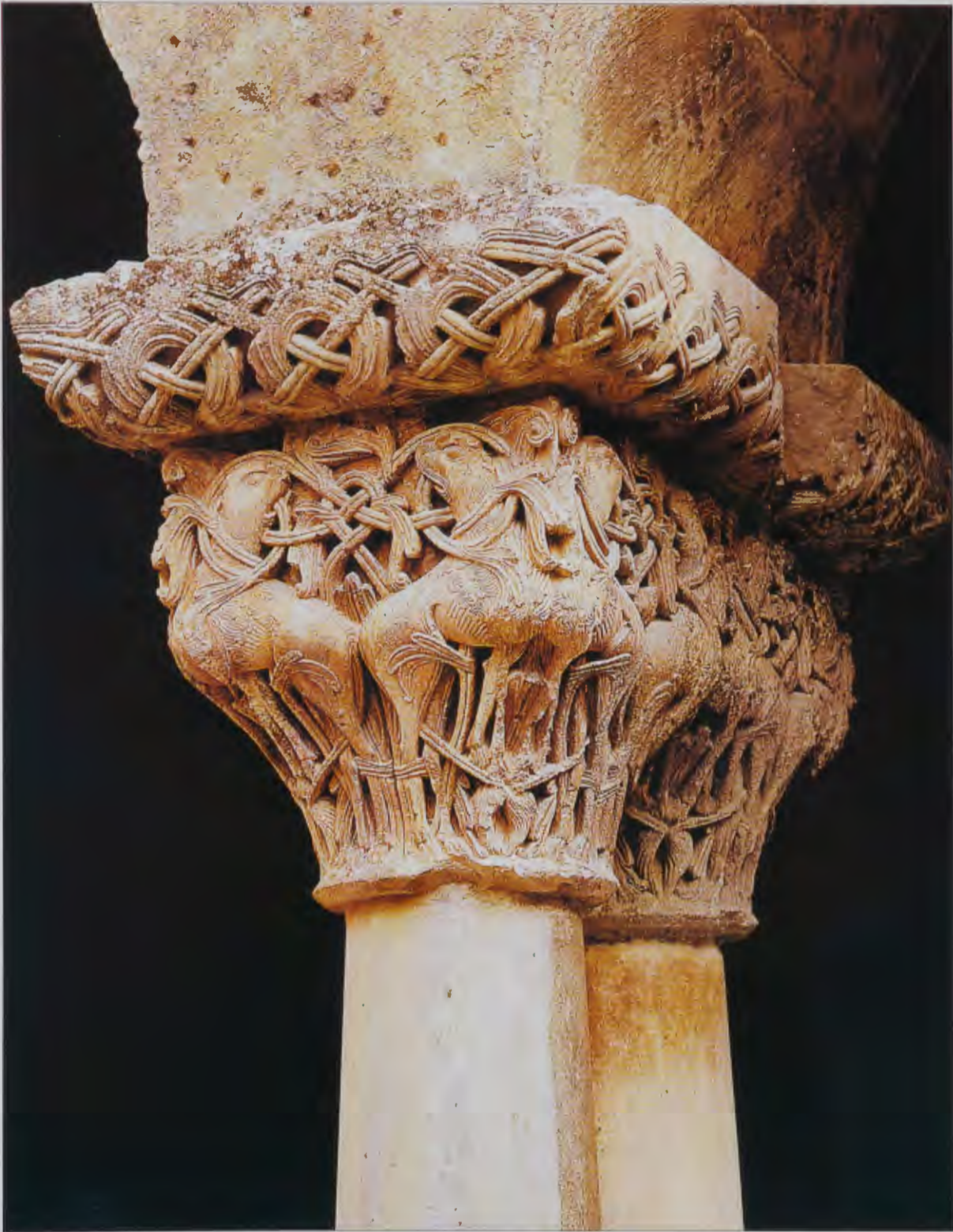
Capitel del primer taller del claustro de la Abadía Benedictina de Santo Domingo de Silos. BURGOS