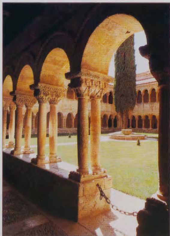
ARCADAS DE LA GALERÍA ORIENTAL

Los orígenes del monasterio son de época visigoda, en torno al s. VII, en antiguos eremitorios rupestres de la zona. El primer monasterio tuvo la advocación de San Sebastián. La repoblación de los siglos IX y X, en la actual provincia de Burgos, influye positivamente en la comunidad silense y conlleva también un renacimiento del monacato, sólo alterado por las incursiones de los musulmanes a finales del X y principios del XI. En 954 el conde Fernán González otorgó al Monasterio una Carta de fueros y franquicias en la que se le reconocía territorio propio y se otorgaba a su abad poder civil, eclesiástico y criminal, así como la exención de impuestos, al mismo tiempo el Monasterio quedaba sometido a la regla de San Benito. Del primitivo templo del s. X de planta basilical de tres naves solo quedan restos arqueológicos.