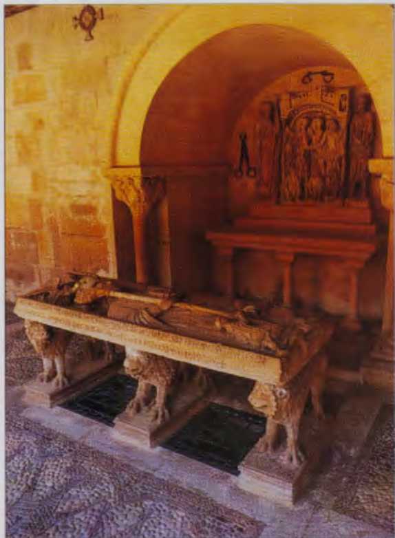
SEPULCRO DE SANTO DOMINGO DE SILOS.

teles. En ella se observa la intervención de varios maestros del s. XII, del tercer maestro, que se caracteriza por un acabado menos detallista, y unas figuras a las que dota de mayor volumen y movimiento; y del cuarto, que esculpe los capiteles historiadados con temas de la infancia y la Pasión de Jesús, con mayor detalle y realismo. En esta galería se encuentra también la cuádruple y retorcida columna central de la galería, tallada en un solo bloque de piedra con un gran capitel en el que se representan escenas de la Pasión de Cristo. En el pilar del ángulo suroccidental del claustro bajo se hallan los relieves del Árbol de Jesé —el peor conservado de todos los grandes relieves— y el de la Anunciación y Coronación de la Virgen que poseen un modelado intenso y un mayor tratamiento del conjunto, parecen ser obra del tercer maestro de Silos, de la segunda mitad del s. XII.