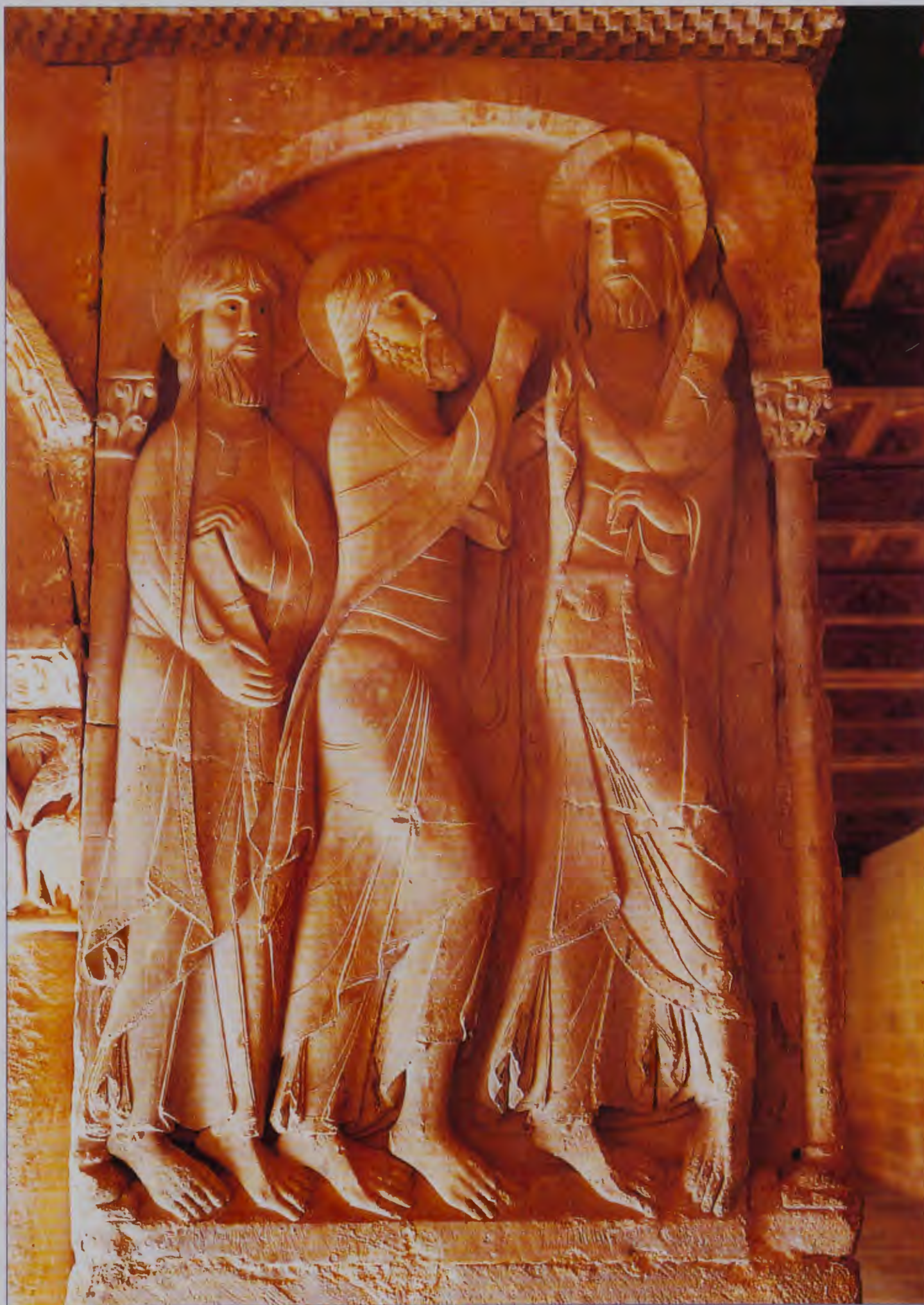
RELIEVE DE LOS DISCÍPULOS DE EMAÚS. MONASTERIO DE SILOS. BURGOS.