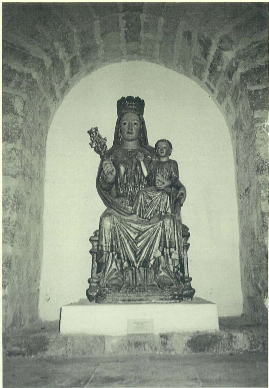
Santa María del Camino