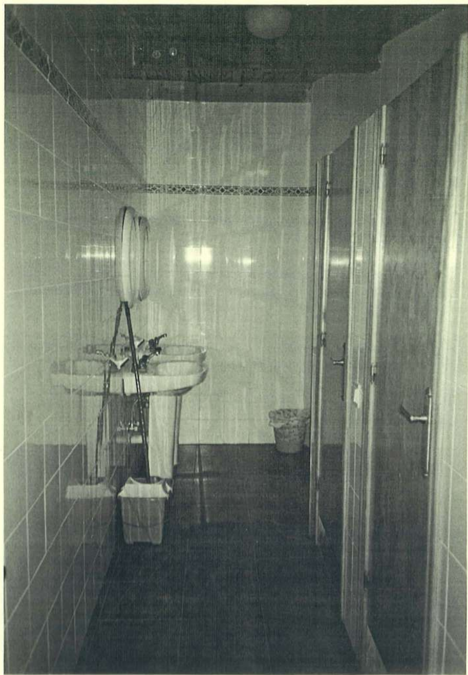
... duchas con agua caliente...