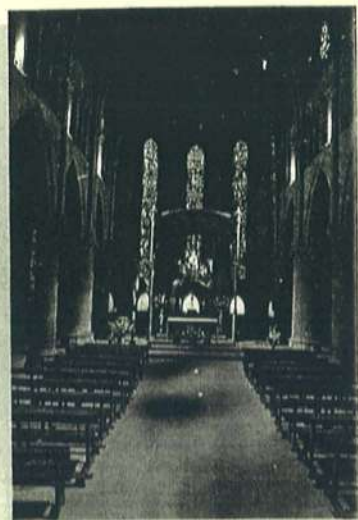
Iglesia de la Colegiata de Roncesvalles

Nuestra asociación se ha ocupado del mantenimiento de esta tradición, permaneciendo, este Año Santo, desde el mes de abril hasta octubre recibiendo y acogiendo peregrinos.