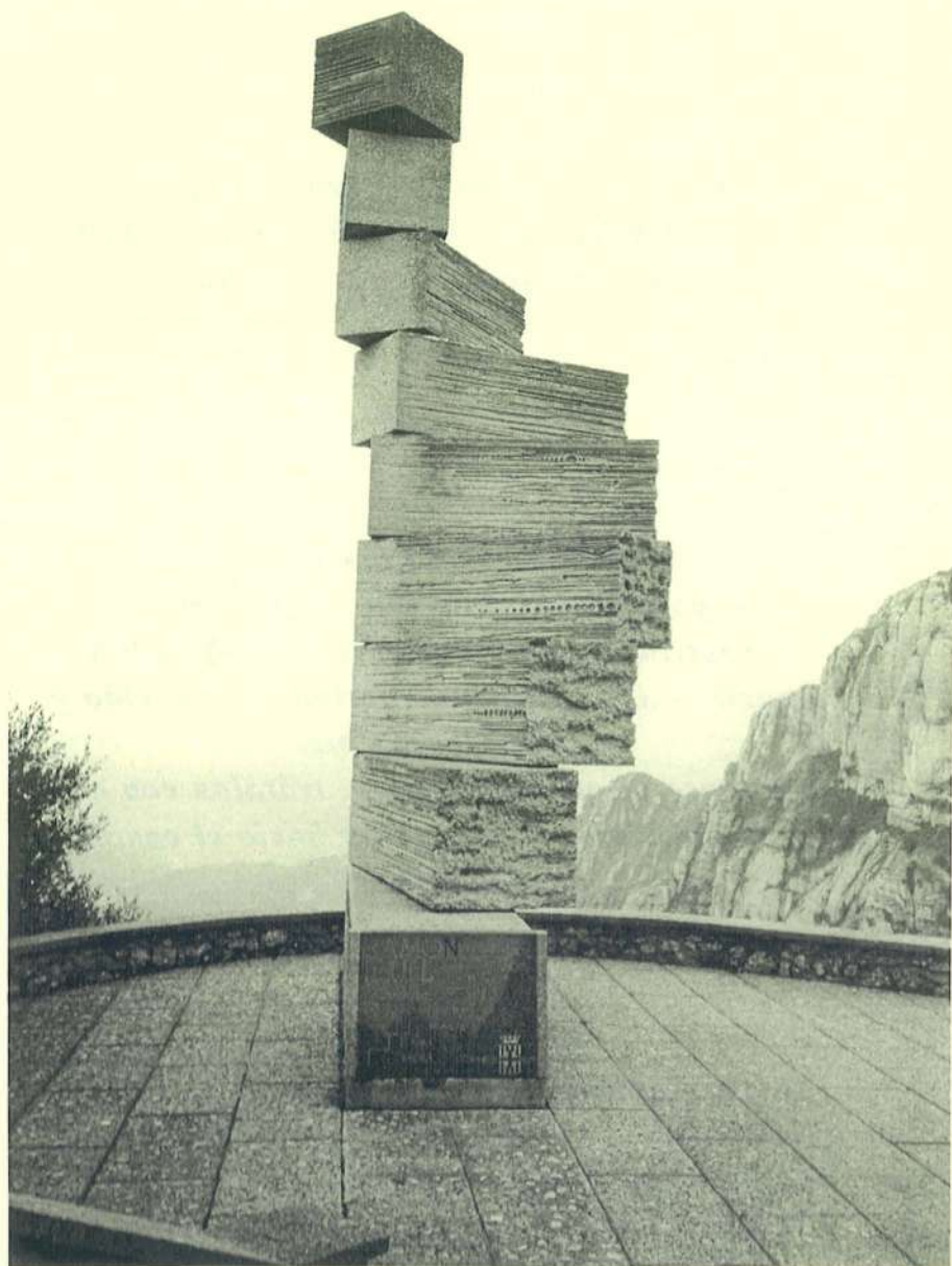
Obra alegórica -la ascensión del hombre- dedicada a R. Llull y situada en Montserrat