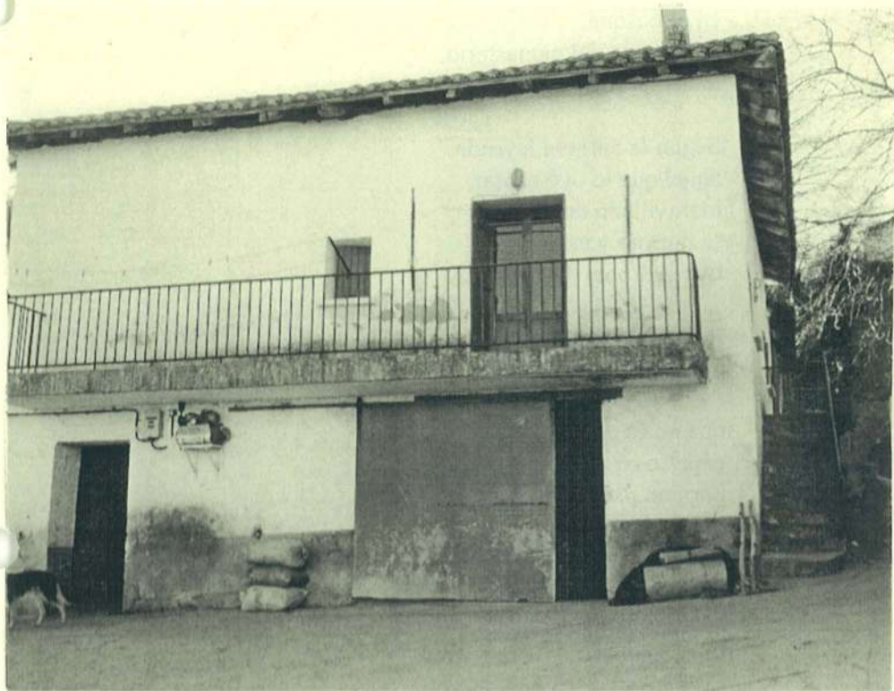
Actual caserío Santitxo, antigua ermita de Santiago