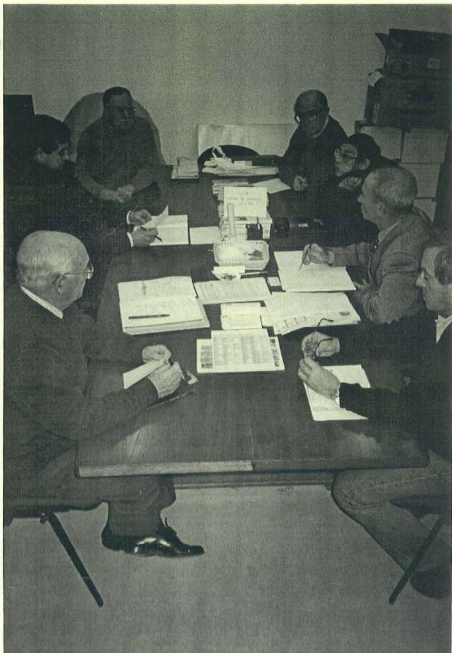
La intención era elaborar un programa