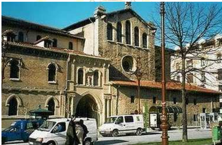
Iglesia de San Nicolas

En Pamplona, además de la catedral, podemos visitar la iglesia gótica de San Cernín, donde se ha instalado el albergue de peregrinos (por el verano funciona también como albergue la Ikastola Amañur), la de San Nicolás, protogótica, y la de Santo Domingo, gótica. Merece la pena darse un paseo por los cascos antiguos de los burgos de Navarrería, San Cernín y San Nicolás, contemplar la fachada barroca del Ayuntamiento, la plaza del Castillo, el Paseo de Sarasate y la plaza de San Francisco, visitar los museos de Navarra y el Diocesano y gozar de sus numerosos parques, especialmente de Taconera y la Ciudadela.