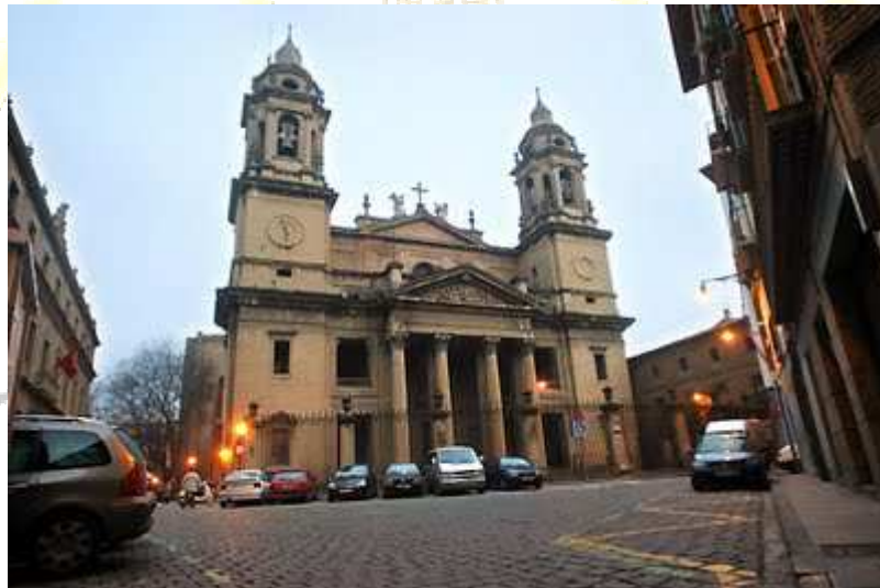
Ayuntamiento y catedral de Pamplona

P amplona/Iruña fue y es un hito importante en el Camino de Santiago, que hace su entrada en la ciudad por el puente de la Magdalena, para dirigirse bajo el Baluarte del Redín, hasta el Portal de Francia. Enfila la calle del