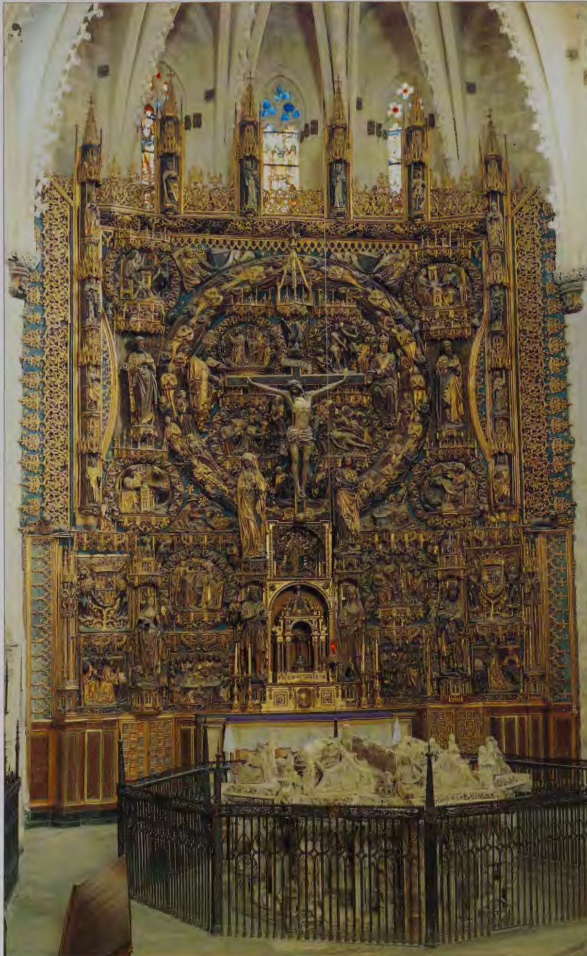
Retablo de la CARTUJA DE MIRAFLORES. BURGOS.