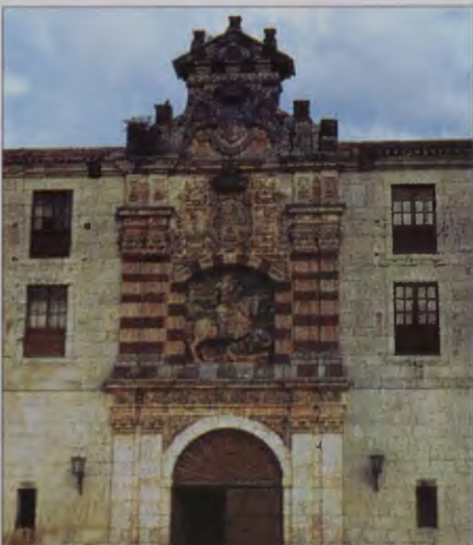
MONASTERIO DE SAN PEDRO DE CARDEÑA

El 6 de agosto de 953 la abadía fue arrasada por los árabes, contándose que el abad Esteban y los 200 monjes del monasterio fueron decapitados en el claustro, que aún conserva una de sus arcadas de ese período. En 1603 estos monjes fueron reconocidos como mártires, de ahí el nombre con el que se conoce también a la abadía, de Santa María de los Mártires.