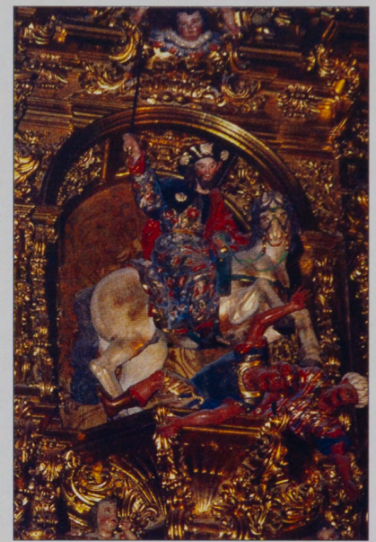
SANTIAGO DEFENSOR DE LA FE. Capilla de Santa Tecla. Catedral de Burgos.