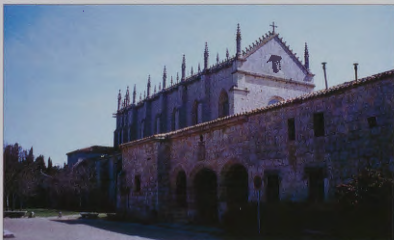
CARTUJA DE MIRAFLORES

A un lado se sitúa el sepulcro del príncipe don Alfonso, hermano de Isabel, dispuesto en forma de arcosolio flanqueado por pilastras. Gil Siloe es también su autor. Posee una minuciosa y rica decoración vegetal y de santos... Lo preside San Miguel venciendo al dragón y