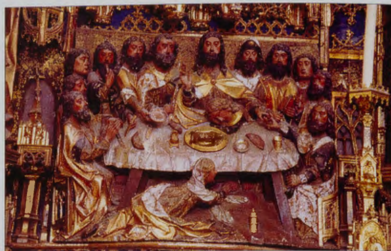
"La última cena". CARTUJA DE MIRAFLORES

En el s. XI, bajo el abadiato de San Sisebuto, Cardena se reconstruyó en el estilo románico (de cuyo conjunto nos queda la torre) y aceptó los usos de Cluny.