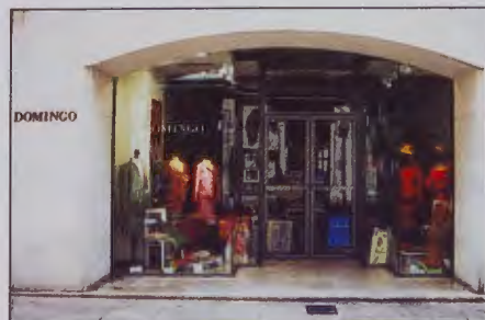
Almirante Bonifaz, 6 Telf. y Fax: 947 20 16 61