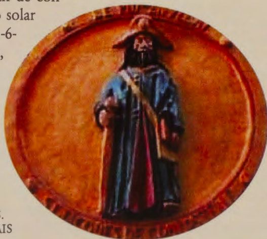
SAINT JACQUES. LE PUY EN VELAIS

Así que han de conjugarse el ciclo solar de 28 años (11-6-5-6) que sigue, por ejemplo, el año jubilar compostelano y el ciclo lunar de 19