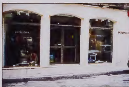
Moneda, 5 Telf.: 947 20 32 92

HAY ESPACIO LIBRE PARA PUBLICIDAD DE EMPRESAS GESTIONADAS POR SOCIOS NUESTROS.