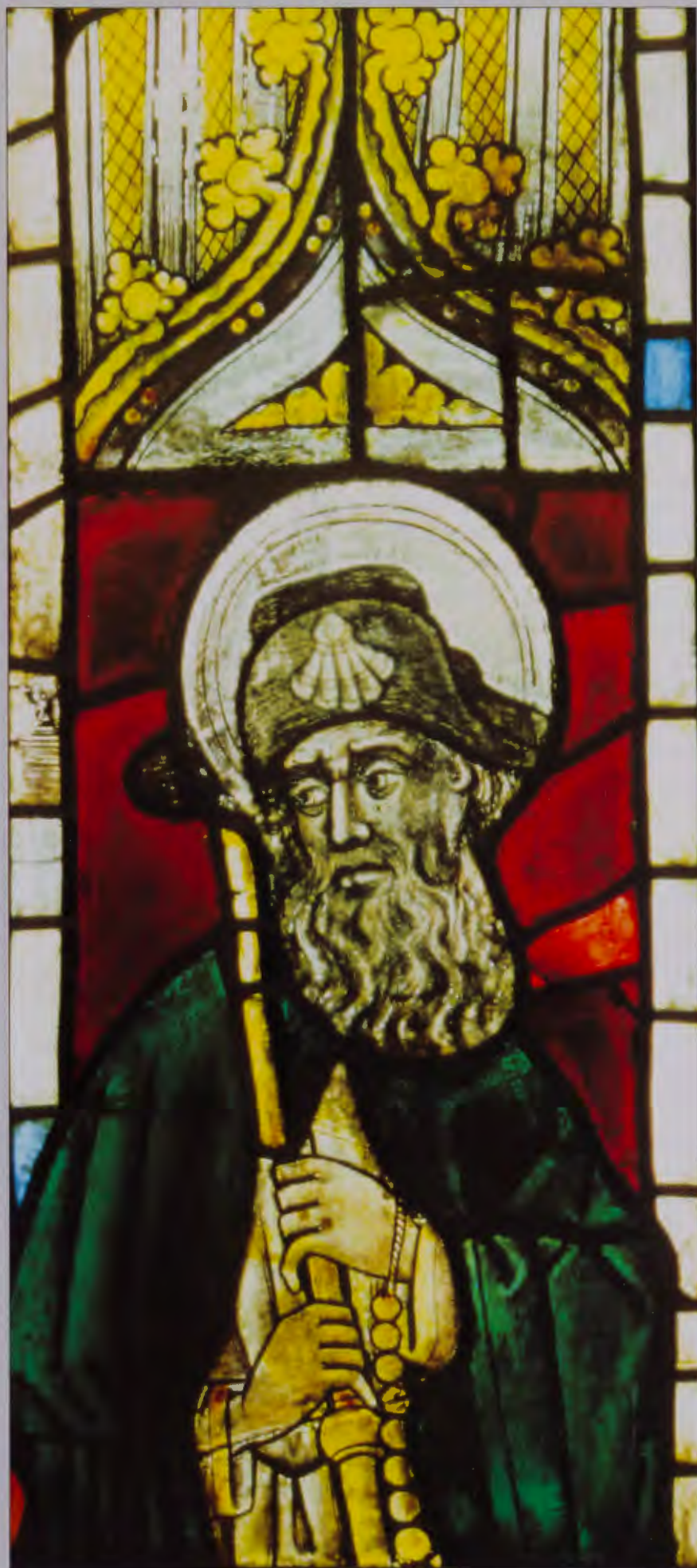
VIDRIERA DEL SIGLO XV. IGLESIA DE STA. M. a DE LOS REYES DE GRIJALBA. Restauración: VIDRIERAS BARRIO.