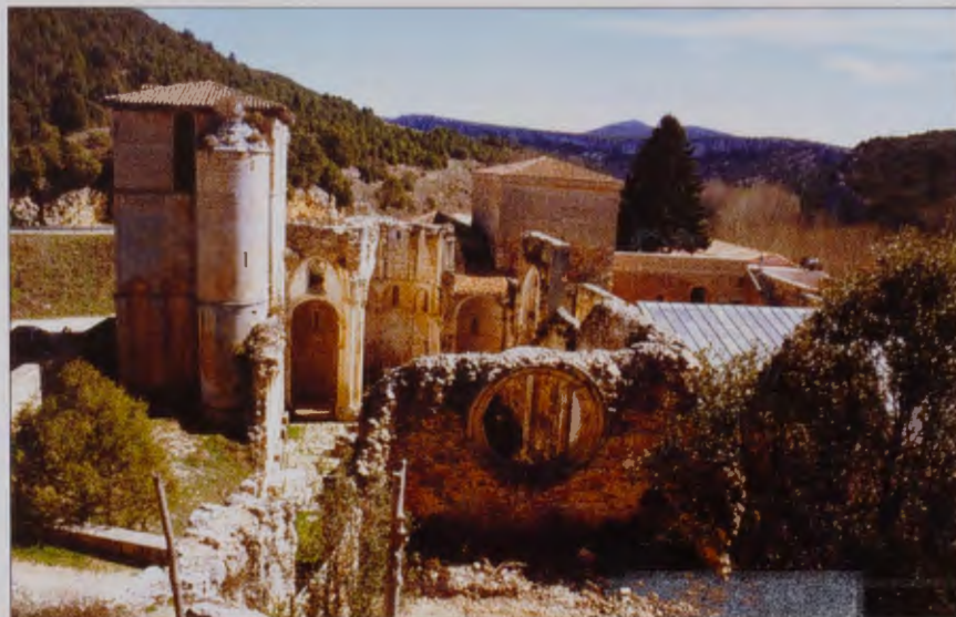
SAN PEDRO DE ARLANZA.