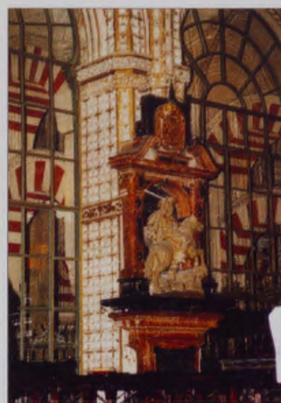
SANTIAGO MATA MOROS. Mezquita de Córdoba.