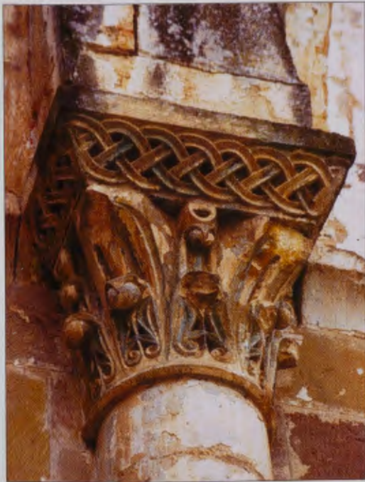
DETALLE. SAN PEDRO DE ARLANZA.

El rey Fernando I de Castilla, ya en el siglo XI, tendrá muy buenas relaciones con el monasterio y con su abad, San García, nacido en la localidad de Quintanilla, cerca de Briviesca. Este abad será el que introduzca el arte románico en el monasterio, del que nos queda el testimonio en la torre, la planta y los ábsides. El templo se fue enriqueciendo siglo a siglo, reformándose en el XV las bóvedas, en los siglos XVII y XVIII se construyeron el claustro y la hospedería. Pero el s. XIX, con la desamortización y la expulsión de los monjes, supuso la desaparición de libros, joyas, y de los edificios. Los cuerpos del conde Fernando y de su esposa se trasladaron a Covarrubias, y muchas de sus obras de arte se repartieron por diversos lugares: Burgos, Madrid, Nueva York.