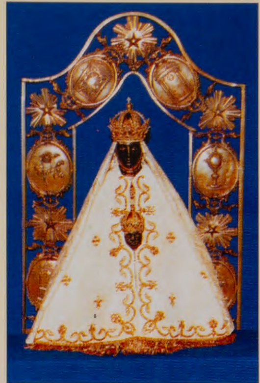
IMAGEN DE NÔTRE DAME DU PUY.