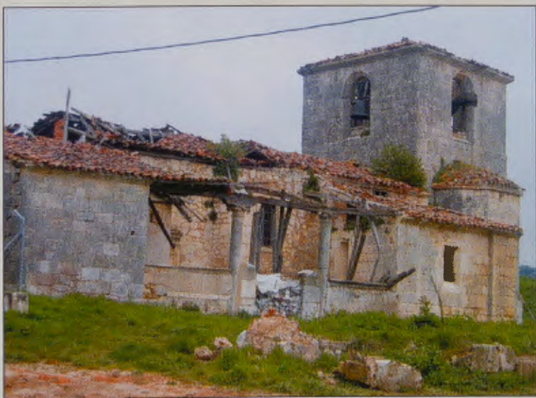
RUINAS EN VILLALVAL.

Y es que el Camino está sobrado de buenas palabras y mejores deseos. El Camino, ahora, necesita realidades, hechos, actuaciones. Sólo entonces (¡ojalá esté cercano el día!) arrumbaré este réquiem y entonaré un gozoso Te Deum.