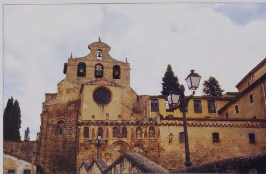
IGLESIA DEL MONASTERIO DE SAN SALVADOR DE OÑA.

A partir de la muerte del rey García de Nava-