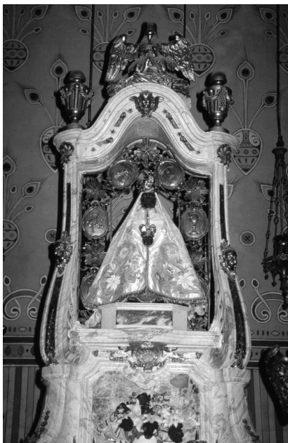
LE PUY-EN-VELAY: Imagen de la Virgen Negra “Notre Dame du Puy”.

Fruto cultural de este clima religioso, mariano y peregrino, que en aquellos tiempos medievales henchía el alma colectiva de la pequeña villa episcopal de Le Puy, es su espléndida catedral románica; en la que algunas huellas del arte musulmán español denotan la interrelación que se había establecido con la Hispania de la época.