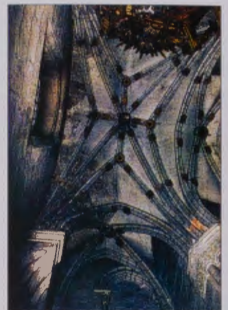
Capilla de San Juan de Sahagún

Anexa a ésta se sitúa la vecina Capilla de las Reliquias, obra del siglo XVIII.