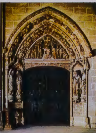
Puerta del Claustro.

El hastial del brazo sur del crucero tiene un espectacular desarrollo en alzada. Sobre la portada se sitúa un bello rosetón que conserva una hermosa vidriera de principios del s. XIV. Como remate de todo el conjunto se desarrolla la escena de la "Divina liturgia": Cristo eucarístico rodeado de ángeles.