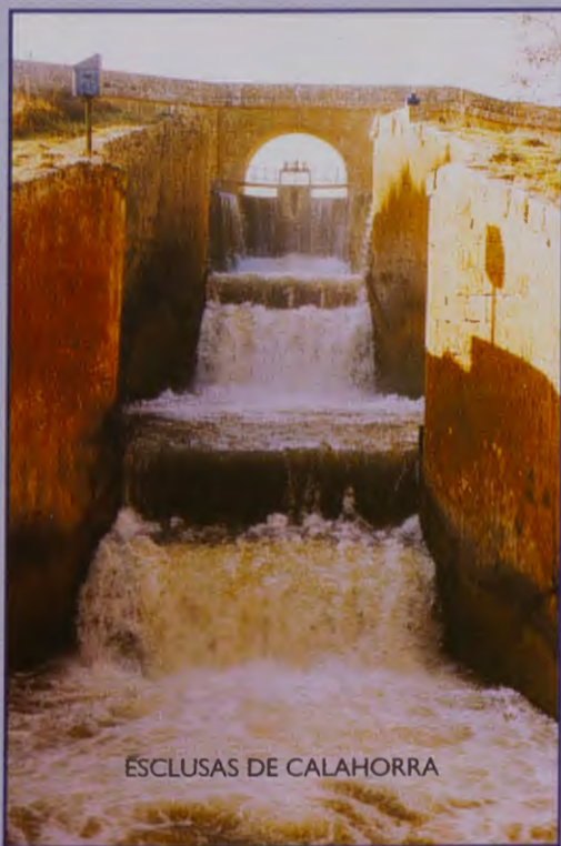
ESCLUSAS DE CALAHORRA

con el que en determinadas ocasiones el coro de niños cantaba. Y también recuerda los enfados de los mayores porque los niños siempre desafiaban.