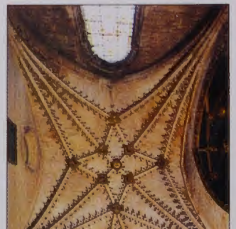
Capilla de La Concepción o de Santa Ana

Un pequeño retablo dedicado a Santa Ana, la Virgen y el Niño, al que flanquean las imágenes de San Bartolomé y San Vitores. Es obra de 1522 del taller de Diego Siloe.