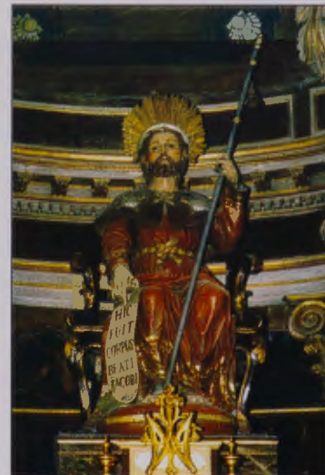
IMAGEN DE SANTIAGO. Iglesia de Padrón. La Coruña