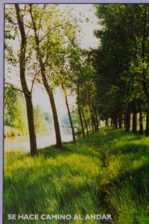
SE HACE CAMINO AL ANDAR

El peregrino no lo sabe, pero él también es ya un cautivo.