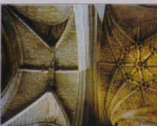
Capilla de la Visitación

Se sitúa frente a la portada del claustro. Fue fundada por el obispo don Alonso de Cartagena, a mediados del s. XV, para enterramiento suyo y el de sus familiares. Pero es sin lugar a dudas el sepulcro del obispo el que más destaca en el centro de la capilla. Es un sepulcro exento, cuyo cuerpo inferior, realizado en pie-