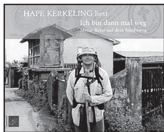
Portada del libro

En los últimos meses se ha notado un crecimiento del número de peregrinos alemanes mucho mayor al de cualquier otra nacionalidad, rivalizando ya en cifras con franceses o italianos. La explicación se llama "Ich bin dann mal weg" ('Me marcho'), un libro del humorista