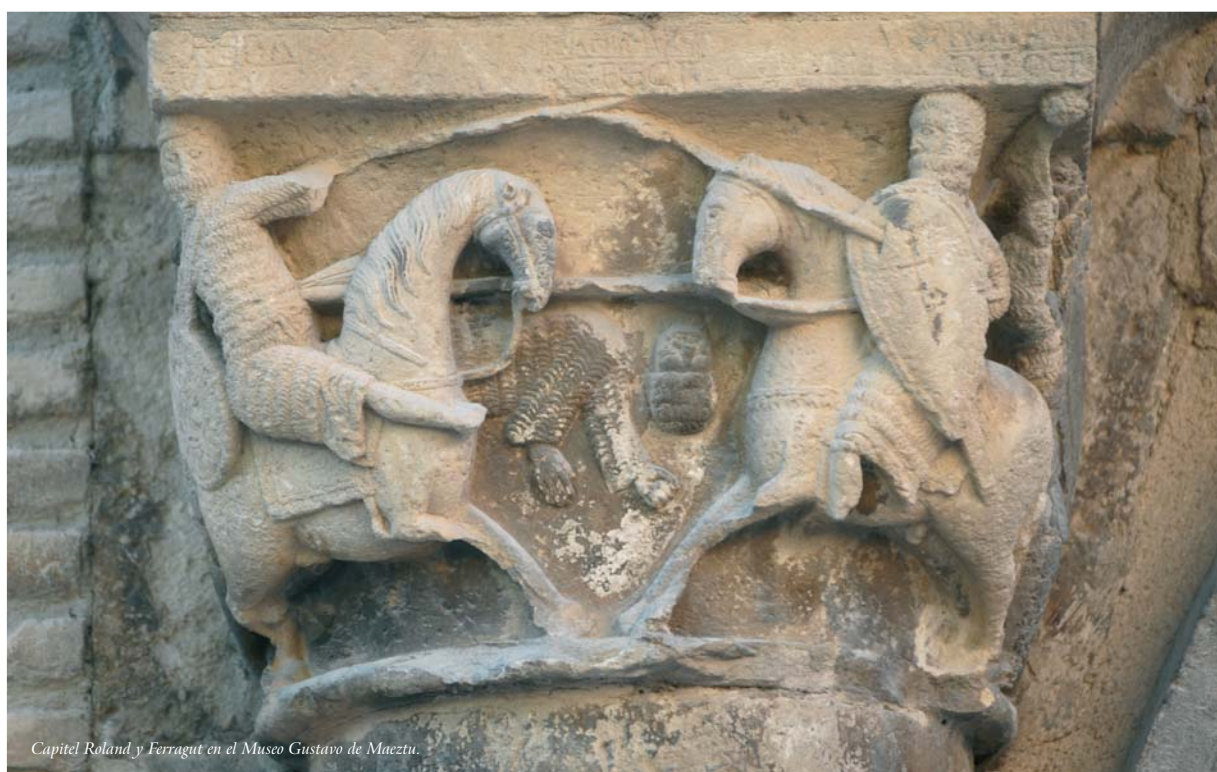
Capitel Roland y Ferragut en el Museo Gustavo de Maeztu.