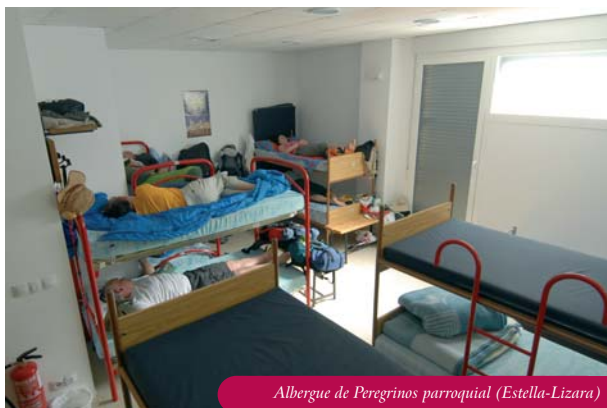
Albergue de Peregrinos parroquial (Estella-Lizara)

ciones da una separación media de tan solo 6 kilómetros entre lugares con albergue frente a los 7,1 kilómetros del año pasado. La distancia más elevada sin albergue de peregrinos que debe transitar un caminante son los 21,5 kilómetros que separan Roncesvalles de Zubiri. El caso opuesto son los escasos cuatrocientos metros que hay entre los albergues de la Trinidad de Arre y Villava. Estella y Los Arcos son las poblaciones con más albergues, con cuatro cada una, seguidas de Zubiri, Puente la Reina y Torres del Río, que tienen tres. De las 24 localidades del Camino Francés con albergue, 17 tienen cajero automático, otras 17 cuentan con farmacia y 20 con asistencia médica. En cinco localidades no hay tienda de comestibles aunque, eso sí, hay bar en la totalidad de los sitios. Tan solo un 15% de las poblaciones con albergue tienen un taller de reparaciones especializado en bicicletas.