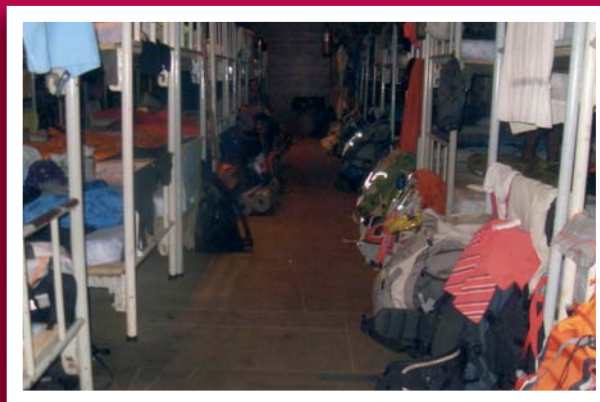
3 er premio Eyre Landa (COIN - Málaga)