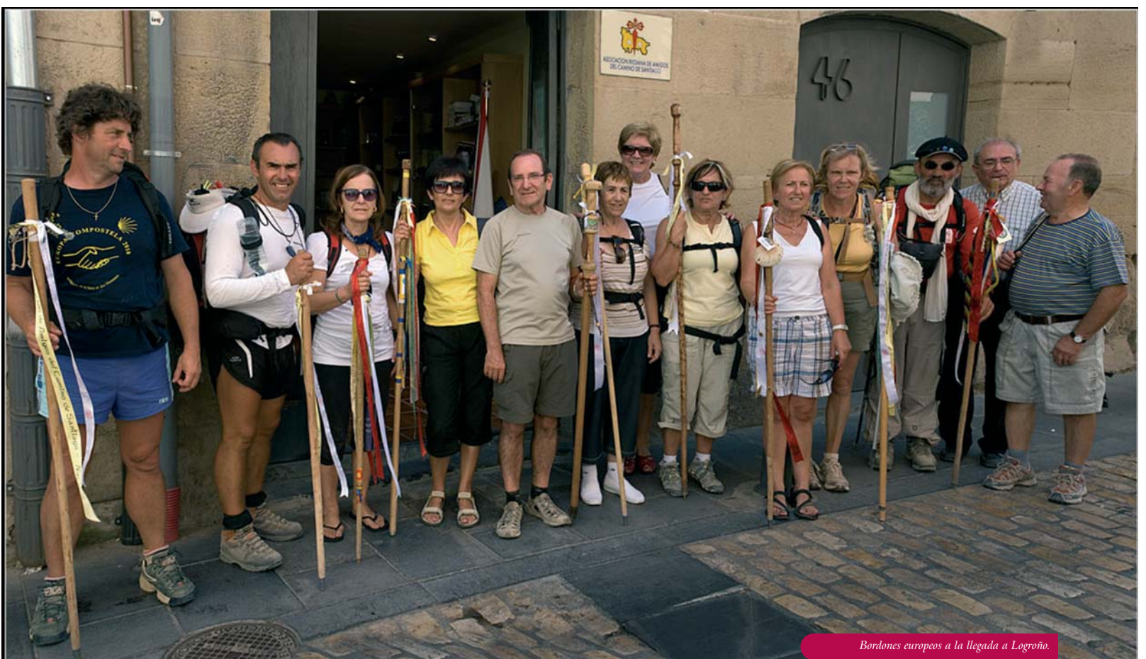
Bordones europeos a la llegada a Logroño.