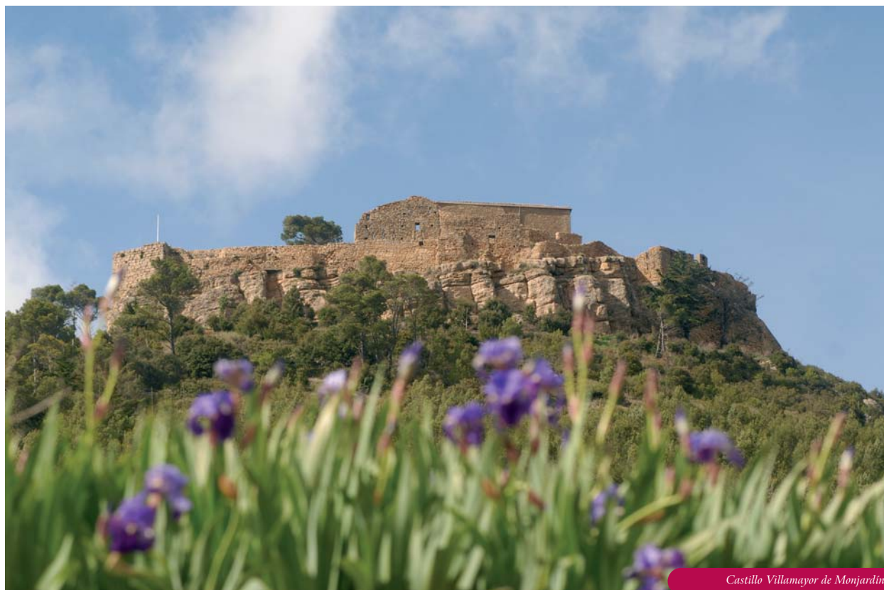
Castillo Villamayor de Monjardín

monte cara al pueblo, dejando un triste aspecto, con el color ceniciento por el furor de las llamas. Éstas arrasaron todos los árboles del monte cara al Sur. A mi llegada a casa de las excursiones, les contaba las historias de Don Florencio, como la guerra de los Carlistas.