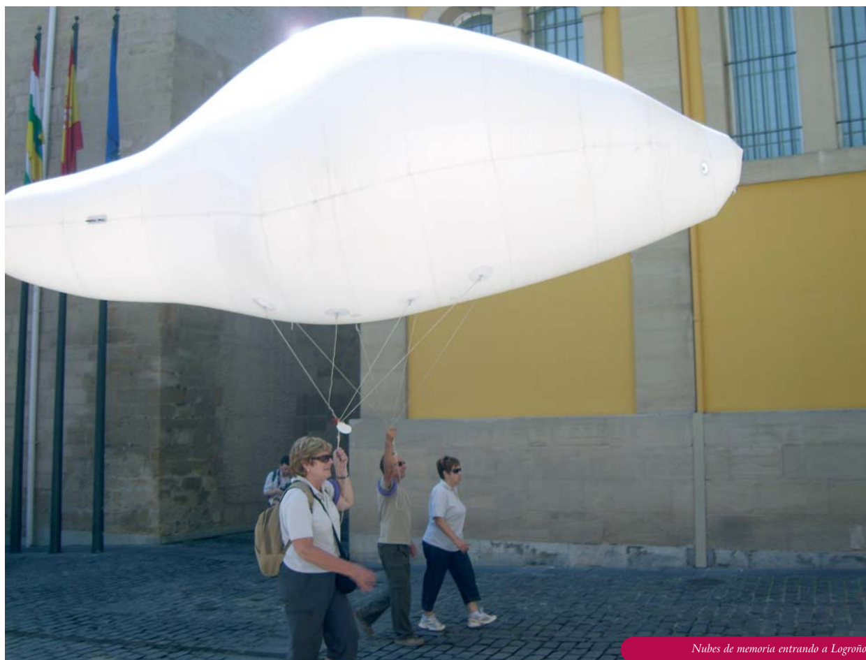
Nubes de memoria entrando a Logroño

Entre el 30 de junio y el 10 de octubre de 2010, se mostró en Pamplona, en el Museo de Navarra la exposición ARS ITINERIS. EL VIAJE EN EL ARTE CONTEMPORÁNEO , que formaba parte del programa de actividades diseñado por la Sociedad Estatal de Conmemoraciones Culturales (SECC) del Ministerio de Cultura, en colaboración de la Fundación “La Caixa” y las Comunidades Autónomas del Camino de Santiago, con motivo de la celebración del Año Jacobeo 2010.