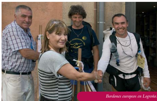
Bordoneros europeos en Logroño.