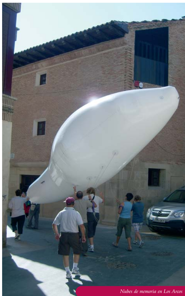
Nubes de memoria en Los Arcos