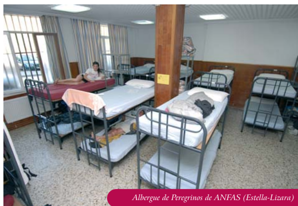
Albergue de Peregrinos de ANFAS (Estella-Lizara)