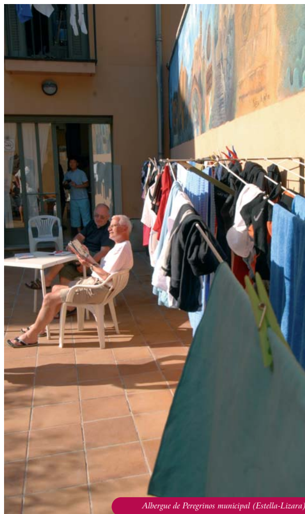
Albergue de Peregrinos municipal (Estella-Lizara)

Mientras que desde Roncesvalles parte entre un 5 y un 7% de todos los peregrinos que llegan a Santiago, desde el alto de Somport inician esta aventura un 0,4%. Esto explica que en los 63 kilómetros navarros del Camino procedente de Somport haya solo 5 albergues de peregrinos, una cifra inalterada durante la última década. La apertura del nuevo y completo albergue de Tiebas, que sustituyó al anterior, fue la nota positiva. Tres son municipales, uno de la Sociedad Recreativa San Martín, que tiene en proyecto construir uno nuevo para reemplazar el actual, y otro parroquial. Salvo Monreal, con 25 plazas, el resto tiene 14 e incluso menos de diez plazas de capacidad. Respecto a la pobre afluencia de la temporada estival durante el Año Santo en Navarra, uno de los hospitaleros del Camino Aragonés apunta que de media alojó a 5 peregrinos diarios durante el verano de 2010 y que durante esta primavera estaban llegando al albergue en torno a 10 personas. Los albergues de Izco, Monreal y Tiebas abren todo el año, el albergue de Sangüesa solo cierra en diciembre y el parroquial de Santa María de Eunate está siempre disponible salvo del 15 de diciembre al 15 de enero. El precio medio de los albergues sube a 6,6 euros, un euro más que en febrero del año pasado. El parroquial es de donativo y el resto oscila entre los 5 y los 8 euros.