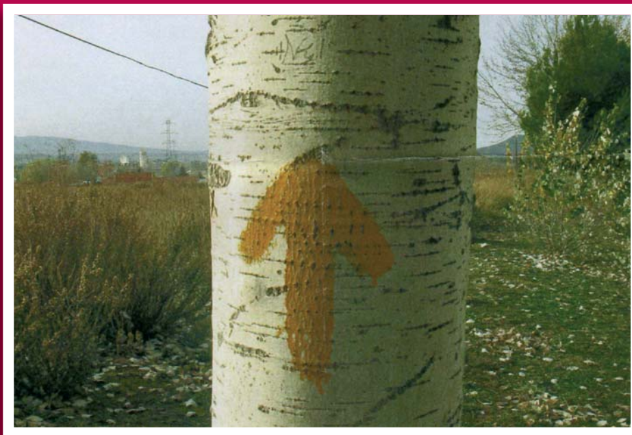
1 er premio Blanca Puente (Estella)