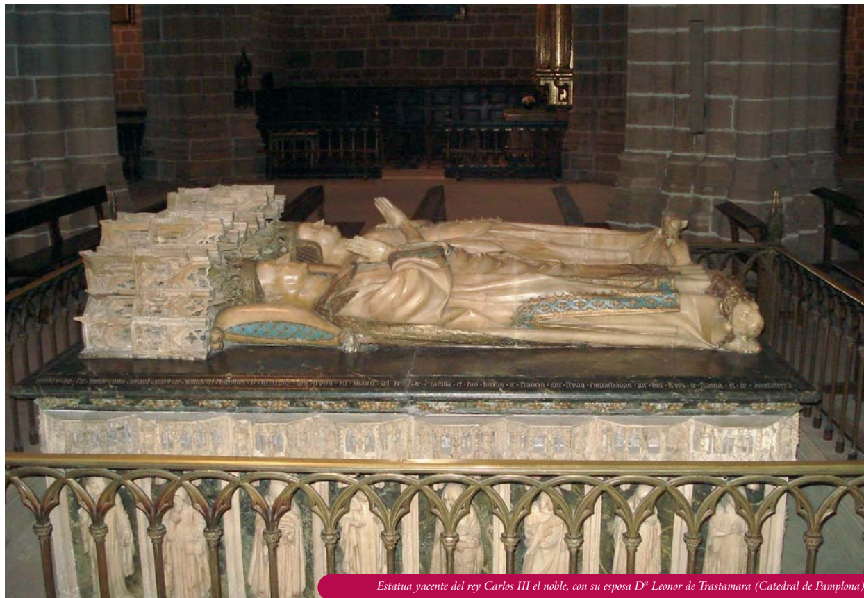
Estatua yacente del rey Carlos III el noble, con su esposa D a Leonor de Trastámara (Catedral de Pamplona)