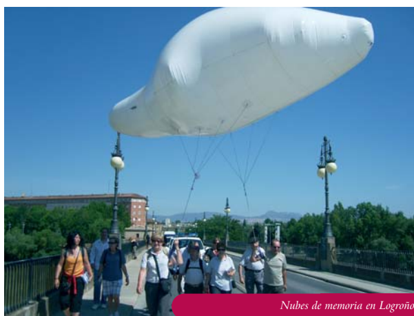
Nubes de memoria en Logroño

transportadas por voluntarios y peregrinos. Así se inició un viaje, que a lo largo de la ruta, iría reuniendo a las siete nubes para llegar a Santiago. Cada nube inició su recorrido en el museo o centro de arte en que se encontraba (el Museo de Huesca; la Sala del Banco Herrero, en Oviedo; el Museu de l'Art de la Pell, en Vic; el Museo do Mar, en Vigo; la Sala Amós Salvador, en Logroño; el Museo Artium de Vitoria y el Museo de Navarra).