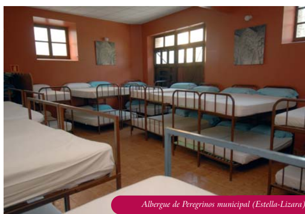
Albergue de Peregrinos municipal (Estella-Lizara)

no ha variado el número y aunque sufre una gran carencia de plazas cabe destacar las completas instalaciones del albergue del Concejo de Tiebas. En el Camino Francés ha aumentado hasta 40 pese a que este año no ha abierto sus puertas el albergue parroquial de Villamayor de Monjardín.