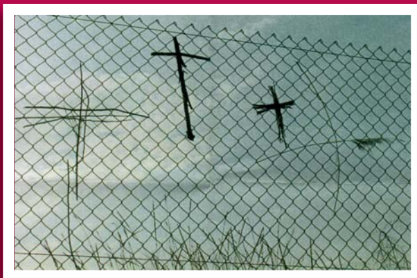
2 o premio M a Carmen Echávarri (Oteiza)