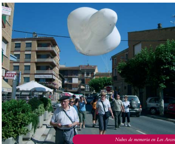
Nubes de memoria en Los Arcos