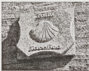
Detalle en la iglesia de Mallén