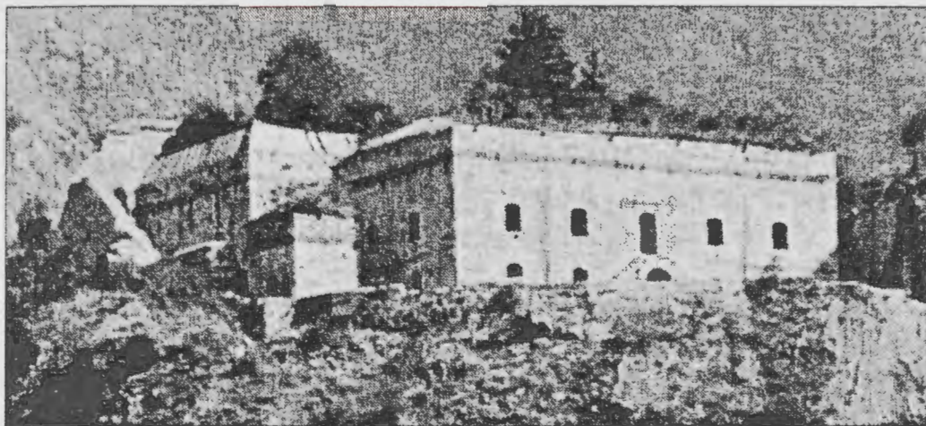
El Fuerte Coll de Ladrones

mármol sin pulir y a prueba de asedios, sobre una imponente terraza. Destinado para la guerra, la diosa fortuna quiso no viera ninguna acción bélica en toda su existencia.