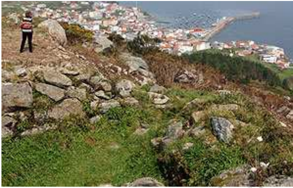
Entorno del yacimiento de San Guillermo y, al fondo, Fisterra

La tercera fase de excavación del yacimiento del entorno de la ermita de San Guillermo (Fisterra) comenzaron el pasado 11 de Noviembre, con el objetivo de descubrir otros cuatrocientos metros cuadrados y de consolidar y restaurar las estructuras descubiertas.