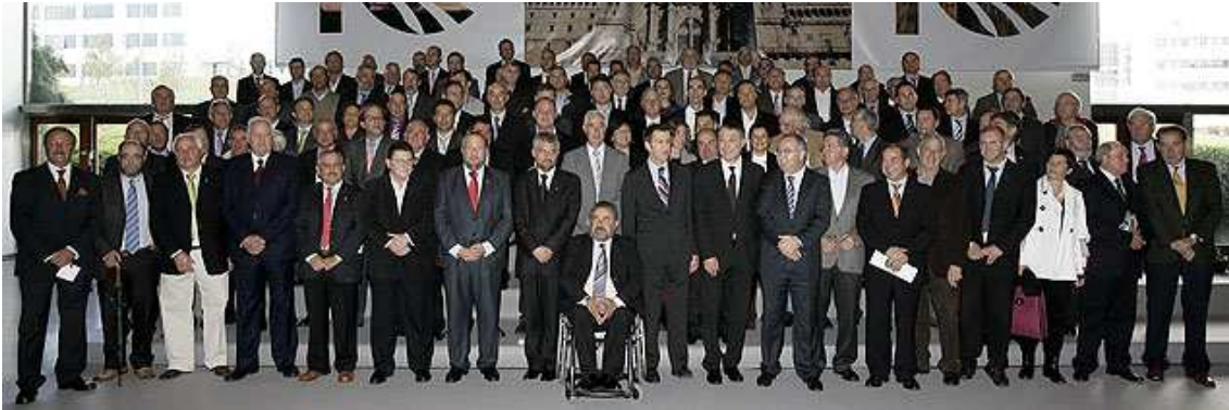
Foto de familia del presidente Alberto Núñez Feijóo y el conselleiro de Cultura con los alcaldes gallegos que ayer arroparon la presentación del Año Santo en Compostela