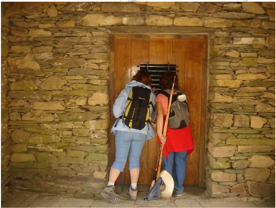
Camino Frances, 2009.