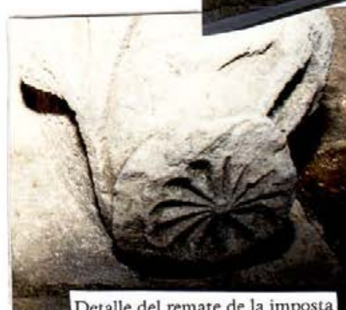
Detalle del remate de la imposta