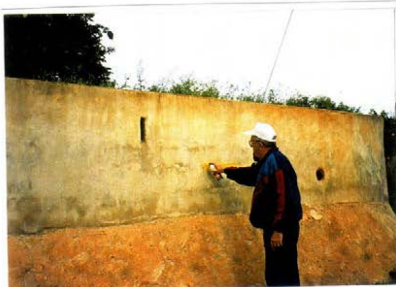
Ricardo Silla 1997