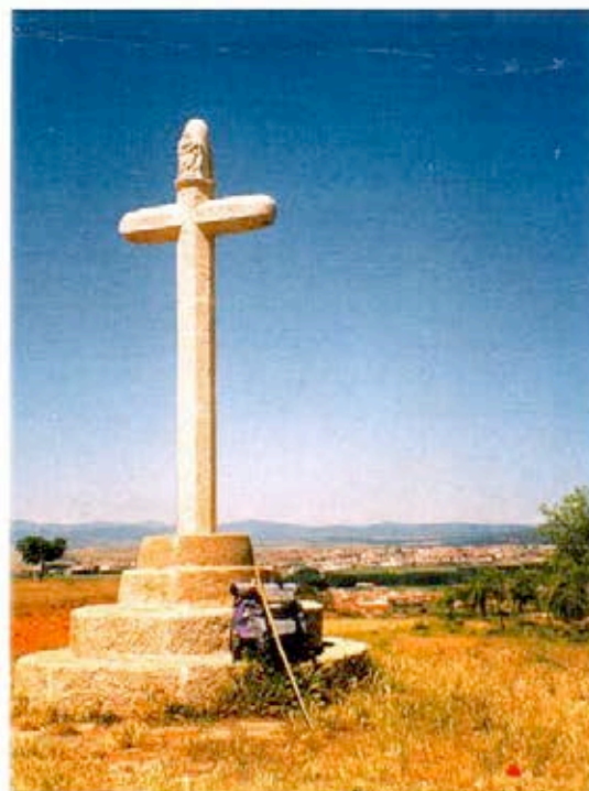
Crucero de Santo Toribio