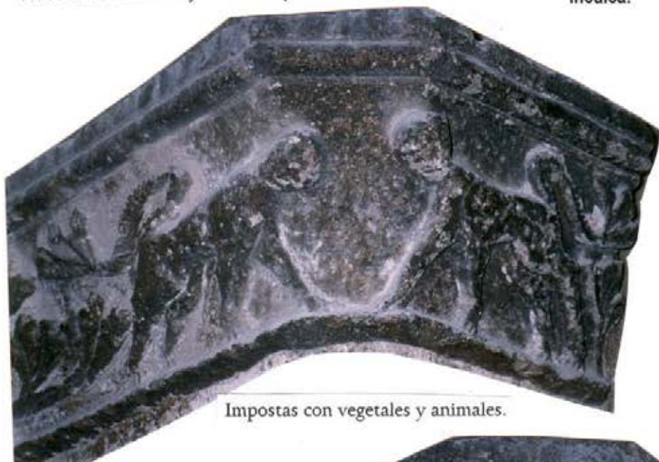
Impostas con vegetales y animales.

Castellón de la Plana y su provincia. A.A.V.V. Edit. Inculca.