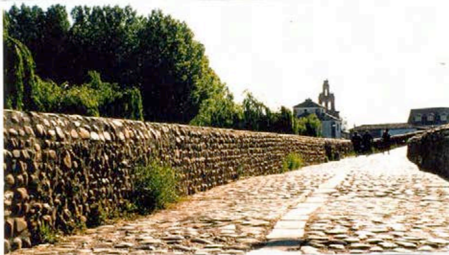
Puente del paso Honroso

- Hijos míos, dad gracias a Dios por habernos encontrado y ahorraros un montón de kilómetros... Riéndose dieron vuelta atrás. Pronto encontramos nuestra meta y a la pareja de alemanes del Burgo Ranero.