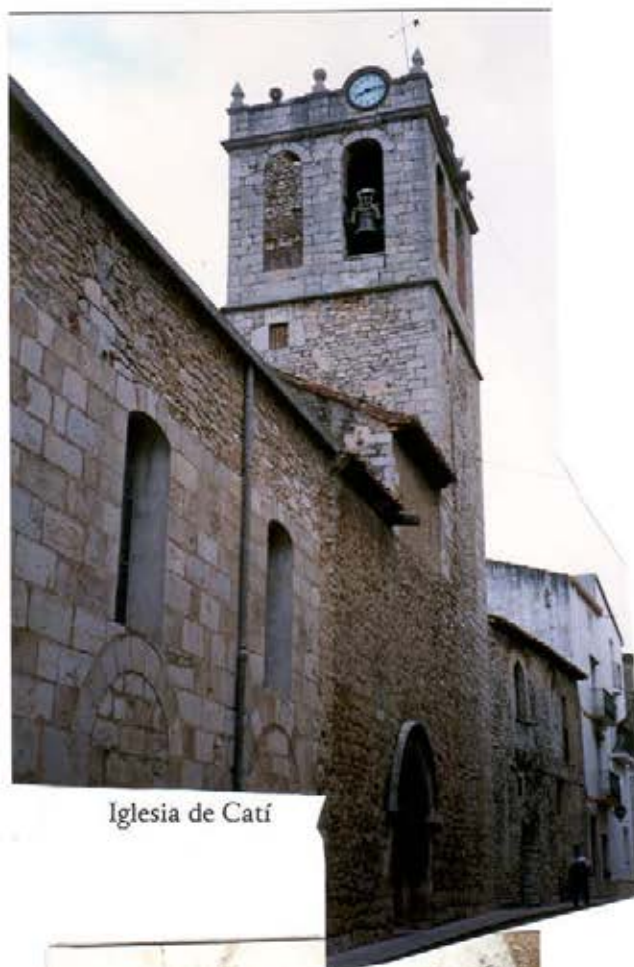
Iglesia de Catí

Este tipo de estructura, más o menos enriquecida, es común a la arquitectura valenciana del siglo XIII y posee un buen número de ejemplos en toda la Comunidad.