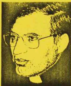
ANTONIO M. ROUCO Arzobispo de Santiago de Compostela

Esta convocatoria jubilar, acuñada por la historia, no es una celebración más, es una llamada de indudable motivación religiosa. Marcará profundos hitos culturales, políticos, religiosos.