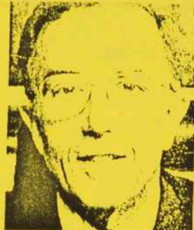
MARCELINO OREJA Pte. comisión institucional en el Parlamento Europeo, PP

Un sentido cristiano y jubilar que se fundamenta en la búsqueda y en el encuentro de la Gracia del Señor con el hombre. La Iglesia ofrece el perdón y la comunión con el Señor y hermanos.