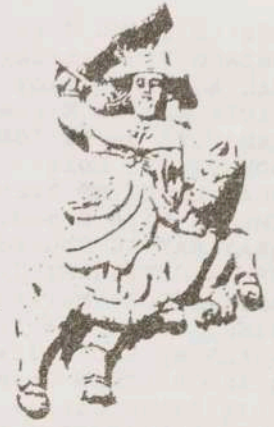
Santiago Caballero: Relieve en la fachada de la Iglesia de la Compañía de Jesús. Arequipa (Perú). Siglo XVIII