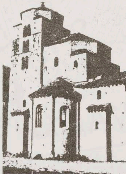
Monumentos del Camino de Santiago Iglesia de Sta. Cruz de la Sorde (Huesca)