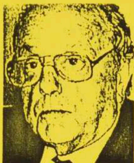
MANUEL FRAGA Presidente de la Xunta de Galicia

¿QUE SENTIDO HA DE TENER EL AÑO SANTO JACOBEO '93?