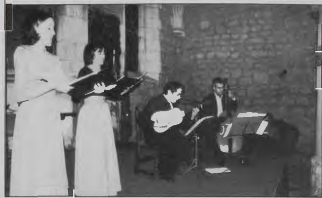
GRUPO DE CÁMARA "LA DAFNE"

dad histórica a la imagen devocional". El viernes tuvo lugar un precioso concierto en la Sala Capitular del antiguo Monasterio de San Juan con la participación del GRUPO DE CÁMARA "LA DAFNE" que interpretó "Música del Renacimiento italiano y español". El sábado 27 concluyó la Semana con la concurrencia de muchos socios a la Cena de Hermandad.