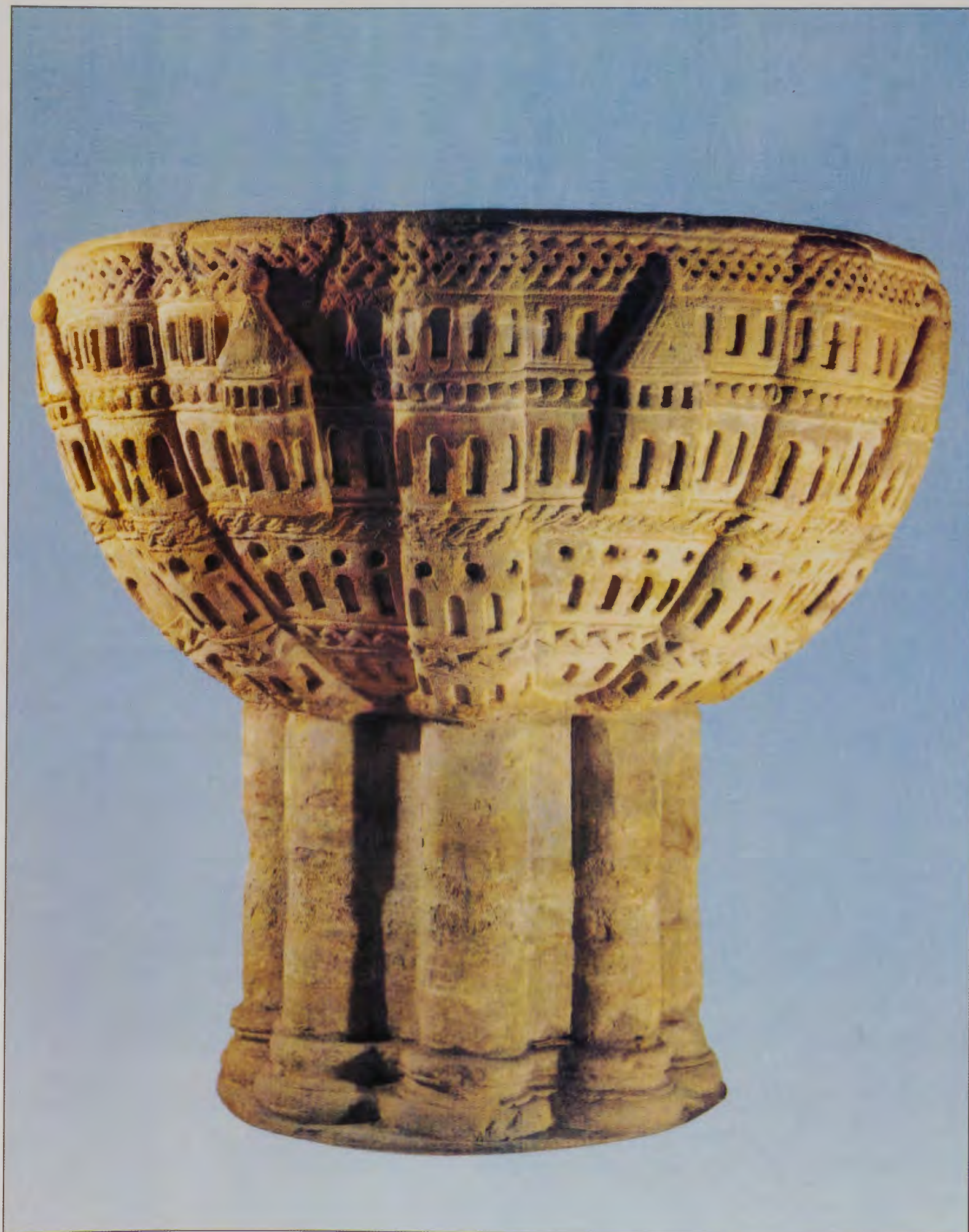
Románico burgalés. Pila bautismal (S. XII) Redecilla del Camino. (Burgos).