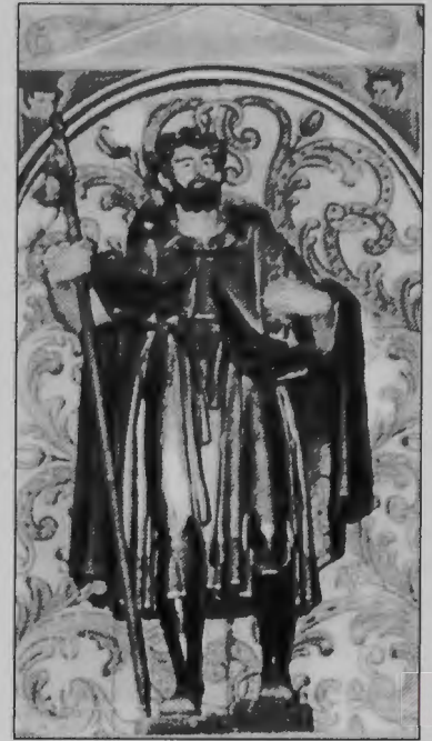
Santiago Apóstol, Iglesia de Santa María. Belorado.