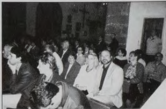
En Misa. Grupo de congresistas atentos a la Sta. Misa. (Otros atentos a la cámara del fotógrafo).

H ubo seria expectativa de lo que pudiera dar de sí el V Congreso Internacional de Asociaciones Jacobeas que se ha celebrado en Cee, de la Federación Neria, en las instalaciones de Fernando Blanco de dicha localidad.