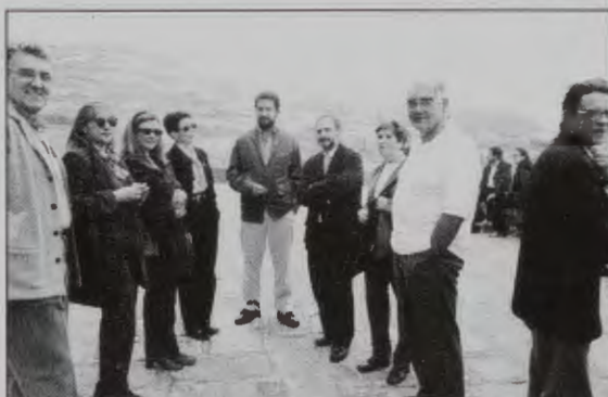
En la terraza. Esperando el toque a misa un grupo de congresistas con nostalgia por lo que se acaba. En el grupo miembros de nuestra asociación asiduos a todos los congresos de asociaciones jacobneas. Esta vez "na costa da morte".

1.- Como la zona es de fácil acceso para quien la conoce pero no para los forasteros, nosotros habríamos enviado a cada congresista un plano de aproximación a las localidades de Neria, conciso y claro.