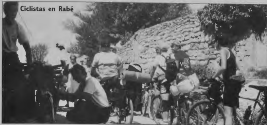
Ciclistas en Rabé