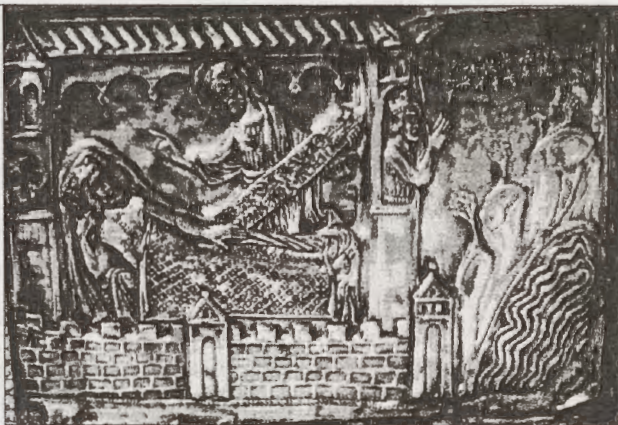
Relicario que guarda los restos de Carlomagno.

tiempo se aclararon las relaciones con el emperador Carlomagno a quien el rey tiene consideración y respeto pero sin renunciar a sus derechos soberanos. Durante su reinado tuvo lugar el descubrimiento de la tumba del Apóstol Santiago el Mayor, en fecha no muy precisa pero que generalmente se admite que fue el 813 d-C. Al poco tiempo, el culto a la tumba del Apóstol se extiende más allá de los Pirineos y se difunde