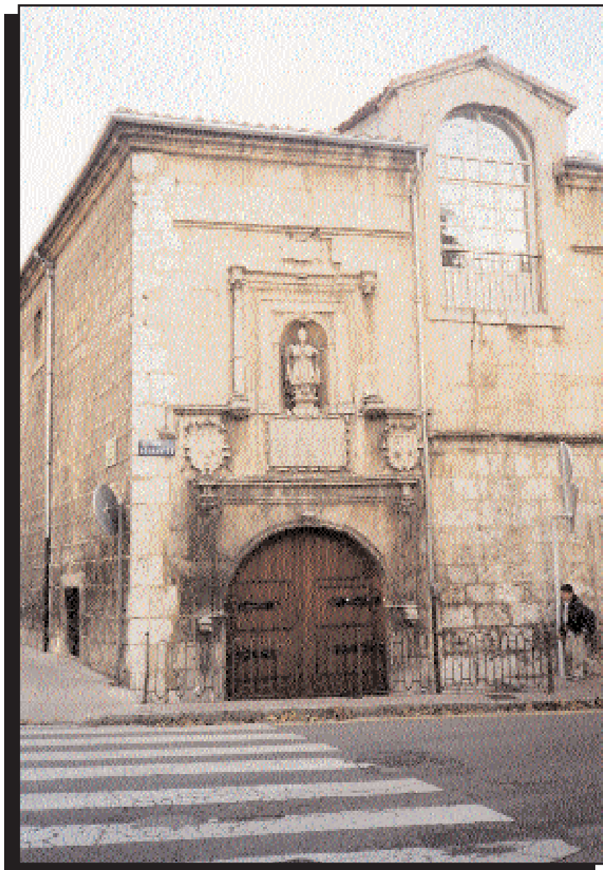
Fig. 1. Hospital de Barrantes. Fundado en 1645