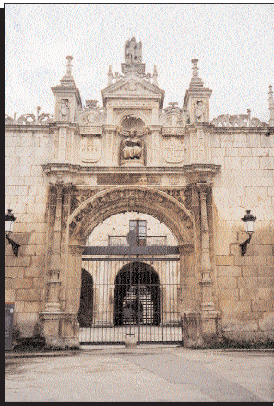
Fig. 1. Hospital del Rey. Fundado en 1187