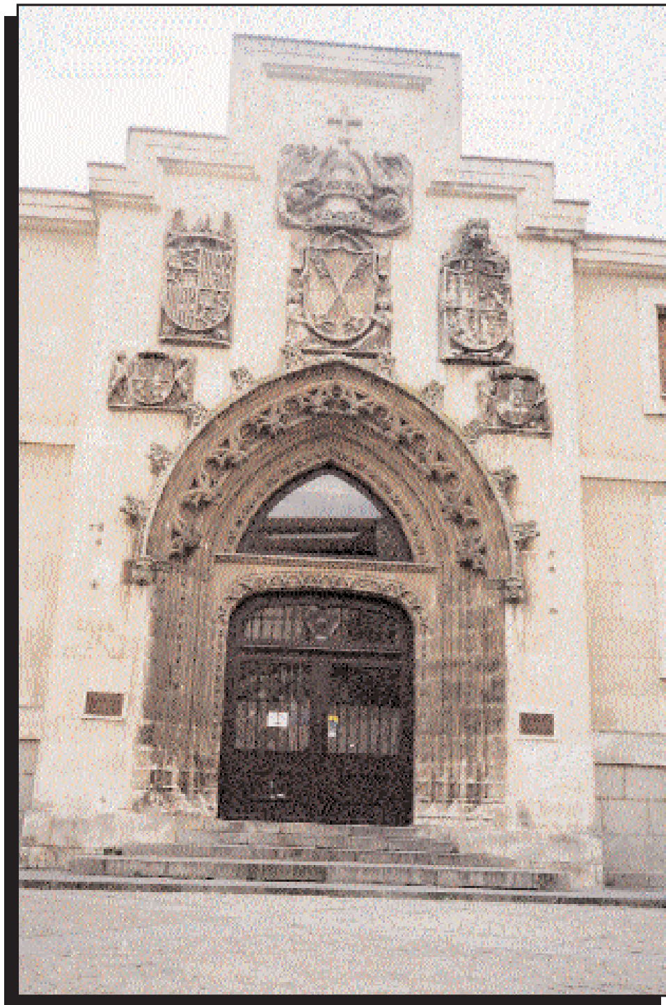
Fig. 2. Hospital de San Juan. Fundado en 1479