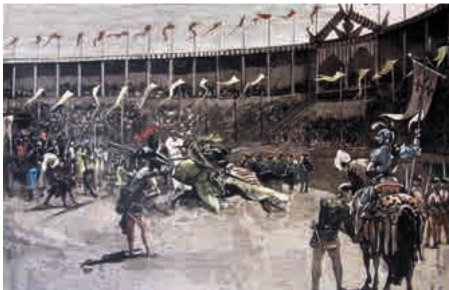
Muirhead Bone: "Feast of Apostle. The Knights of Santiago, accompanying the relics in procession"; ilustración del libro de Gertrude Bone Days in Old Spain (London, 1938)