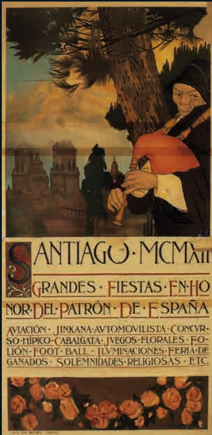
Cartel das Festas do Apóstolo Alfonso D. Rodríguez Castelao. 1912 Cartel Museo Carlos Maside. O Castro- Sada