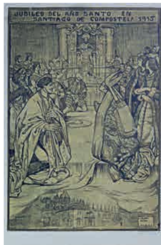
Jubileo del Año Santo en Santiago Fototipia Thomas, según la pintura de Roberto González del Blanco. 1915 Postal Colección particular de Fuco Sanjiao Otero