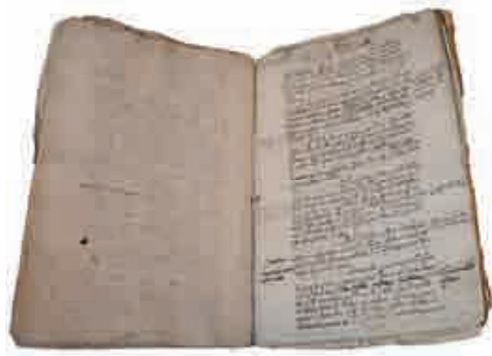
Ofertas de S.M. el Año de Jubileo. Libro de Ceremonias de la Catedral

Queda por mencionar a existencia de fundacións de culto ó Apóstolo noutras datas, cuxo obxectivo era procurar o aumento do culto xacobeo 97 . Un caso exemplar é o testamento do cóengo cardeal Fernando Yáñez de Vaamonde de 23 de xuño de 1645, no que se funda a celebración dunha procesión e misa dedicadas a Santiago “en honor de su único patronato” cada 30 de outubro, froito, cómpre supoñer, das inquietudes xurdidas polos intentos de diversos copadroados, particularmente, dadas as datas, o do Arcanxo San Miguel (1643-1644) 98 .