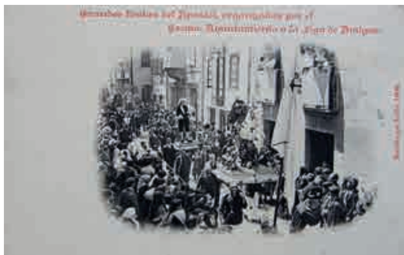
La Procesión del Patronato de julio de 1908: “ Grandes Fiestas del Apóstol, organizadas por el Excm. Ayuntamiento y la Liga de Amigos ”.

Esta ofertta la haze el regidor más antiguo desta çiudad que es el que haze los cobrados para alcaldes. Se le recibe como al señor oidor. Su asiento es en el choro del señor arzobispo, con solo el paño de terciopelo carmesí sin almoadas, con que se cubre el reclinatorio ut supra. Asistenle dos señores canónigos de los más modernos.