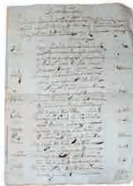
Cuenta del castillo “Venida de Almazor a Santiago”

Século XVIII Tinta sobre papel Arquivo da Catedral de Santiago