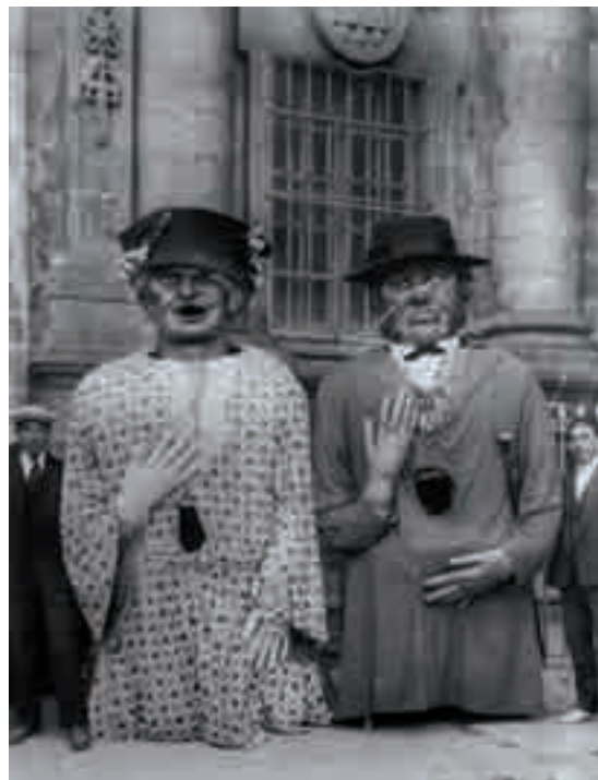
Os Cocos na Praza da Quintana

Fotografía en branco e negro Centro Galego das Artes da Imaxe. A Coruña