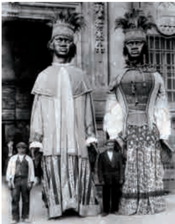
Os Indios na Praza da Quintana