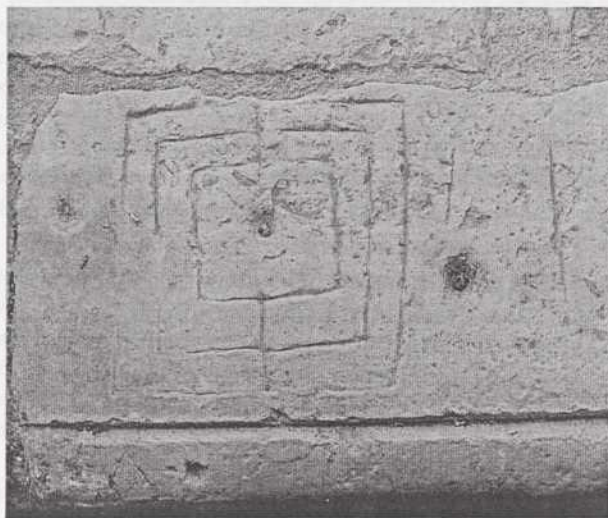
Alquerque del 9 en Beleña

Los tableros de juego más representados son los denominados alquerque de nueve (conocido como molinillo en Alemania y Francia, y nine men's morris en Gran Bretaña), el alquerque de doce (que es el antecesor del juego de damas) y las tres en raya.