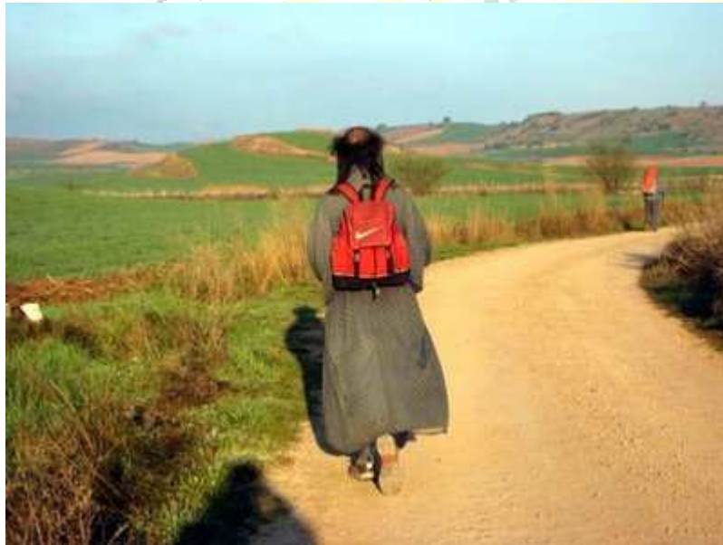
...lo que quita frío, quita