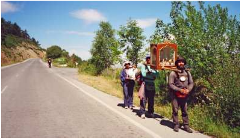
Peregrinos de Chiapas portando la urna y posteriormente otro con el Niño