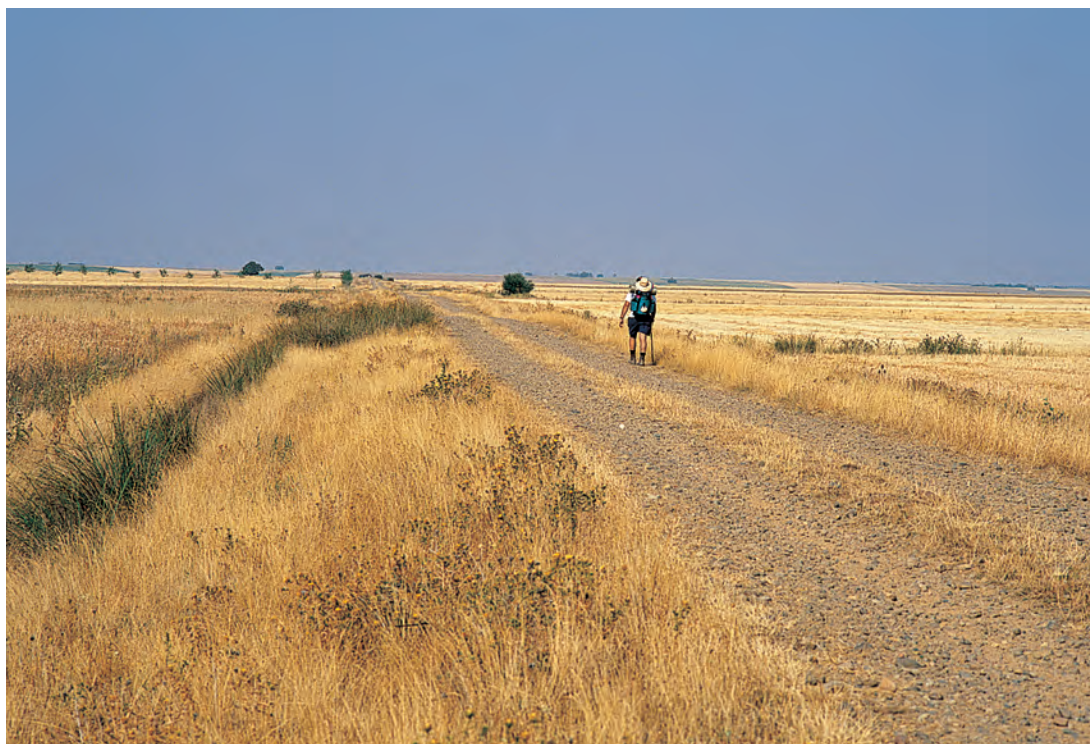
Por el Camino de Santiago, próximo a Calzadilla de la Cueva