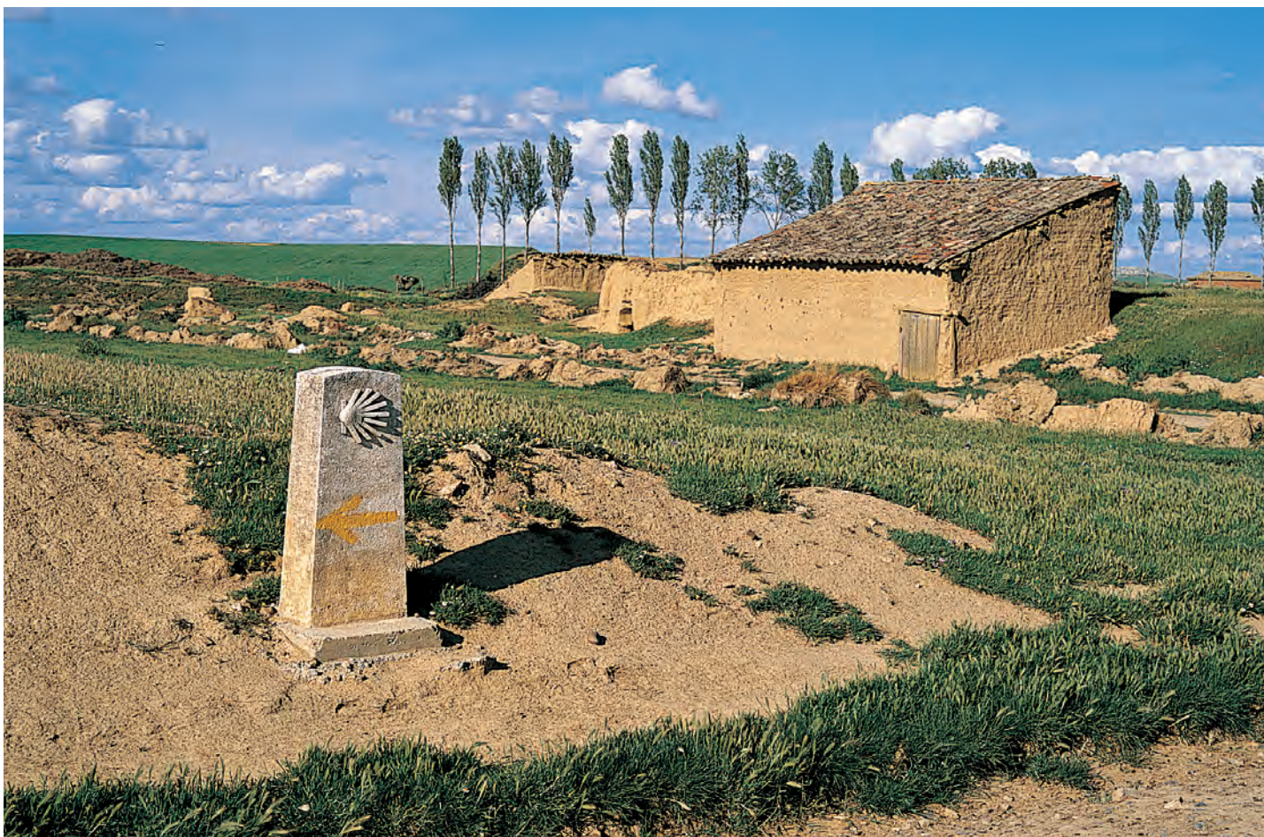
Camino de Santiago, Boadilla del Camino

dulces y buenos para beber, se llaman vulgarmente con estos nombres: el Pisuerga, río que baja por Itero del Castillo; el Carrión, que pasa por Carrión; ... 67 . En general, el autor francés de la guía del Codex Calixtinus nos proporciona una impresión buena de la región palentina, aunque menos de la gente que allí habita: "... continúa la tierra de los españoles, a saber: Castilla y Campos. Esta tierra está llena de tesoros, abunda en oro y plata, telas y fortísimos caballos, y es fértil en pan, vino, carne, pescado, leche y miel. Sin embargo, carece de árboles y está llena de hombres malos y viciosos" 68 . Lo que bien observa el autor del Codex Calixtinus es la falta de árboles en los famosos Campis Gotis de la Chronica Albendensia 69 ; pero la abundancia de oro y plata, si no es una frase retórica, habrá que suponer se refiere a los monasterios e iglesias y a las casas de nobles y ricos. Con todo, los hombres no salen tampoco bien librados. Ya el historiógrafo Pompeius Trogus de la Gallia narbonense, que vivía en los tiempos del emperador Augustus, describe la llanura austera y la consecuente sobriedad castellana en sus Historiae Philippicae , expresando que es dura omnibus descripta parsimonia 70 .