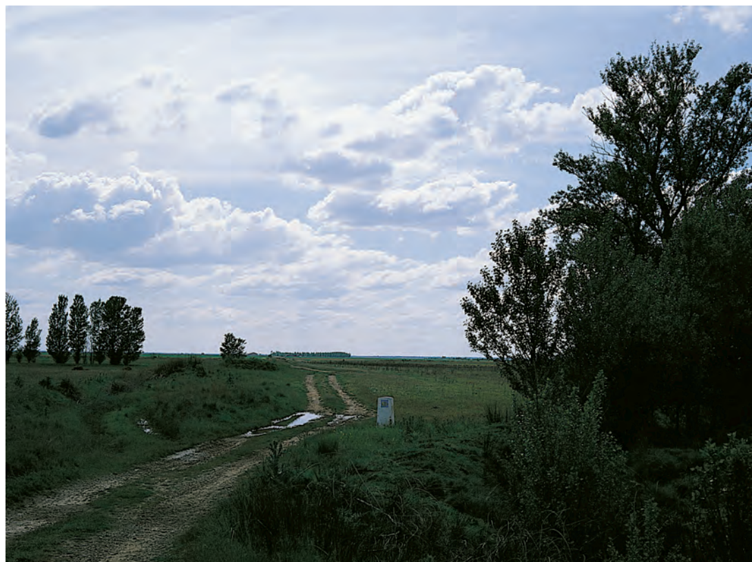
Camino de Santiago, Carrión de los Condes

La radicalidad de esta postura aparece al hablar de las condiciones de los seguidores de Jesucristo, pudiéndose leer en otro pasaje de san Mateo: Et dicit ei Jesus: Vulpes foveas habent, et volucres caeli nidos, Filius autem hominis non habet ubi caput reclinet 15 . Los monjes itinerantes de Irlanda y Escocia vivían según este ideal: habían aprendido de los primeros monjes del Oriente la condición de apátrida. En la Alta Edad Media todavía el sentido de la peregrinatio no significaba sólo un camino o una determinada meta geográfica, sino una actitud concreta y religiosa. Fue sobre todo el exemplum Abrahae 16 el que sirvió de modelo para los monjes itinerantes.