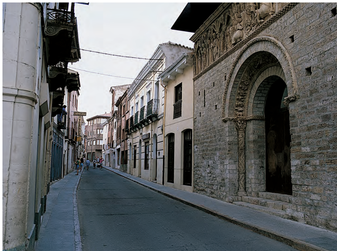
El Camino de Santiago a su paso por Carrión de los Condes

Durante el largo reino de Alfonso III (866-910) y el pontificado de Sisnando cristalizaron los elementos fundamentales de la espiritualidad 28 y la devoción popular para el desarrollo del culto jacobeo. En principio este culto de la tumba apostólica como centro se extendió con relativa rapidez en Galicia y en el resto del reino de Asturias, pero tardó bastante tiempo aún hasta que se afianzó en la parte cristiana de la península Ibérica, como lo demuestra la incorporación un tanto tardía de la fiesta del Apóstol en los calendarios y libros litúrgicos toledanos 29 . No obstante el camino estaba abierto empezando con la red de comunicaciones en los alrededores de la villa beati Jacobi misma 30 y conectándose poco a poco con la red de vías, ya existentes en su mayoría, debido a la circunstancias y hechos político-religiosos de orientación oriental en el norte de la península Ibérica.