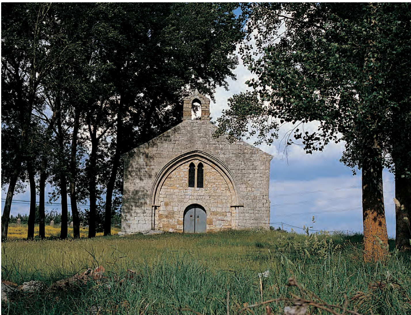
Ermita de San Miguel, Población de Campos