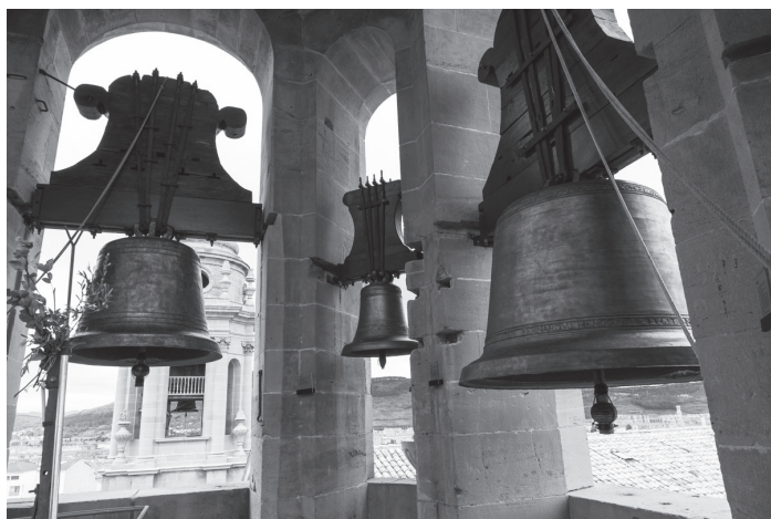
Campanas de la Catedral de Pamplona en plena acción.