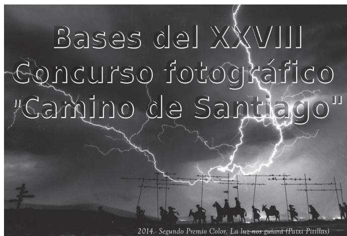
Las bases se pueden descargar en nuestra web www.caminodesantiago Navarra.es