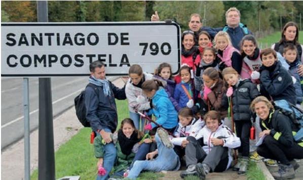
Comenzando el Camino en Roncesvalles año 2013.

Hace cinco años, en noviembre de 2013, nueve matrimonios amigos emprendimos desde Roncesvalles lo que para nosotros era un reto que denominamos "Camino de Santiago en Familia", con el objetivo hoy cumplido de llegar a Santiago de Compostela, a la tumba del Apóstol.