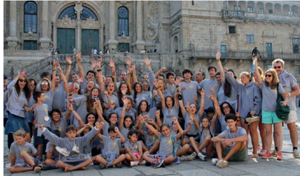
Fin del Camino Santiago de Compostelano año 2018.

Esperábamos con muchísima ilusión que llegaran los puentes del 1 de mayo y el de Todos los Santos, para coger la mochila y hacer nuevas etapas con nuestro grupo, el del "Camino de Santiago en Familia", al que, a partir de la última etapa, empezamos a llamar la "Familia del Camino de Santiago".