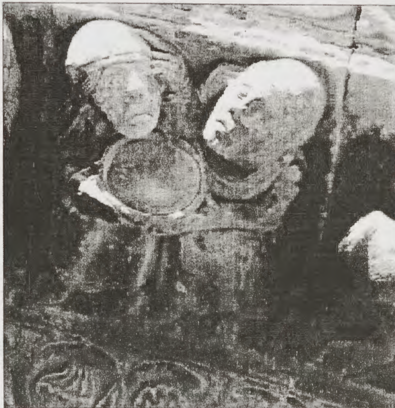
Disputatio entre dos eruditos

trata de una discusión de proposiciones en que los interlocutores mantienen opiniones diferentes, de las que son frecuentes en los actos académicos. Aquí ambos parecen estar preocupados por algo de muy difícil solución, y aparentan estar de acuerdo en este punto. Parece que la idea del artista fue representar un problema arduo. ¿De