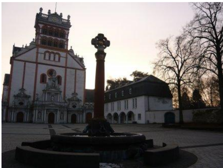
Abadía St. Matthias

A continuación tenemos tiempo libre, que aprovechamos para ver la Porta Nigra, la casa de Kart Marx y dar una vuelta por la ciudad. Después asistimos a las Vísperas en la Iglesia de St. Irminen.