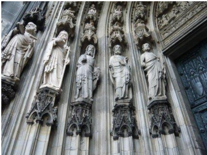
Detalle del Pórtico de la Catedral de Colonia. Imagen del Apóstol Santiago

Desde el siglo IV hay obispado en Colonia y desde el siglo X se desarrolla en la ciudad un centro de culto a las reliquias. Se convierte en destino de peregrinos y lugar de paso de camino a Aquisgrán, Roma y Santiago de Compostela. Tiene cuatro iglesias con reliquias del Apóstol y además una iglesia y dos capillas dedicadas a él. En seis altares Santiago se hallaba como principal patrono, en otros diez como patrono secundario. Existían tres congregaciones de Santiago y un hospital convento también llevaba su nombre. Asimismo en al menos 18 iglesias de la ciudad se podían apreciar representaciones gráficas sobre Santiago. Desde el año 1999 la Asociación Landschaftsverband Rheinland junto a la Sociedad Alemana del Apóstol Santiago comienzan a explorar, marcar y publicitar los caminos de peregrinaje a Santiago para que las gentes se concienciaran de su existencia como importantes calles de cultura. En el centro de la ciudad de Colonia hay cuatro estelas colocadas por dicha Asociación.