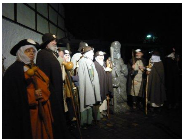
Peregrinos en Langerwehe