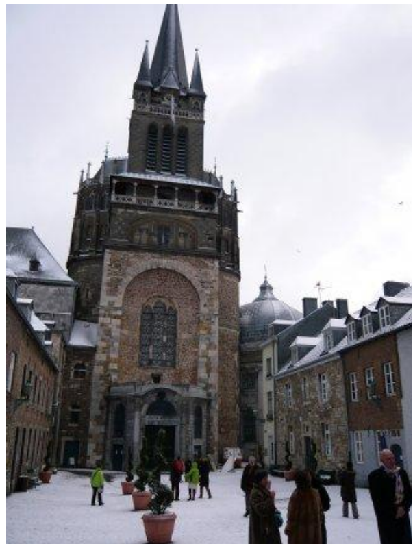
Capilla Palatina de Aquisgrán

Se trata de una construcción poligonal de dos plantas y con una armonía perfectamente estudiada en función de las matemáticas, la geometría, el significado de los números y la divinidad. La construcción duró desde el año 790 hasta el 805. Al primitivo polígono se le añadió, en los siglos del gótico, un espacio a modo de gran capilla en el que se guardan dos cofres que contienen: uno, las reliquias de la ciudad que son: el vestido de la Virgen, los pañales del Niño Jesús, el Paño de pureza de Jesús, el paño en el que se envolvió la cabeza de San Juan Bautista y los restos del emperador Carlomagno.