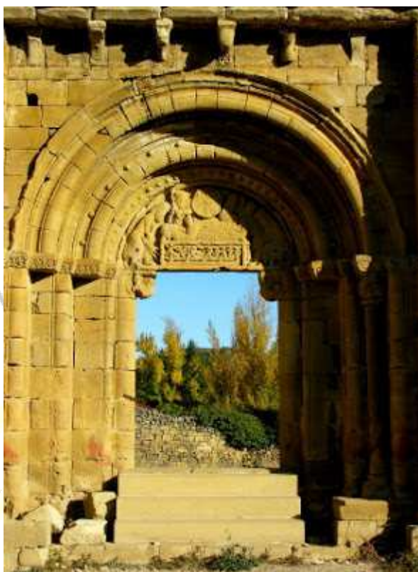
Templo de San Lorenzo, ruínas s.XII, Uncastillo (Zaragoza).

Nos parece que para dar el primer paso, tras tirar los dados, nada mejor que traspasar la puerta de estas ruínas. Su imagen resume lo que hemos intentado insinuar, el espejismo que a veces despista nuestro caminar por el laberinto. Detrás de la portada, que custodian los antiguos genios guardianes, puede que no haya solo un edificio de culto, sino también todo un mundo ancestral en espera de ser explorado. El mundo de quienes veneraban a la Madre Tierra.