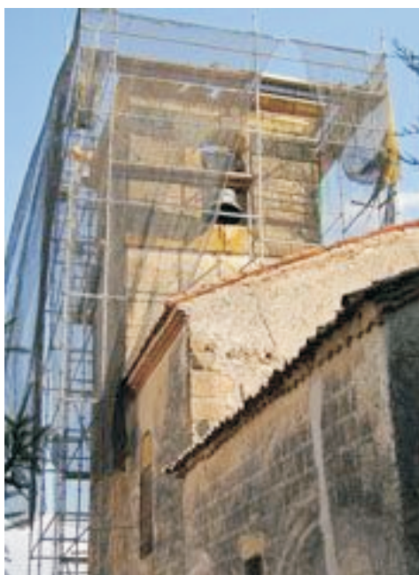
Iglesia parroquial de Los Huertos

E L pasado mes de septiembre comenzaron los trabajos de restauración de la iglesia parroquial de la Inmaculada Concepción, de Los Huertos (Segovia), principalmente de su torre campanario, donde se ha comenzado renovando toda la vigería antigua de madera de su cubierta y asegurando los diferentes elementos estructurales. La iglesia se sitúa en uno de los puntos más altos de la localidad. Se trata de un templo del siglo XVI, reformado posteriormente en el siglo XVIII, motivo por el que atesora detalles góticos y barrocos. En su interior destaca la imagen de la patrona del siglo XVIII y el retablo Mayor de 1606