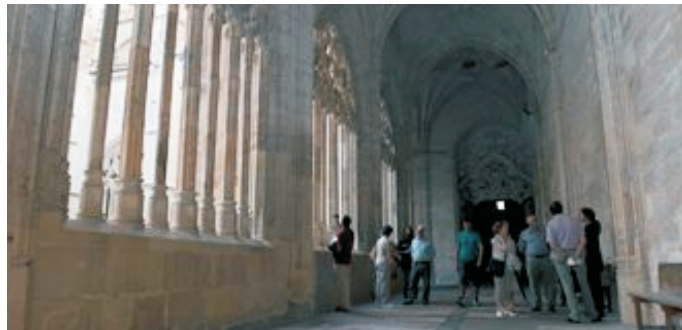
Claustro catedral de Segovia

Geroteo y la puerta del cuerpo de la Librería. Y por indicación de la Junta, se llevó a cabo una excavación arqueológica en la zona del talud.