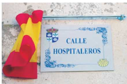
El Burgo Ranero

También ha sido excepcional la campaña 2011 de 'hospitaleros voluntarios' de Madrid, pues de nuestra ciudad y comunidad ha habido un importante grupo de 106 hospitaleros que han desarrollado su labor altruista en 26 albergues. Así, en el Camino de Santiago se ha trabajado en Arrés, Estella, Villamayor de Monjardín, Viana, Logroño, Nájera, Santo Domingo de la Calzada, Grañón, Tosantos, Tardajos, Castrojeriz, Villarcázar de Sirga, Sahagún, Calzadilla de los Hermanillos, Bercianos del Real Camino, León, Foncebadón, El Acebo, Ponferrada, y Samos; en la Vía de la Plata: Alcuescar, Salamanca, y Zamora; y en el Camino del Norte: Markina, Lezama, y Pobeña. De este grupo de hospitaleros, 15 han ejercido la hospitalidad en 2 ó más albergues.