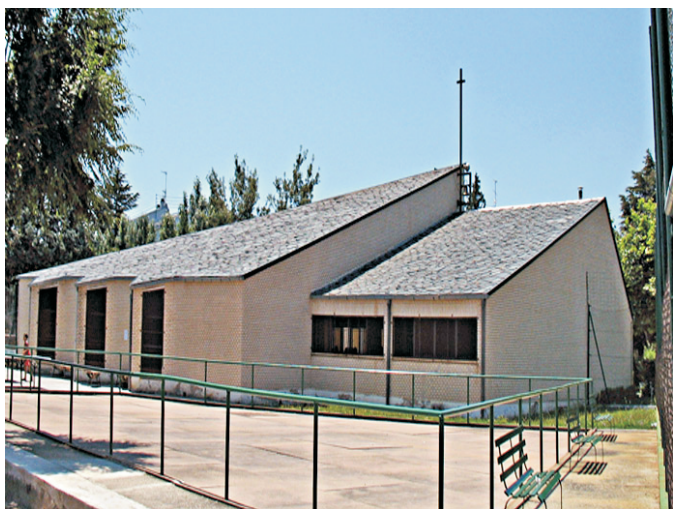
Arcángel de los siglos XVIII-XIX.

La historia anterior a la reconquista cristiana de toda la zona (1085, cuando cae Toledo) es poco conocida; repoblada por los segovianos hacia 1268, el primer núcleo habitado estaría en torno a la antigua iglesia parroquial de San Miguel Arcángel, el actual centro cultural “La Torre”. La resolución de los litigios, entre los concejos de Segovia y Madrid, por la posesión de los territorios a este lado de la Sierra se inclinaron, en un principio, a favor de los madrileños, si bien ya en tiempos de Alfonso X se integraría en el término del Real de Manzanares, pasando, en 1383, a dominios de los Mendoza y posterior casa ducal del Infantado. Fernando el Católico, en 1504, les otorgará el título de villa con jurisdicción propia. A finales del siglo XVI llegó a contar con casi 300 vecinos que se reducirían a 130 a mediados del siglo XVIII, y eso que desde 1740 atravesaba la localidad el Camino Real pavimentado que comunicaba la Corte con el noroeste peninsular. Hacia mediados del siglo XIX tenía 455 habitantes y a finales del mismo siglo su población pasaba de los 1.400. En la actualidad es una localidad con varias urbanizaciones de las llamadas “segunda residencia”. Quizás su monumento más representativo sea la actual parroquia de San Miguel