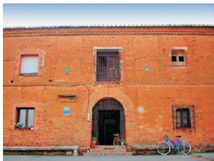
Albergue de Bercianos del Real Camino