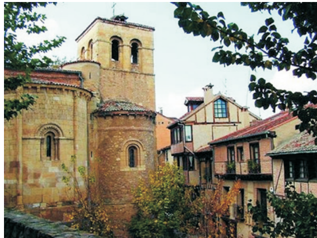
Iglesia de San Nicolás, Segovia

L A antigua iglesia románica de San Nicolás, del siglo XII, será el objeto de una intervención mínimamente agresiva, realizando tareas de mantenimiento, saneado, limpieza, consolidación y prevención de futuras patologías vinculadas a problemas de humedad o colonización vegetal o animal. El proyecto tiene de presupuesto 251.332 euros, de las cuales 188.499 € correrán a cargo de los fondos del 1% Cultural. El Ayuntamiento de Segovia sufragará el 25 por ciento restante, 62.833 €. Dentro de las obras de conservación y adecuación se efectuará el sellado de grietas en el muro de tapial de la torre y del ábside y se planteará una nueva distribución y sustitución de la red pluvial y un nuevo diseño de bajantes y del sistema de recogida de aguas. También contempla retejar el ábside en las fachadas y la sustitución de los revocos de cemento por otros de cal en los paramentos verticales y, por último, la iluminación de los jardines lindantes.