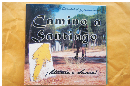
Camino a Santiago. Valladolid y provincia.

El sábado 29 de octubre se clausuraba la campaña anual de nuestros hospitaleros voluntarios en el albergue de Tardajos, que comenzó el domingo 20 de marzo. En estos siete meses y medio han sido 2.677 los peregrinos que han sido acogidos en el albergue gracias a la labor generosa de un equipo de 32 hospitaleros. La cifra de peregrinos ha sido ligeramente superior a la del pasado año 2010, que pernoctaron 2.561. Aunque en estos meses de otoño e invierno el albergue carezca de hospitalero, seguirá cumpliendo su función dado que un vecino se queda con las llaves para disposición de los peregrinos. La campaña 2012 está programada iniciarla el próximo 19 de marzo. Y una felicitación para todos los hospitaleros voluntarios, pues el 17 de octubre se dedicaba en El Burgo Ranero y en Calzadilla de los Hermanillos, respectivamente, las primeras calles dedicadas a la labor de los "Hospitaleros".