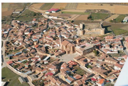
Vista aérea de Grajal de Campos

Desde la pasada primavera la Asociación de Segovia ha estado realizando por etapas el Camino de Madrid desde su capital segoviana. La última etapa se desarrolló el pasado 17 de septiembre con la llegada a Sahagún de Campos desde Santervás, donde fueron agasajados por su ayuntamiento antes de la partida. Por su parte la Asociación de Ávila también ha realizado diferentes etapas del Camino de Madrid, finalizando éste el pasado 13 de noviembre con la etapa de Villalón a Sahagún, de la cual nos comunican que encontraron una serie de flechas equívocas (¡que alguien les comentó que recientemente había marcado el Ejército para unas maniobras!).