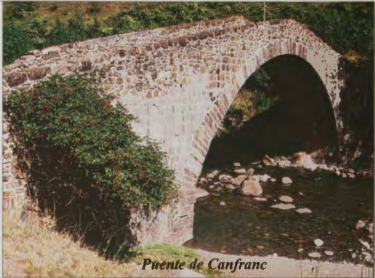
Puente de Canfranc