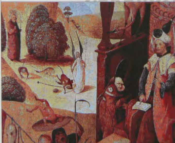
Santiago se acerca al Mago Hermógenes precedido por un ángel. (El Bosco)

El mago, temblando de ira, invocó entonces a los demonios para que fueran a apresar a su antiguo discípulo y al nuevo maestro de éste, pero cuando iban a cumplir con la orden encomendada, se les apareció el Ángel del Señor que, atándolos con cadenas de hierro, los atormentó sin medida. A cambio de liberarlos de sus sufrimientos, los demonios se pasaron al bando de Santiago, apresando a su vez a Hermógenes y llevándolo a presencia del apóstol.