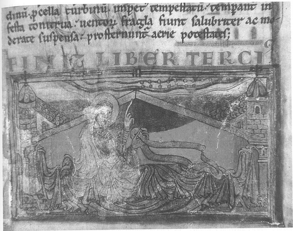
Lám. 2. El Sueño de Carlomagno. Códice Calixtino. Archivo de la Catedral de Santiago de Compostela.

ciubdat de Sanctiago, et fué al Padron otrosi en romeria porque en aquel lugar aportó el cuerpo de Sanctiago 13 .