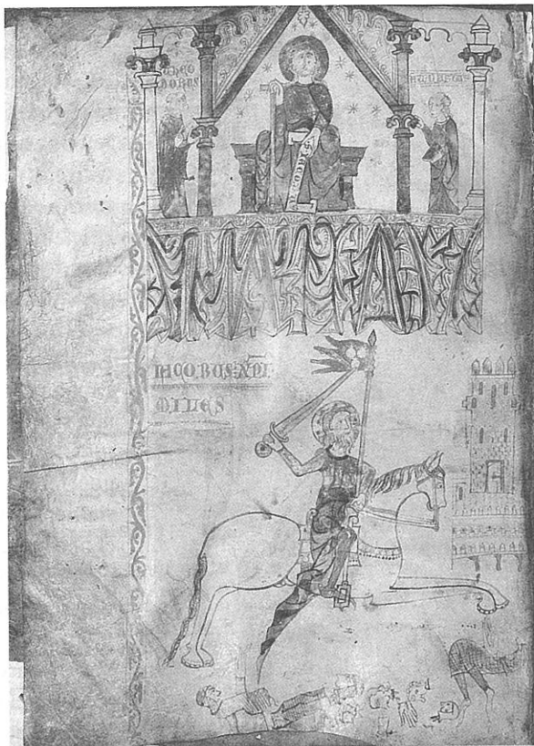
Lám. 3. Santiago coronado y ecuestre. Tumbo B. Archivo de la Catedral de Santiago de Compostela.

virtiendo, de este modo, el orden otorgado a la figuración en el Pórtico. Cuatro cuestiones a subrayar: en primer lugar una arquitectura, de formato más distinguido, diferencia su espacio del que, a sus lados, ocupan sus discípulos –a la derecha, THEODORUS; a la izquierda, ATANASIUS–; en segundo término, en el manto que cubre en parte al Apóstol se muestran tres conchas alusivas a la peregrinación; por otra parte el hecho de que, tras la figura de Santiago, se representen, como fondo, nueve estrellas alude a la ubicación del personaje en los cielos y, por lo tanto, glorificado; por último esta representación del Apóstol se dispone en la parte alta de un folio en el que, abajo, se nos presenta al mismo personaje en disposición ecuestre, cuestión que lleva, implícitamente, a subrayar esa sentido de glorificación que, en una ocasión como ésta, se corresponde con una ubicación en