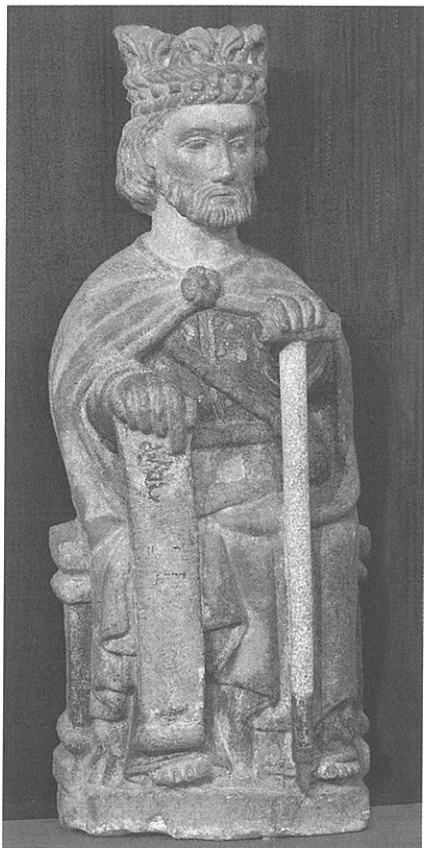
Lam. 4. Santiago sedente y coronado. Museo de la Catedral de Santiago de Compostela.

una corona sobre su cabeza, a relacionar con su martirio y con el ritual de la “coronatio” que se hacía sobre el Santiago sedente del altar mayor. Nos remite, es verdad, lejanamente, a la figura, igualmente sedente, del Apóstol que preside el Pórtico de la Gloria pero responde a un estilo propio. El desconocimiento del lugar primero que ocupó esta imagen dificulta su valoración estilística y cronológica. Jacomet le encuadra en el siglo XV, superando una generalizada tendencia a reconocerla como propia del siglo XIII; valora, entre otras cuestiones, los rasgos de su rostro 23 . Se puede decir que, en cierto sentido, participa de un semejante arcaísmo al que puede verse en la actual portada del Colegio de San Jerónimo, con figuras, en el tímpano, que llevan coronas semejantes a la aquí existente; en tales supuestos anacronismos ha de reconocerse, más bien, la existencia de una mirada admirativa hacia el Pórtico de la Gloria como exponente de la relevancia de una época áurea