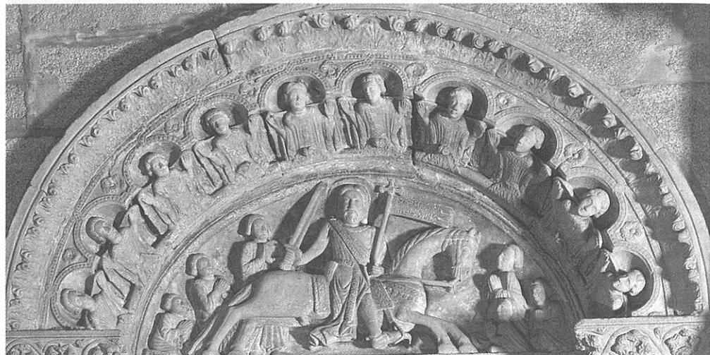
Lám. 5. "Tímpano de Clavijo". Catedral de Santiago de Compostela.

von Harff 32 . En cualquier caso, la corona, como prueba de martirio, se asocia en la propia iconografía jacobea al Apóstol.