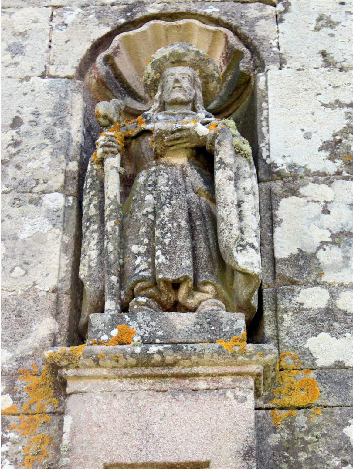
Santiago na fachada da igrexa de Taberós