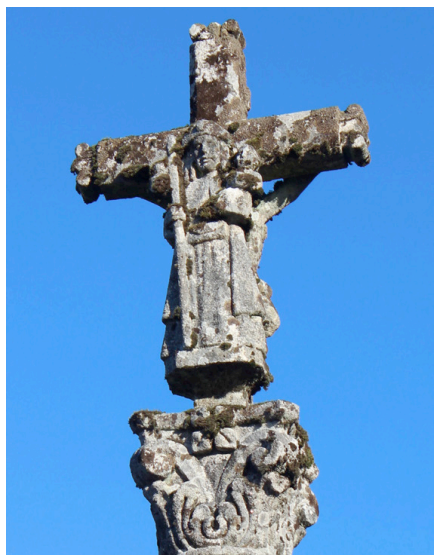
6.- Virxe Peregrina. Soutelo de Montes

No camiño que pasa por Soutelo de Montes atopamos un cruceiro, feito en 1964, que fai referencia á devoción do apóstolo Santiago. “ Junto a la iglesia parroquial hay un crucero, hecho de granito en Pontevedra, que se levanta encima de una plataforma sobre un pedestal. De fuste octogonal, tiene un capitel corintio con unas estilizadas hojas de acanto. Lleva en la cruz superior las imágenes de Cristo crucificado y la Virgen Peregrina, ya que tiene en una mano al niño Jesús y en la otra una vara con calabaza y en la cabeza el sombrero típico de peregrino con una doblez central y la concha de vieira. Además en su fuste tiene adosada la imagen de Santiago Apóstol sedente, semejante a la del Pórtico de la gloria de la catedral de Santiago. ” 15 Falando das festas que se celebran en Soutelo dinos o mesmo autor que unha é a de San Roque, pois tiña unha ermida neste lugar desde a época medieval.