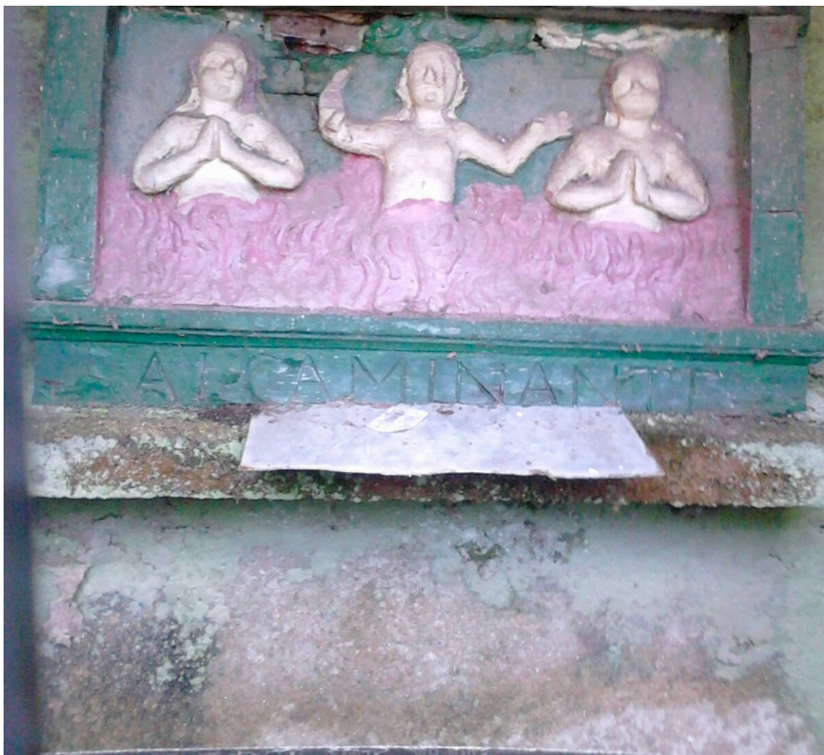
Peto de Ánimas

Deixando a Consolación, á saída do pobo érguese unha ermida construída no ano de 1680 en advocación a Nai de Deus. Levántase esta ermida co gallo de atopar os veciños unha imaxe da Virxe, posiblemente esquecida por peregrinos. Nesta ermida temos unha talla de Santiago mata-mouros cos atributos de peregrino habituais e suxeitando coa man esquerda unha bandeira branca coa cruz de Santiago. Ao seu carón a imaxe de San Roque con sombreiro de ala ancha, pero que leva dúas chaves de ouro postas en aspa (pois el peregrinou á cidade de san Pedro) en vez da cuncha de vieira.