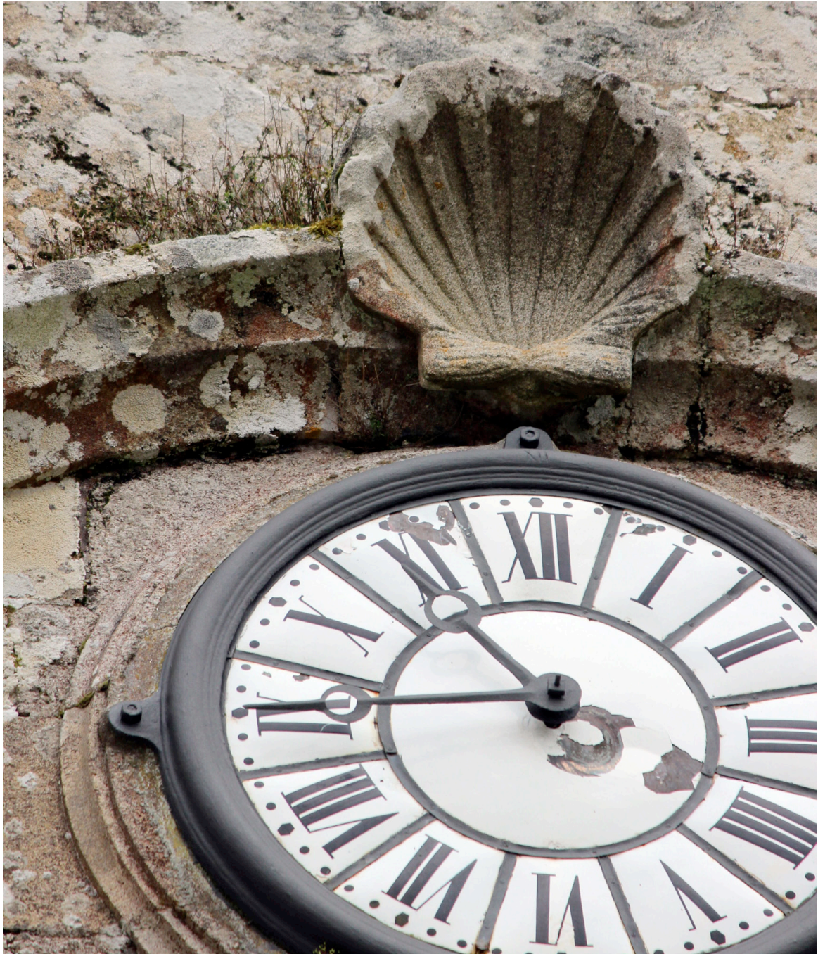
Venera na igrexa de Codeseda

Tabeirós, unha das 51 parroquias que conforman o Concello da Estrada, é a única que ten por patrón ao Apóstolo Santiago. Entrando nesta parroquia polo camiño da Consolación, atópase a man dereita un peto de ánimas, que no seu interior ten gravado o letreiro “ AL CAMINANTE ”.