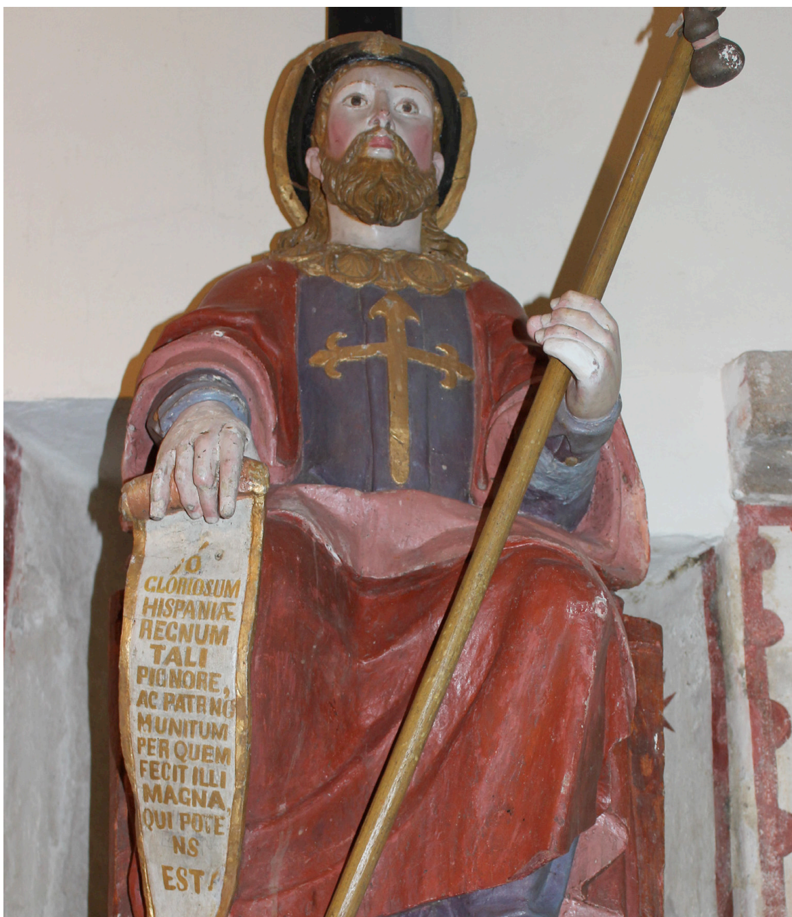
Santiago no altar maior de Tabeirós

E dentro desta igrexa preside o altar maior unha imaxe sedente de Santiago apóstolo vestido de peregrino destacando no peito unha espada flordelisada de ouro e una cartela na man dereita. Na mesma igrexa hai un vidreira coa cruz de Santiago, así como outra en ferro na tribuna, mentres que a cada lado do sagrario hai unha venera de ouro.