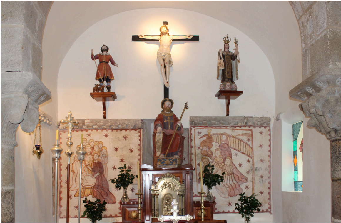
Igrexa da parroquia de Santiago de Tabeirós

se dirigía á Cuntis por aqueles lugares, y atravesaba la calzada empedrada (via strata) de la actual Estrada, quiera por emulación denominarse con este último vocablo.[...]