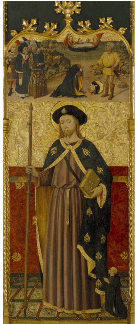
Autor: Taller de Antelani Título: Traslación del cuerpo de Santiago a Galicia Fecha: primera mitad del siglo XIII Procedencia: Capilla de Santiago. Seu Vella. (Lleida)