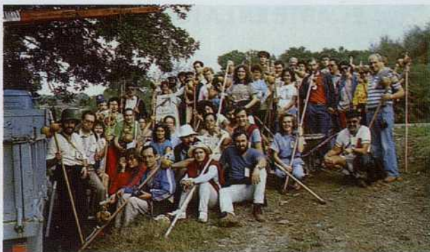
Los participantes en la Semana fueron testigos de la colocación del Hito de Castromaior

do, Presidente de la Excm. Diputación de andiendo a la colocación de los Hitos nino francés