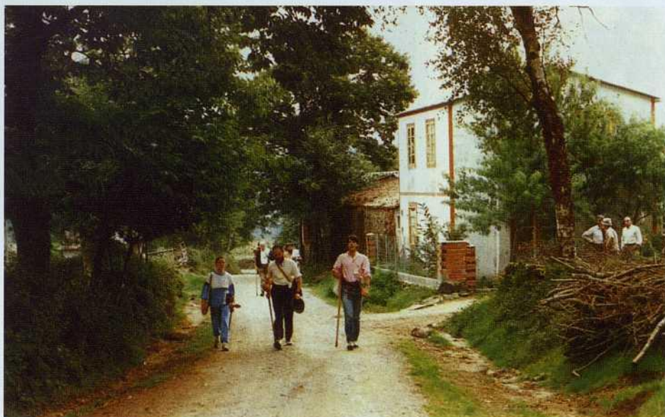
Al borde del magnífico Camino Real, las gentes del lugar contemplan, con comprensivo respeto, el paso de los participantes en la "Semana".

Triacastela, Samos, Sarria, Portomarín y Palas de Rei fueron los finales de las etapas en que se dividió este recorrido por