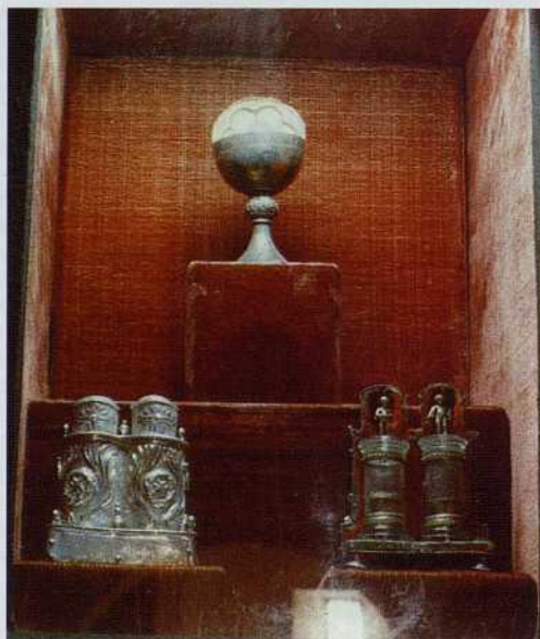
Caliz, patena, relicario y ampones del monasterio eucarístico de O Cebreiro

dejado centenares de obras en las tierras de Lugo. Un buen número de ellas se localizan, precisamente, a lo largo del "Camino de Santiago" o en sus inmediaciones. Entre otras construcciones pertenecientes a este estilo, y que tienen como denominador común una cronología que en ningún caso baja de la segunda mitad del siglo XII, y que en algún caso llega a frisar el 1200 e incluso a rebasarlo, cabe citar las iglesias de Santiago de Triacastela (el ábside solamente), Santiago de Renche (vestigios en la nave y en particular en el muro sur), San Martín del Real (humilde fábrica rural que ha llegado casi completa hasta nosotros), monasterio de Samos (puerta de la antigua construcción que se abre al claustro pequeño), San Esteban de Calvor (con restos en los muros laterales de su nave), Santa María de Ferreiros (interesante puerta principal que sigue el esquema surgido en la del norte de la catedral de Lugo), Santiago de Ligonde (arco triunfal y curioso relieve en el exterior del muro sur de la nave), San Tirso de Palas de Rey (puerta principal y algunos otros restos), San Julián del Camino (interesante y elegante ábside), San Pedro de Pambre