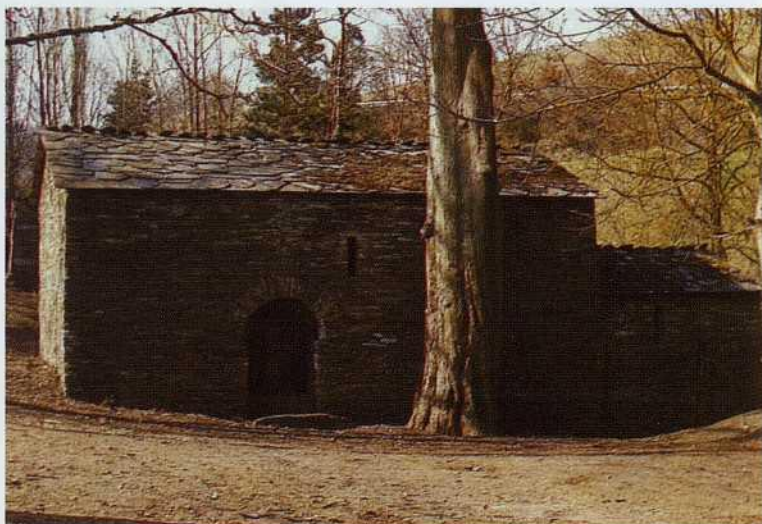
Capilla de San Salvador, o del Cipres, de Samos, Vista Sur.

Ya dentro del siglo XIII se construye el templo de Vilar de Donas, con planta de cruz latina y tres ábsides semicirculares en su cabecera, esquema planimétrico que sólo sería comparable, en Galicia, con el de San Miguel de Bremao (Pontedeume). En una de las puertas del crucero nos da la fecha de 1224, que se corresponde con los inicios de su construcción; esta data justifica que en la nave, y sobre todo en su portada principal el románico ceda su puesto al gótico. A este estilo pertenecen también las interesantes pinturas de su capilla mayor, fechadas en 1434 y adscritas al gótico internacional, que tan escasos restos nos ha dejado en Galicia. Contemporánea de estas pinturas es la bonita Anunciación que cobija uno de los altares-baldaquinos de S.