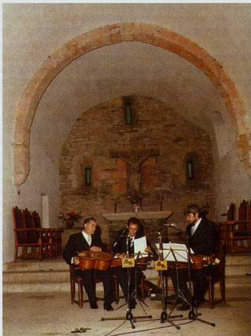
El grupo de Cámara de instrumentos medievales y populares de la Diputación de Lugo en el concierto ofrecido en Santa María la Real de O Cebreiro