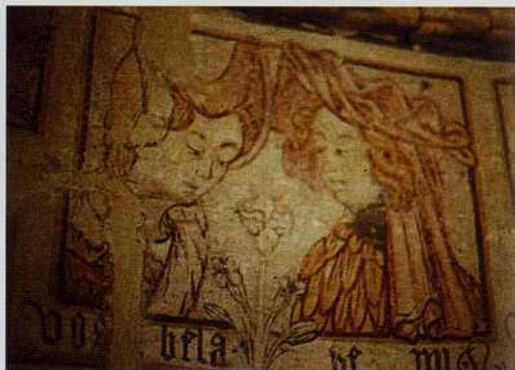
Detalle de las pinturas del ábside de la Iglesia de Villar de Donas

A la iglesia de Villar de Donas pertenece una hermosa cruz de plata, de estilo plateresco, más expresiva que las barrocas de Triacastela y de San Cristóbal. La alusión en ella al camino de Santiago y a la orden militar del mismo nombre es visible en una orla de conchas y en una espada (la cruz de Santiago). La espada se destaca de la plata por el dorado que admitió ya en la primera mitad del siglo XVI.