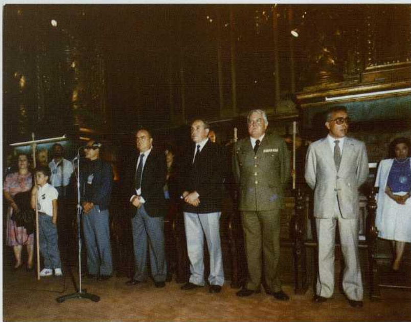
El Ilmo. Sr. Presidente de la Diputación de Lugo en compañía de las autoridades Provinciales asistentes al acto de clausura en el altar mayor de la catedral compostelana durante el acto de clausura de la "I Semana de Estudios Históricos"