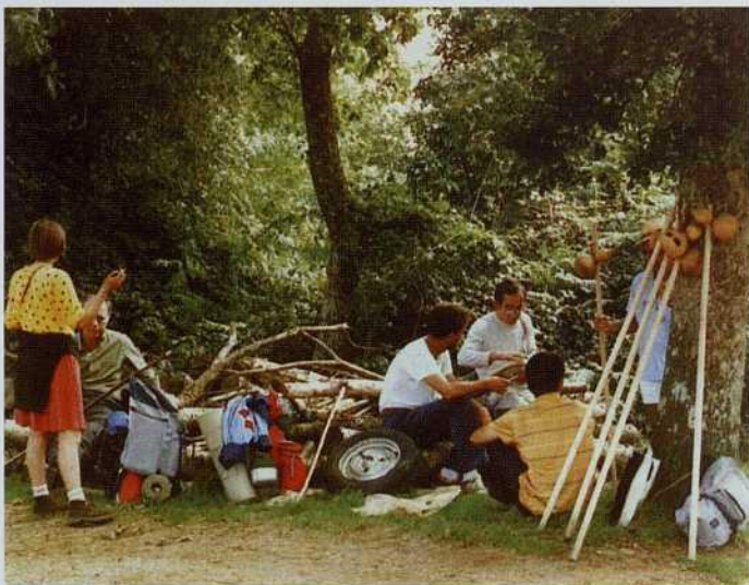
Participantes en la I Semana de Estudios Históricos elaborando las "conclusiones", a pié de camino, durante un breve descanso