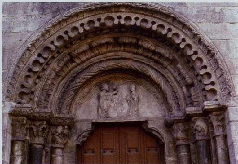
San Juan de Portomarín, arquivolta y timpano de la puerta Norte: Anunciación

La pujanza artística del barroco se deja sentir con diversas obras en un buen número de lugares e iglesias. Su valoración tiene que ser, necesariamente, variada, y en alguna de ellas se detecta el lejano recuerdo de directrices emanadas de los grandes artistas de nuestro barroco, recuérdese, por ejemplo, el bonito retablo de