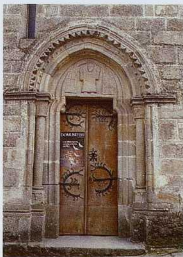
Puerta norte de la Iglesia de San Salvador de Sarria

Antes que en San Salvador de Sarria presidia Cristo,