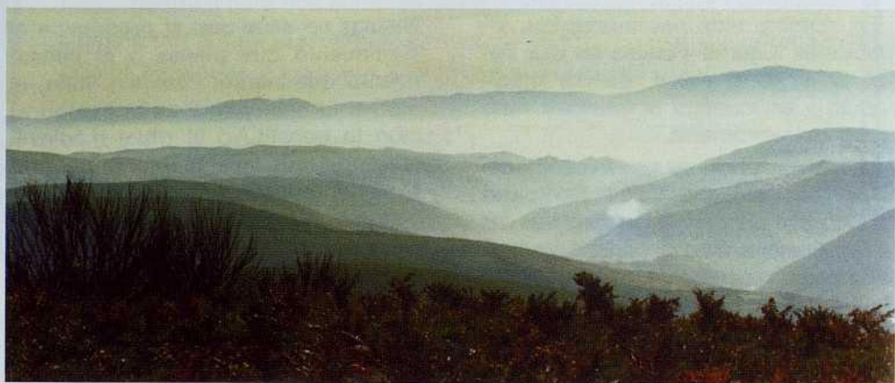
Desde el Monte Cebrero, el "Mons Februari" calixtino, el camino se pierde entre brumas buscando el descanso en Triacastela.