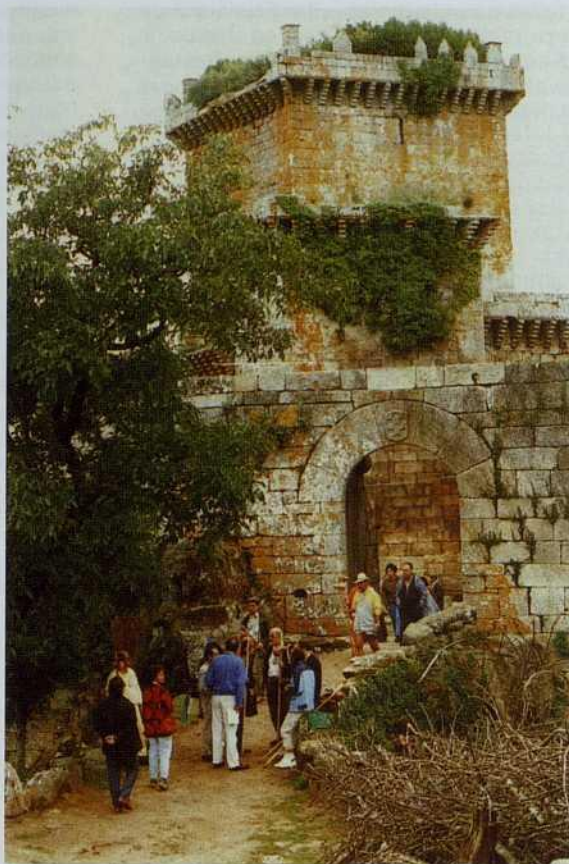
Los participantes en la "I Semana de Estudios Históricos" en el Castillo de Pambre

Curiosamente, los ayuntamientos de la ruta, autoridades y representaciones y el mismo pueblo, salieron al Camino a recibir a estos peregrinos, 51 en total y acompañantes hasta más de una ochentena de personas. Salvo rarísimas excepciones, todos los Alcaldes, miembros corporativos y hasta los mismos secretarios, párrocos, etc. fueron, al final de cada etapa, volcándose en recibimientos, saludos y parabienes que iban calando en los caminantes y tal vez, por el significado, en la propia organización, técnicos, etc. Si era brillante, alegre y animoso por tanto el caminar de estas gentes, estudiosos todos y religiosos algunos, más lo eran los finales de etapa que se hacían en Triacastela, Samos, Sarria, Portomarín y Palas, en los cuales se ofrecían verdaderas lecciones de un alto interés artístico y cultural a cuyo nivel tal vez nunca se había llegado en algunas de las plazas reseñadas. Omitimos nombres de gentes, grupos, técnicos que fueron formando los equipos de trabajo y organización, todavía están en la mente de todos. De ellos se habló en esa jornada de clausura, en Palas de Rei, momentos antes de partir para Compostela, otra gran gestión, cuyo éxito, se logró paralelamente con el caminar.