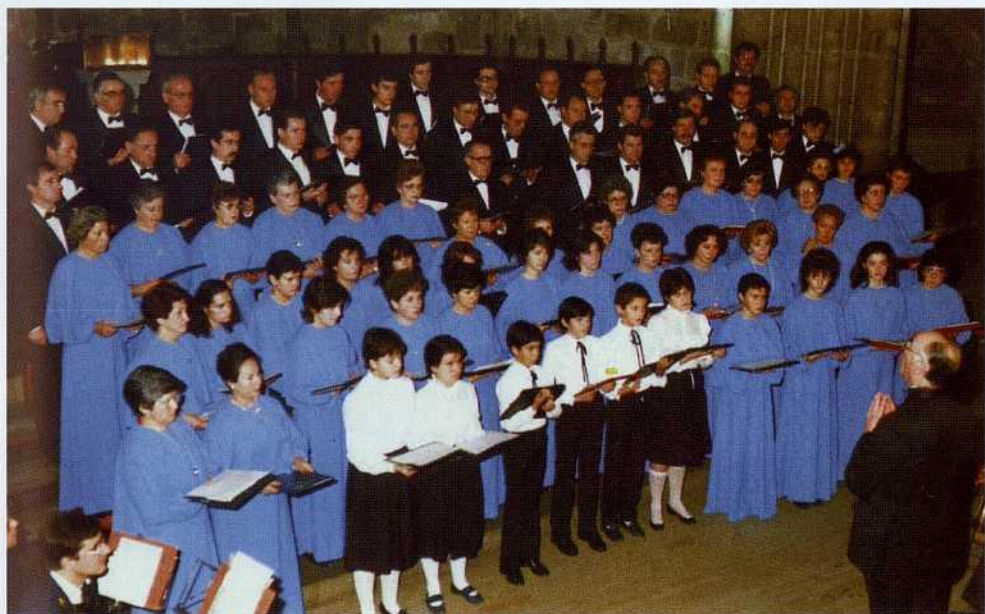
El Orfeón lucense durante el concierto ofrecido en la Real Abadía de Samos