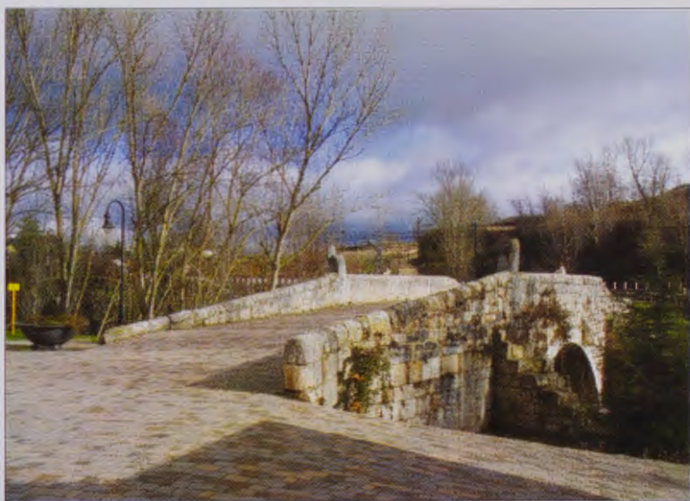
Entrada del Camino a Briviesca.