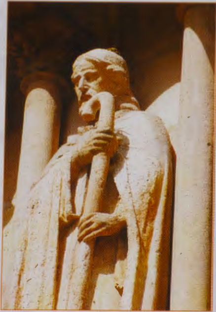
Detalle de SANTIAGO APÓSTOL. PUERTA DEL SARMENTAL.

una reja. Y esto lo diría con pleno conocimiento, pues su "Historia" la escribió tres años después del traslado.