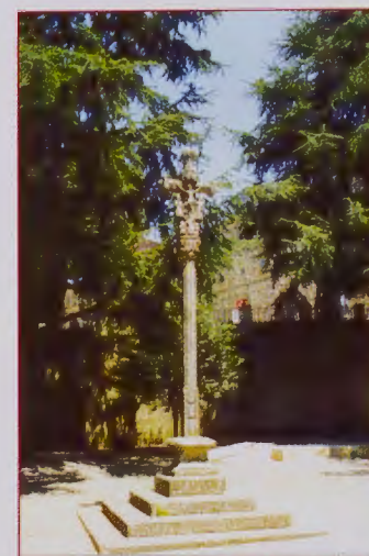
Crucero de Bonaval Santiago de Compostela