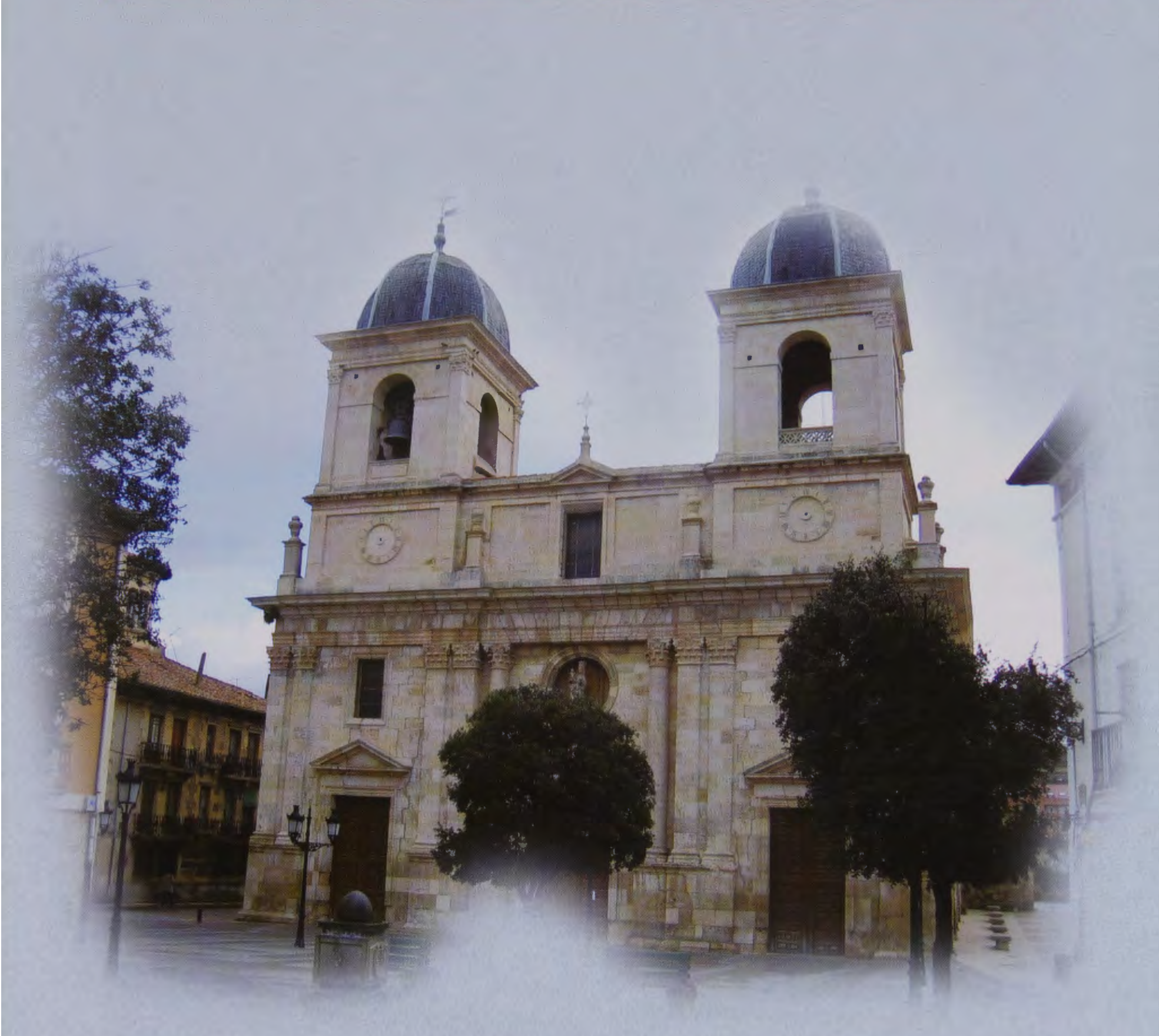
Ex-Colegiata de Santa María. BRIVIESCA. BURGOS