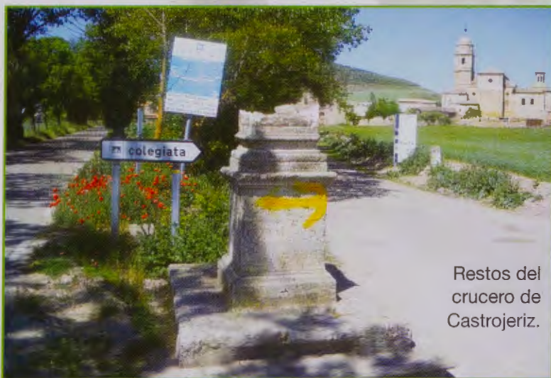
Restos del crucero de Castrojeriz.

Hace dos años unos desaprensivos destrozaron el crucero que daba la bienvenida a los peregrinos cuando llegaban a la villa castreña, dejando en pie, solamente, el muñón descarnado del pedestal. Pero dos años debe