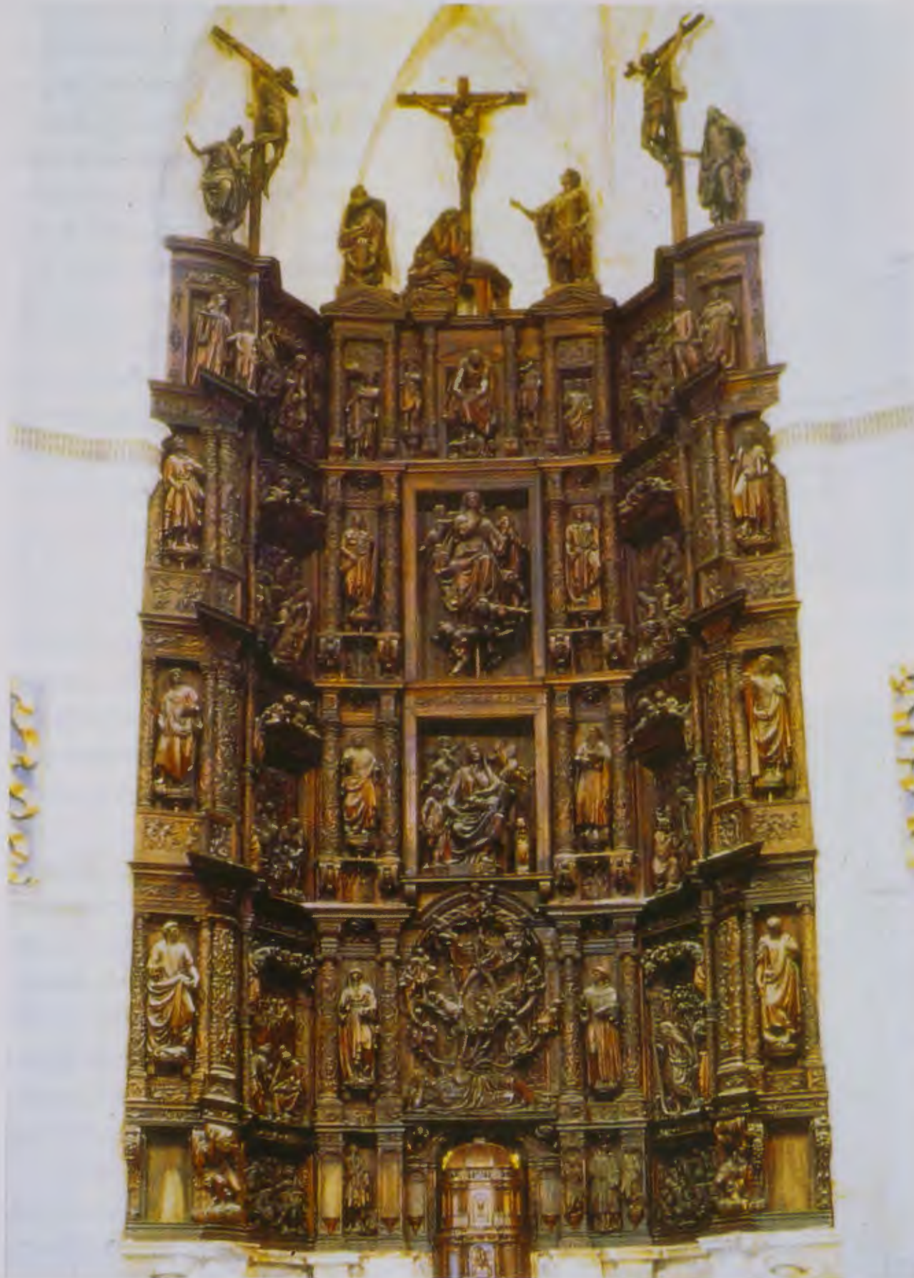
RETABLO DE SANTA CLARA, BRIVIESCA. (Burgos).