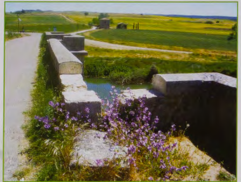
Detalle del actual estado de Puente Fitero.

Kafka no hubiera parido argumento más surrealista que éste: se asignó un presupuesto y de seguida se olvidó, se traspapeló o, simplemente, se guardó en los cajones de la burocracia administrativa. Pasó el tiempo y