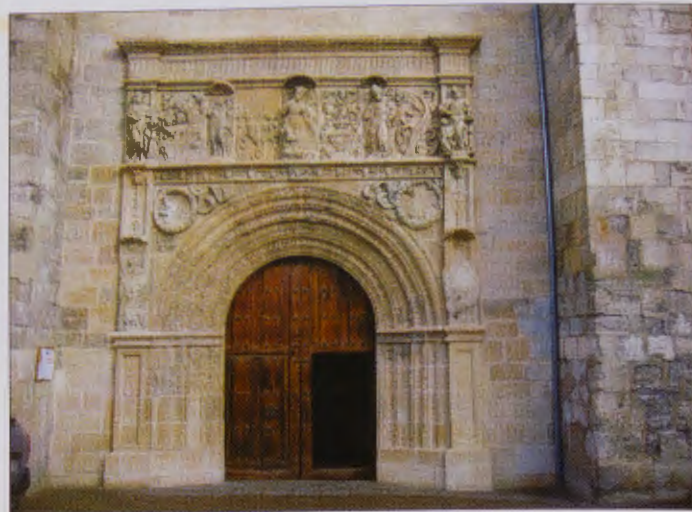
Pórtico Iglesia de San Martín

Ocupa en la plaza mayor el frente del mediodía. La portada es obra del primer renacimiento y nos presenta a la Virgen con las imágenes de San Juan Bautista y San Martín. En las enjutas del arco aparecen los bustos de la Fe y la Esperanza.