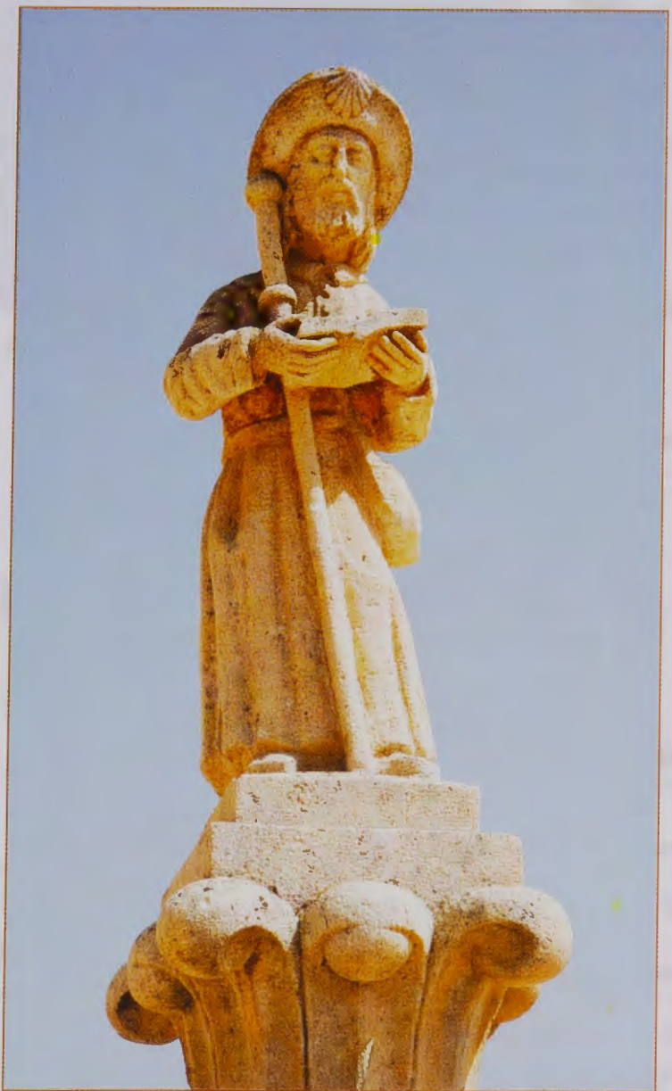
SANTIAGO PEREGRINO. VILLALONQUÉJAR.