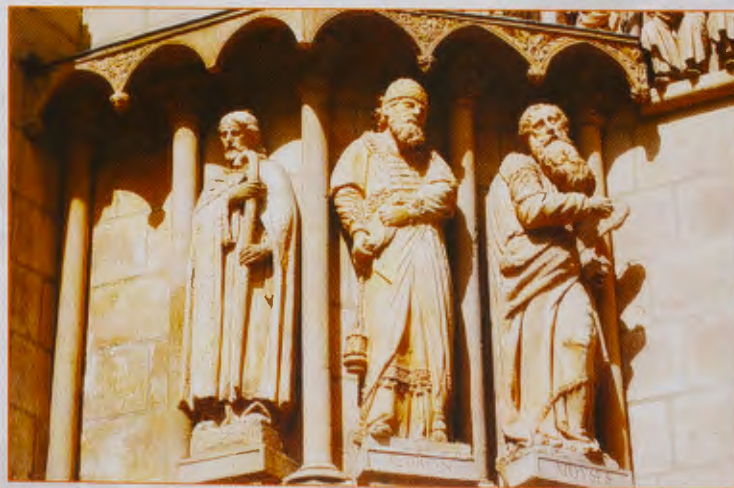
Conjunto escultórico de la PUERTA DEL SARMENTAL, con la imagen de SANTIAGO APÓSTOL, a la izquierda.

Las de los extremos, nuestro Santiago en el de la izquierda y otra de un santo sin identificar en el de la derecha, son diferentes de las centrales e incluso parecen surgidas de otra mano. Así encontramos que Manuel Martínez Sanz 1 nos dice que en 1863 se pusieron en los dos extremos de esta galería dos estatuas que habían estado en el arco de ingreso que entonces existía antes de subir a las escaleras del Sarmental y que fue sustituido por