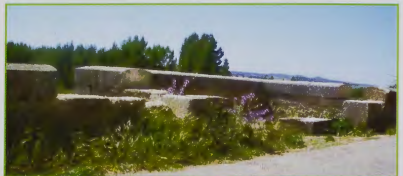
Y la miseria sigue cebándose en Puente Fitero...

EL CRITICÓN DEL CAMINO.