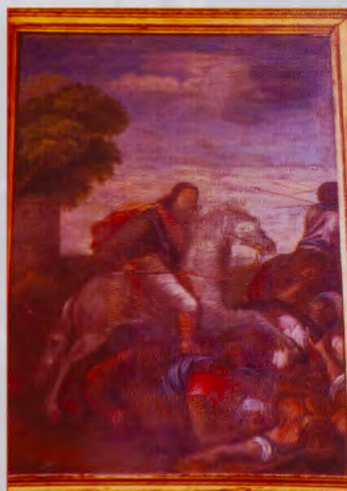
ALTAR FRONTAL. CAPILLA DEL BUEN SUCESO DEL MONASTERIO DE LAS HUELGAS.

Y con esta popular imagen del “Hijo del Trueno” cerramos nuestro recorrido por este singular