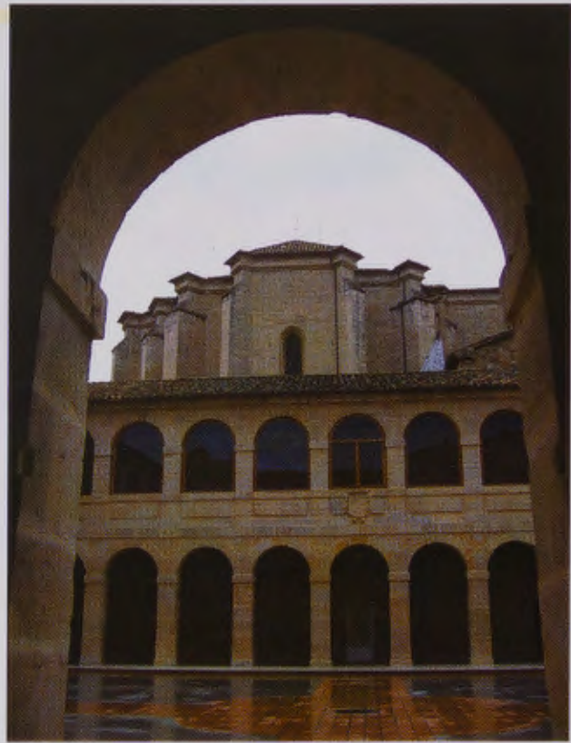
Hospitallillo de N.ª Sra. del Rosario e Iglesia de Santa Clara

El primer cuerpo tiene columnas de orden jónico con labores de grutescos, en los intercolumnios aparecen las imágenes de San Felipe , Santa Clara , San Francisco y Santiago, el Menor . En el centro se encuentra el majes-