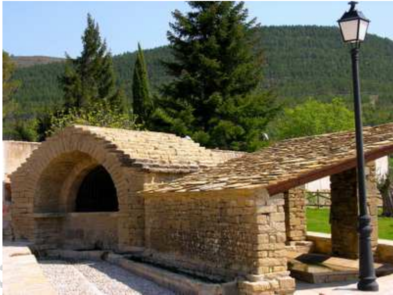
La vieja fuente románica, con el lavadero público adosado.