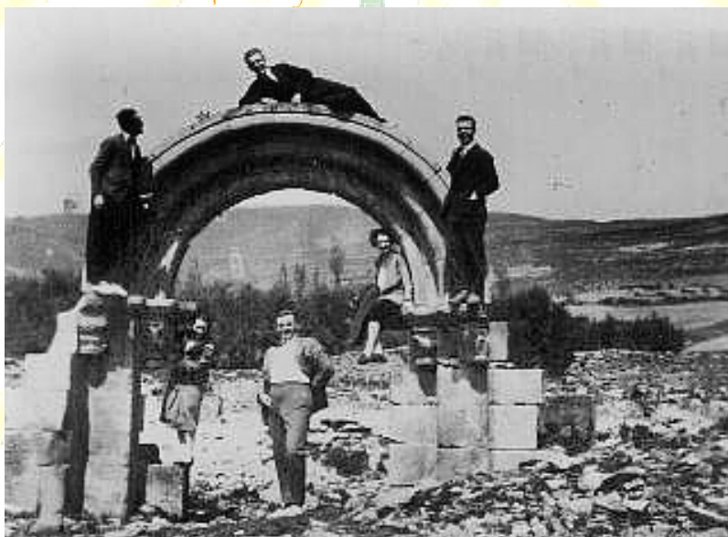
Los restos de la portada, en su emplazamiento original, ya sin el tímpano, en 1928.

Para 1955, la fama de Leache, como lugar donde obtener piedra buena y barata, se ha extendido. Y el padre Recondo, que está restaurando ese "parque temático de la fe más rancia" que es el castillo de Javier, acude a las ruinas de San Martín, y toma "prestados" la mayor parte de los sillares de sus muros laterales, contrafuertes, jambas de la portada, capiteles, y cuanto le parece de utilidad para su "excelsa obra javierina".