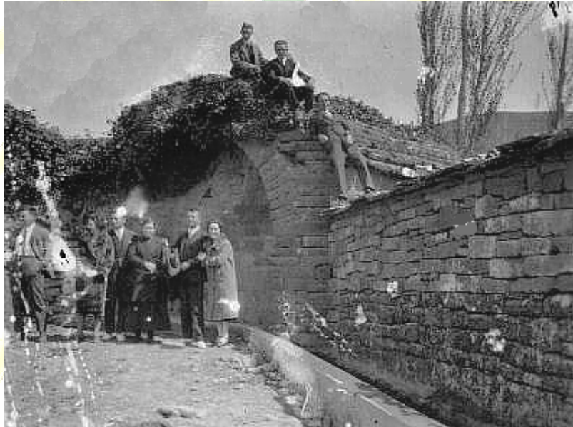
Fuente románica y lavadero público, en 1926.

En 1868, el Ayuntamiento, siguiendo el ejemplo del "párroco reciclador", reutilizó muchos sillares, con marcas de cantero, para dotar de cubierta el lavadero público. En 1905, la corporación municipal hizo la "fuente nueva", y no tuvo mejor ocurrencia que emplear en ella gran parte de la portada del templo sanjuanista, incluido el precioso tímpano con símbolos célticos, el cual no tuvo empacho en taladrar para incrustarle dos caños de agua. En 1927, el Ayuntamiento construye "la carnicería", detrás de la parroquial, y para ahorrarse los costes, emplea sillares, basas y dovelas, del saqueado templo.