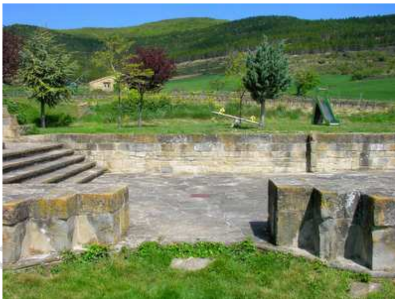
Aquí estaba la portada sur del templo sanjuanista.