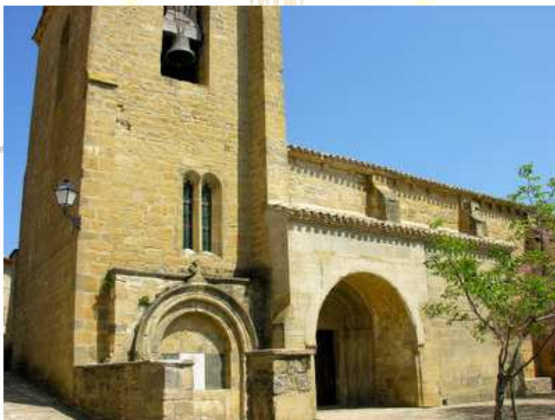
Templo parroquial de la Asunción de Nuestra Señora, Leache (Navarra).