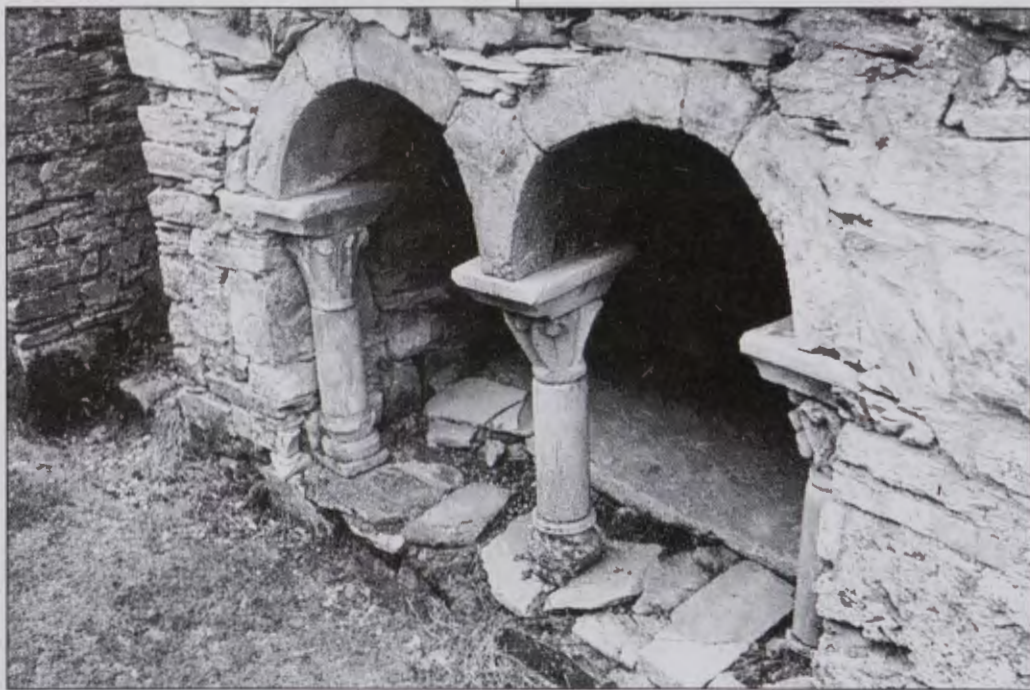
Santiago de Peñalba.- Sepulcro de S. Fortis