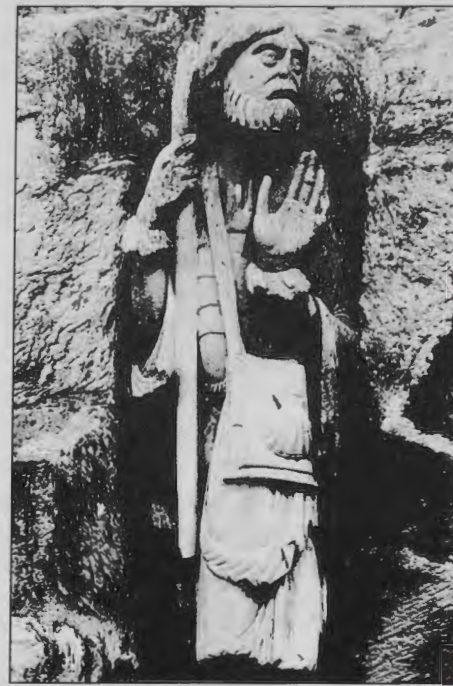
Santiago peregrino. Parroquia Santa Marta de Tera (ZAMORA).