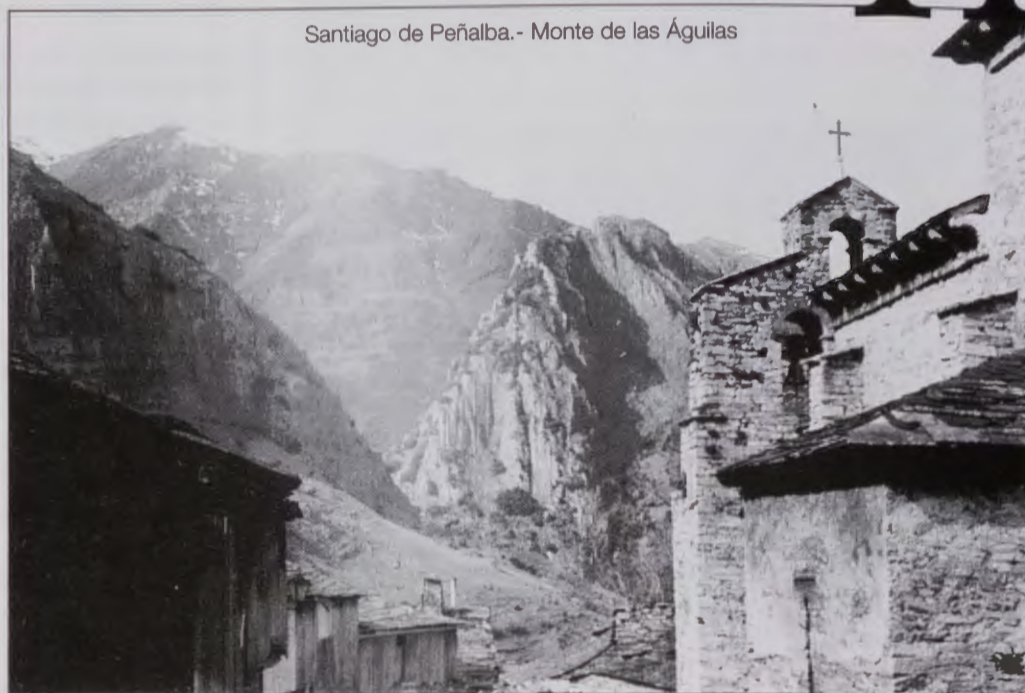
Santiago de Peñalba. - Monte de las Águilas

¿Por qué se producen estos movimientos? ¿Por qué hombres y mujeres llegan a constituir comunidades dúplices que obligan a Fructuoso a publicar la " Regula Communis "? La Iglesia, depositaria del catolicismo que abraza Recesvinto y que había vencido al arrianismo, no es una Iglesia asentada, sin fisuras y digamos pétrea. Está integrada en una sociedad impregnada de concepciones consideradas heterodoxas, ya no por el reciente arrianismo, sino todavía por el más lejano priscilianismo, cuyo núcleo radiante había sido Astorga. Cuando la Iglesia se incorpora a la vida del Reino no lo hace de forma pasiva. No se concreta a ser guía espiritual, sino que participa con la monarquía en la elaboración de normas y leyes de carácter civil. Todo ello en el seno de una sociedad no habituada a concepciones universalistas y a organigramas en las que la jerarquía era un valor esencial. La " Regula Communis " trata de ordenar la vida de una comunidad para la que el cenobio es la naturaleza, no el humilde refugio monacal en el que se aloja el " abbas " y sus allegados. Queda, sí, constituido el cenobio en una "polis", (hoy lo llamaríamos "comuna"), en la que los aspectos sociales como sanidad, educación,