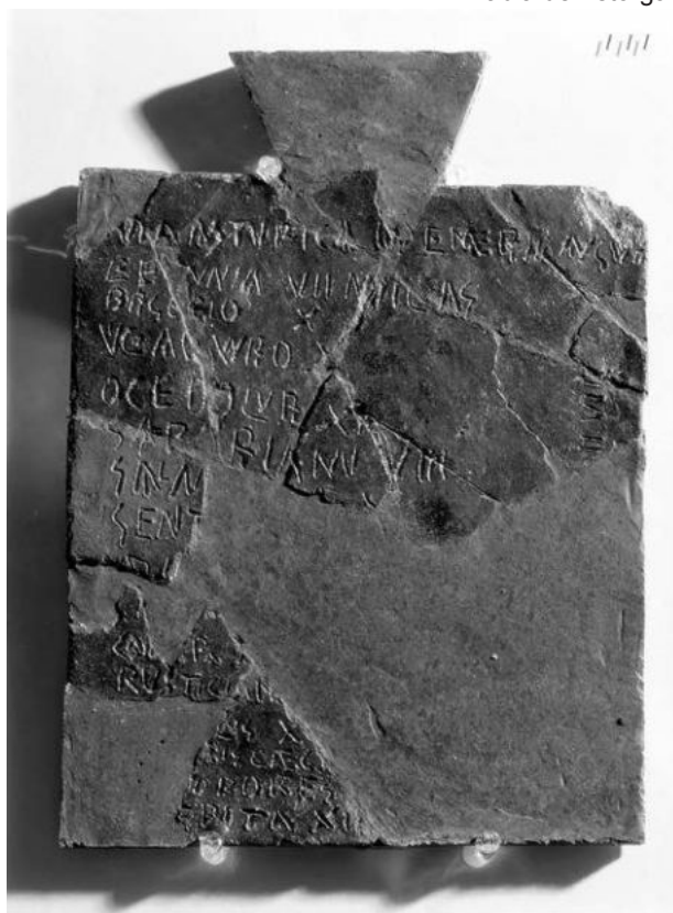
Tabla de Astorga.

La labor de nuestra Asociación se basa, principalmente, en dar alojamiento al peregrino y en defender, proteger y difundir el Camino. Creemos que éstas deben ser nuestras señas de identidad y, en este sentido, estaremos apoyando, con nuestro esfuerzo y recursos, cualquier misión en común que se plantee en esta dirección por asociaciones, organismos o instituciones, pero siempre que estos trabajos estén basados en el respeto al pasado cuando se trate de caminos históricos.