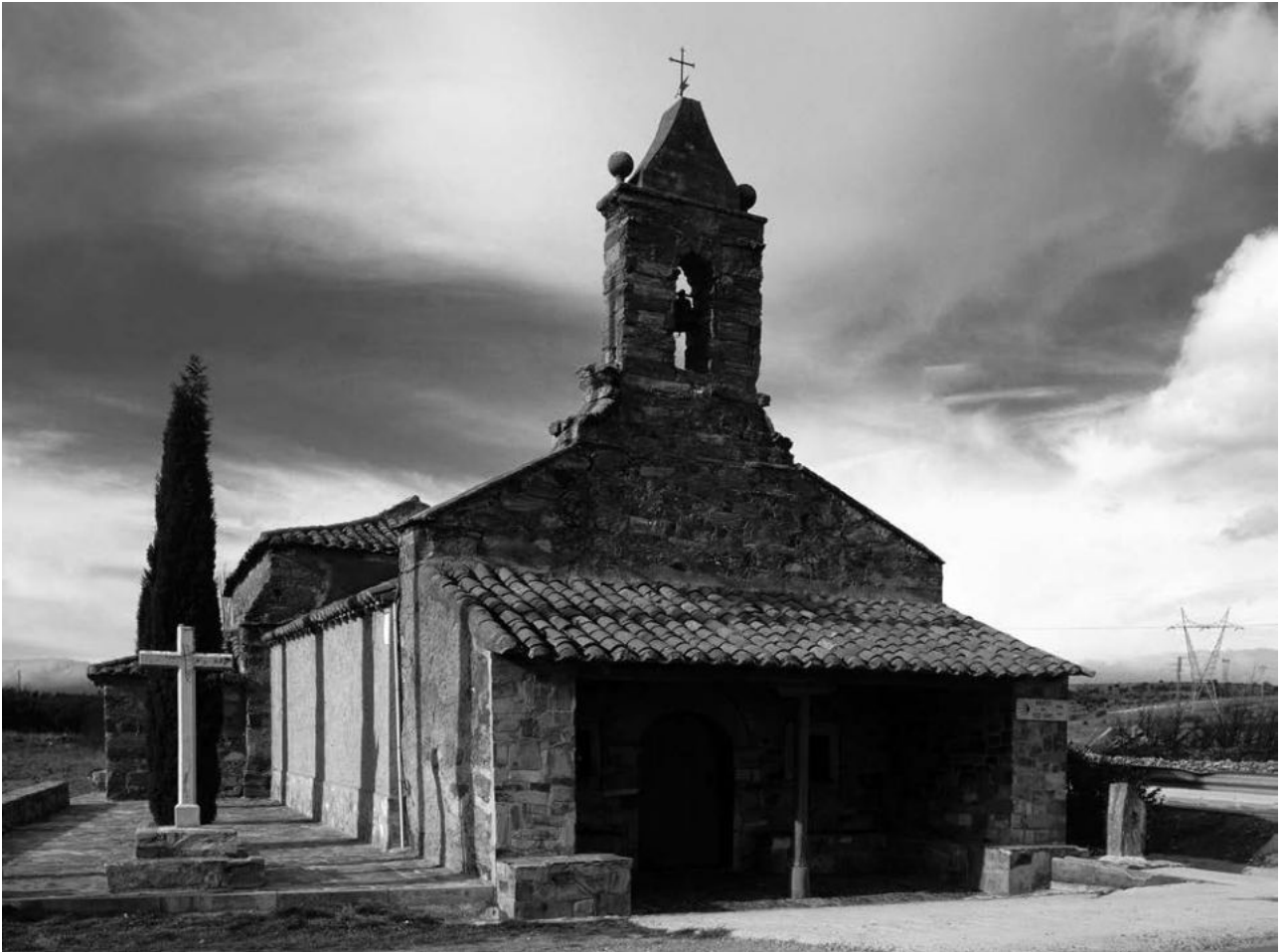
Ermita del Ecce Homo