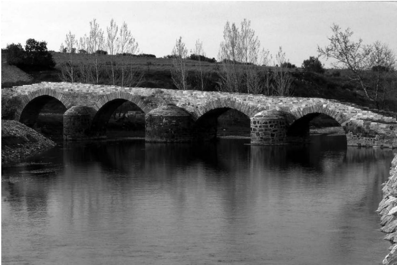
Puente de Valimbre, Cuevas.