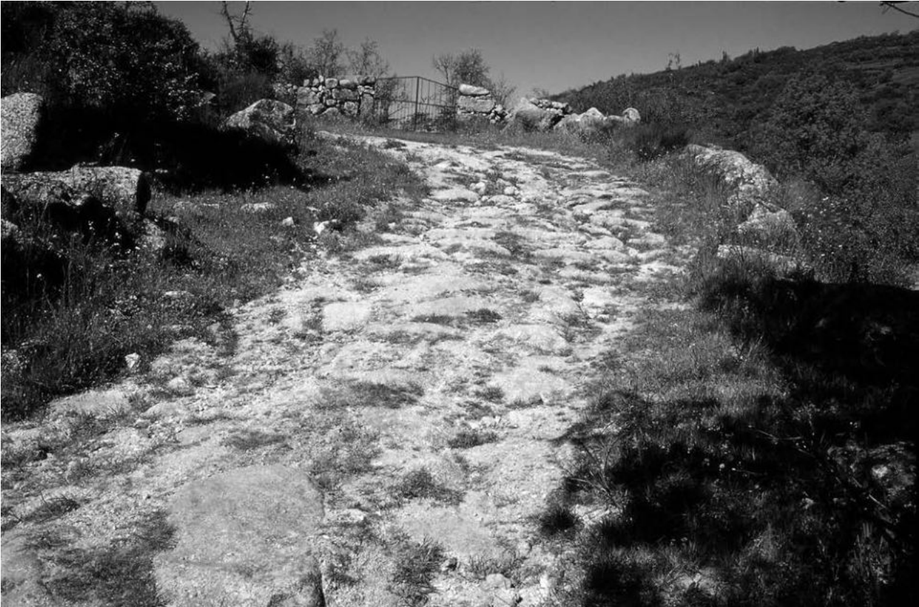
Restos de Calzada.