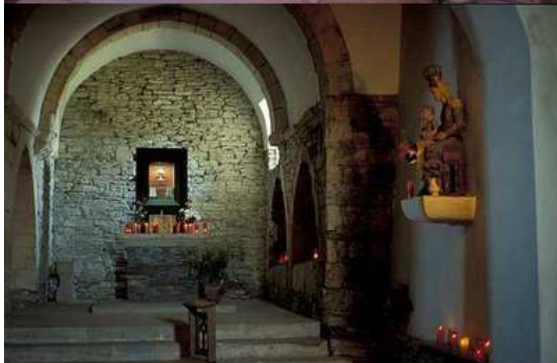
Interior de la Iglesia con el Santo