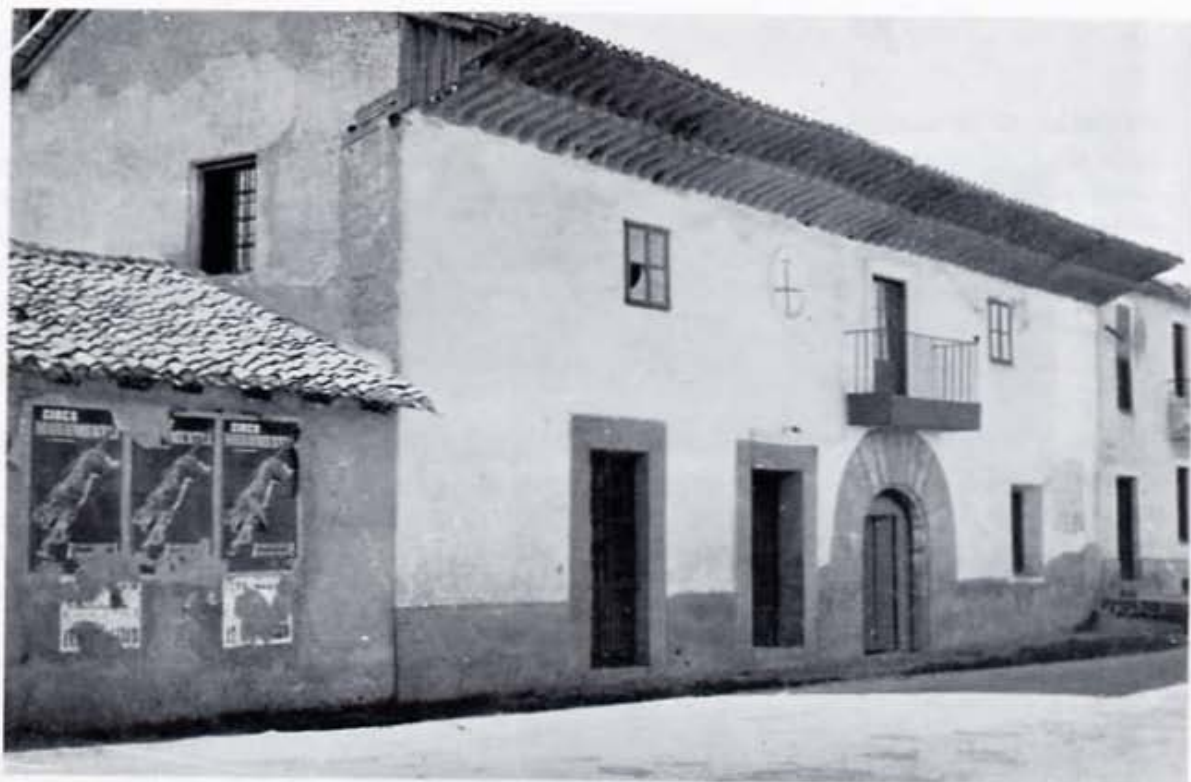
Antigo Hospital de Peregrinos en el Puente de Villarente (León).