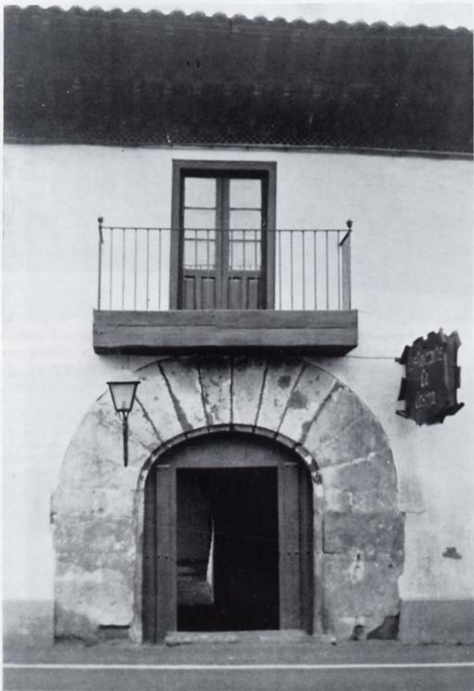
Hospital de Nuestra Señora la Blanca de Puente de Villarente. Portada principal.