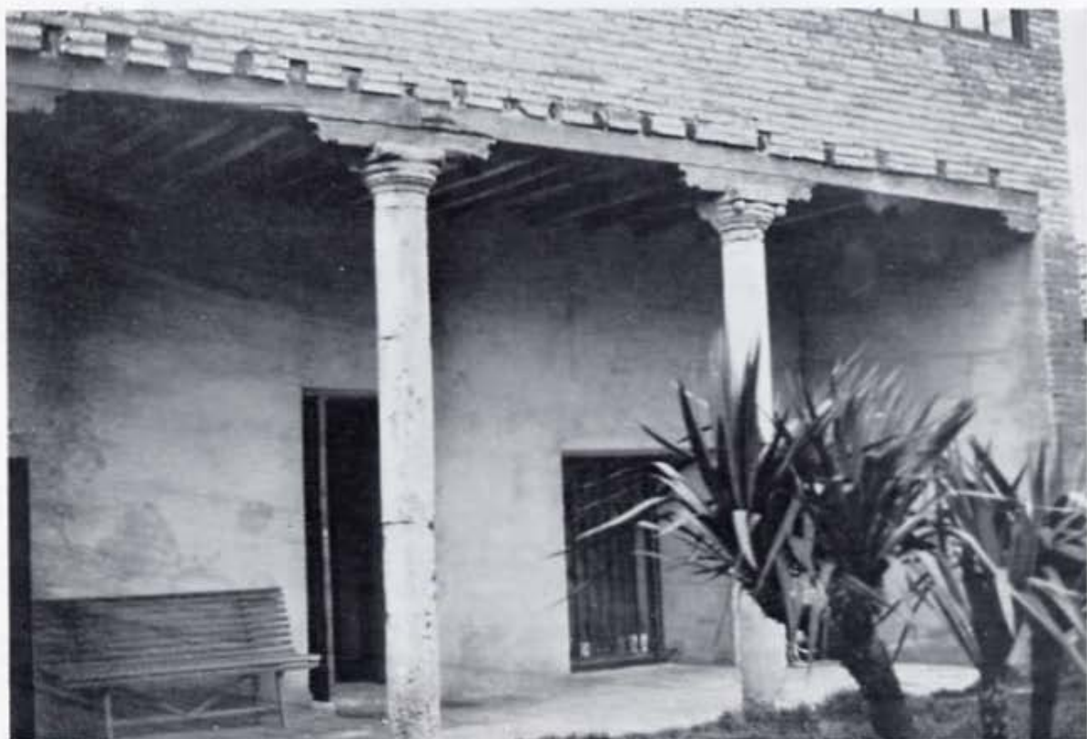
Hospital del Puente de Villarente (León). Patio interior.