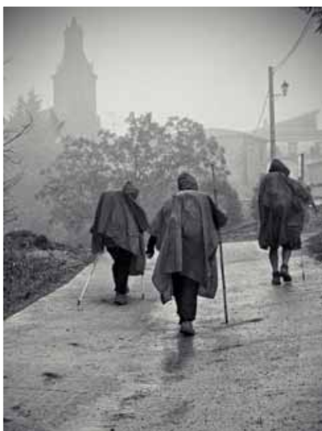
1º premio. Aitor Arenaza "Peregrinos"