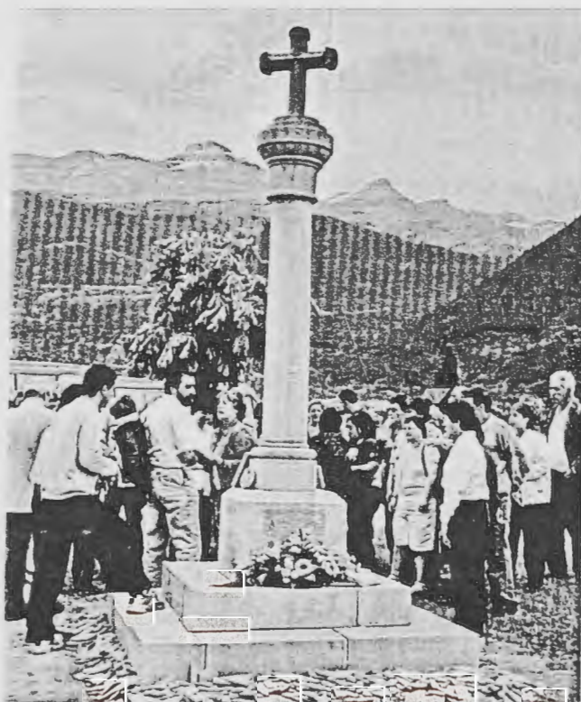
El crucero de Villanua