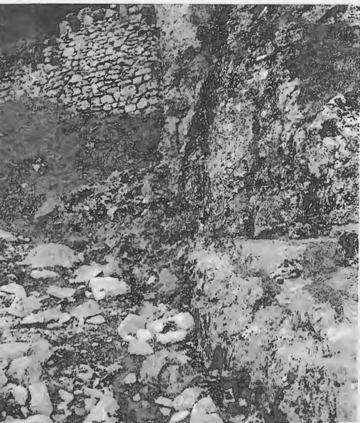
La flecha amarilla nos guía por la antigua calzada de San Adrián, hacia la boca del túnel, todavía protegido por los restos de la vieja fortificación.