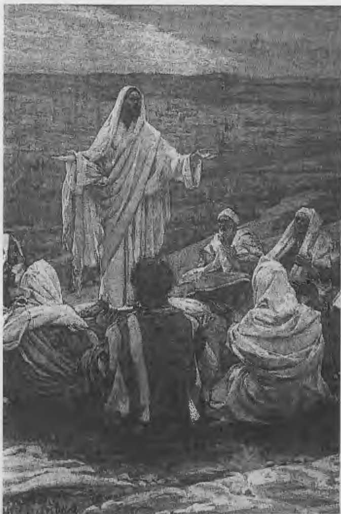
El padrenuestro, de James Tissot