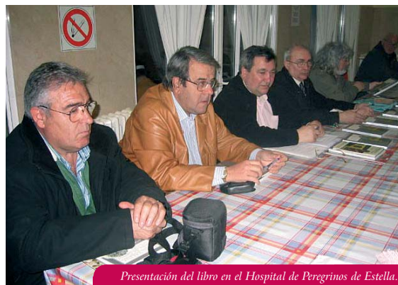
Presentación del libro en el Hospital de Peregrinos de Estella.