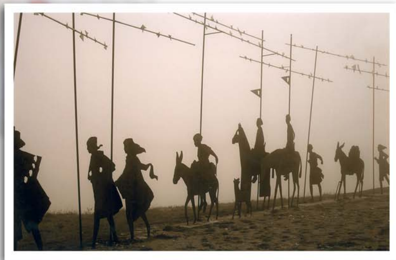
Blanca Olabuenaga Goikoetxea (Vitoria-Gasteiz, Álava)