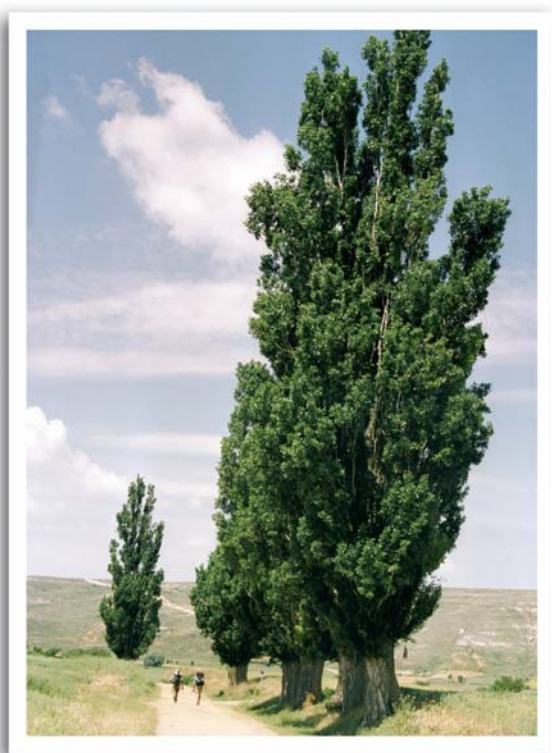
Montserrat Jacas Ballart (Esplugas de Llobregat, Barcelona)