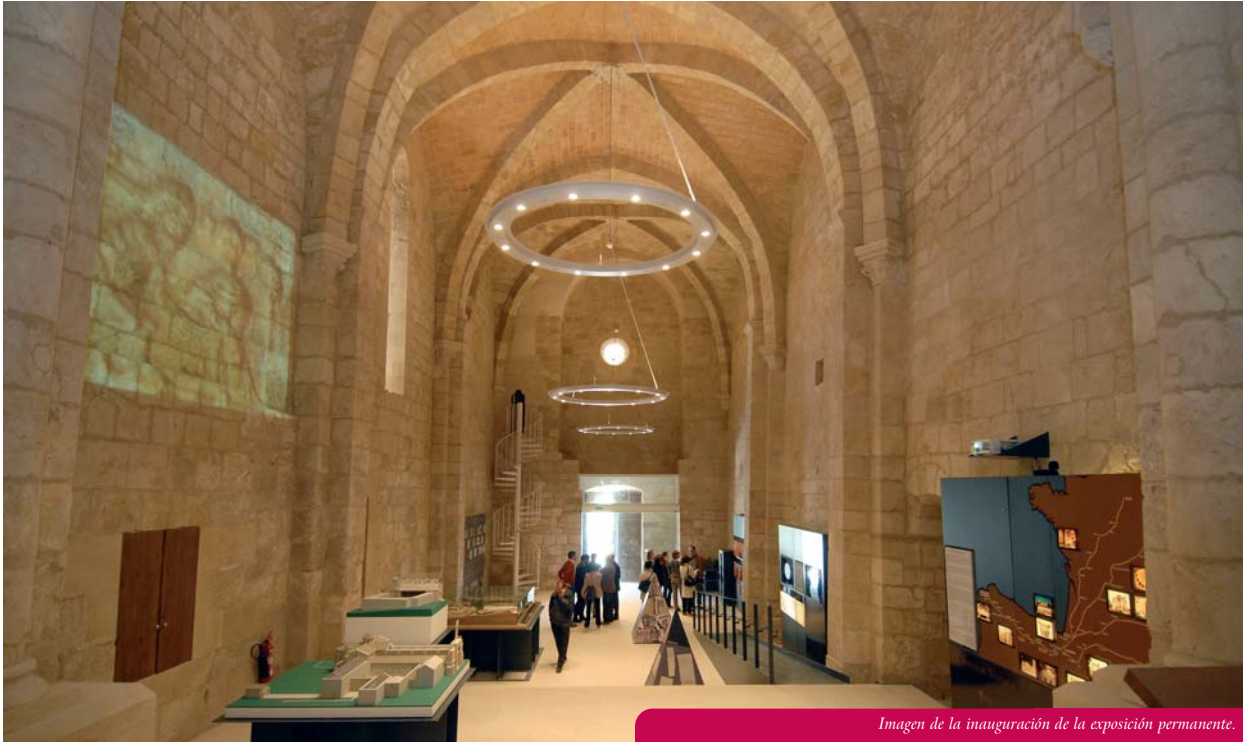
Imagen de la inauguración de la exposición permanente.