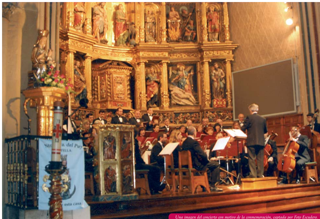
Una imagen del concierto con motivo de la conmemoración.

Resultó pues, un acto brillante y emotivo, cumpliéndose con ello la intención del homenaje a la Virgen del Puy, que desde esta asociación nos propusimos al organizarlo.