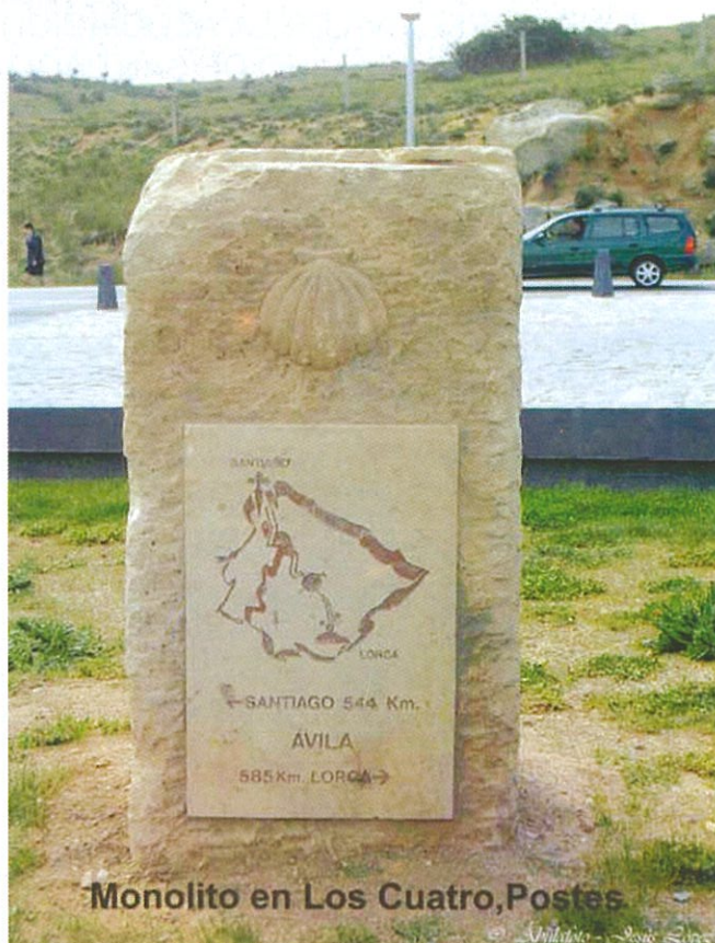
Monolito en Los Cuatro Postes