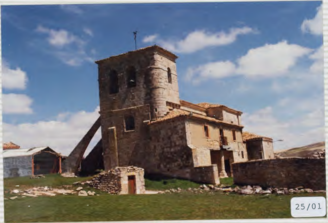
01.-IGLESIA DE SAN PEDRO ADVINCULA.