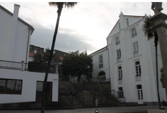
Edificio Internacional de Acogida al Peregrino

26 de octubre de 2015. Santiago de Compostela