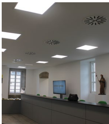
Oficina del Centro Internacional de Acogida a los Peregrinos

do por los siglos y siglos, sin discriminación alguna, el pan de la perdonanza y de la gracia". A ello añadió que "este centro, que debe ser como una Betania, casa de armonía y de descanso donde los peregrinos puedan reflexionar y dialogar, le darán vida éstos y las personas que les atenderán", para terminar señalando la importancia de trabajar para que "Santiago sea la capital espiritual de Europa".