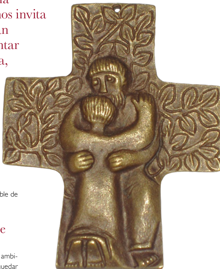
El abrazo del Padre

Para entender mejor todo esto podemos diferenciar los siguientes elementos. En primer lugar se da una interiorización del sufrimiento ajeno; deo que penetre en mis entrañas, en mi corazón, lo hago mío de alguna manera, me duele a mí. En un segundo momento, ese sufrimiento interiorizado, que me ha llegado hasta dentro, provoca en mí una reacción, se convierte en punto de partida de un comportamiento activo y comprometido. Por último, esa