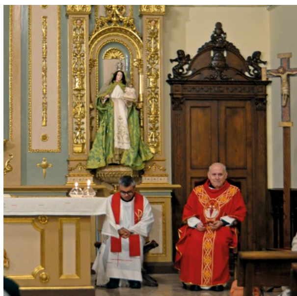
Capilla de Carretas

(Más información para ser hospitalero voluntario de ACC en: info@acogidacristianaenelcamino.es )