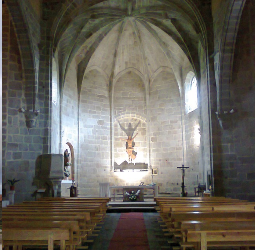
Santa María la Blanca