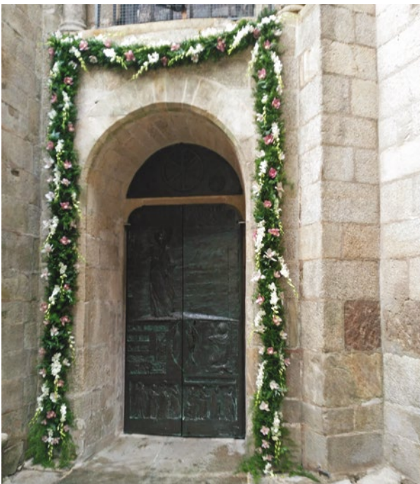
La Puerta Santa en el año de la Misericordia

Justamente este actuar de Dios nos permite intuir las primeras pistas para nuestra acción de acogida. En la medida en que ayudamos al peregrino a descubrir su impotencia, no como el lugar donde lo humano es derrotado, sino donde lo divino aparece compadeciéndose y siendo nuestro sostén y fortaleza, estamos manifestando a Dios. En la medida en que le ayudamos a presentar su súplica, aún titubeante en la fe, aún como simple grito dolorido, estamos manifestando a Dios. En la medida en que le hacemos ver que cada crisis es una nueva oportunidad, que Dios hace todas las cosas, toda la vida, nueva, nos ofrece una nueva oportunidad siempre y especialmente en el sacramento de la Reconciliación, estamos manifestando a Dios.