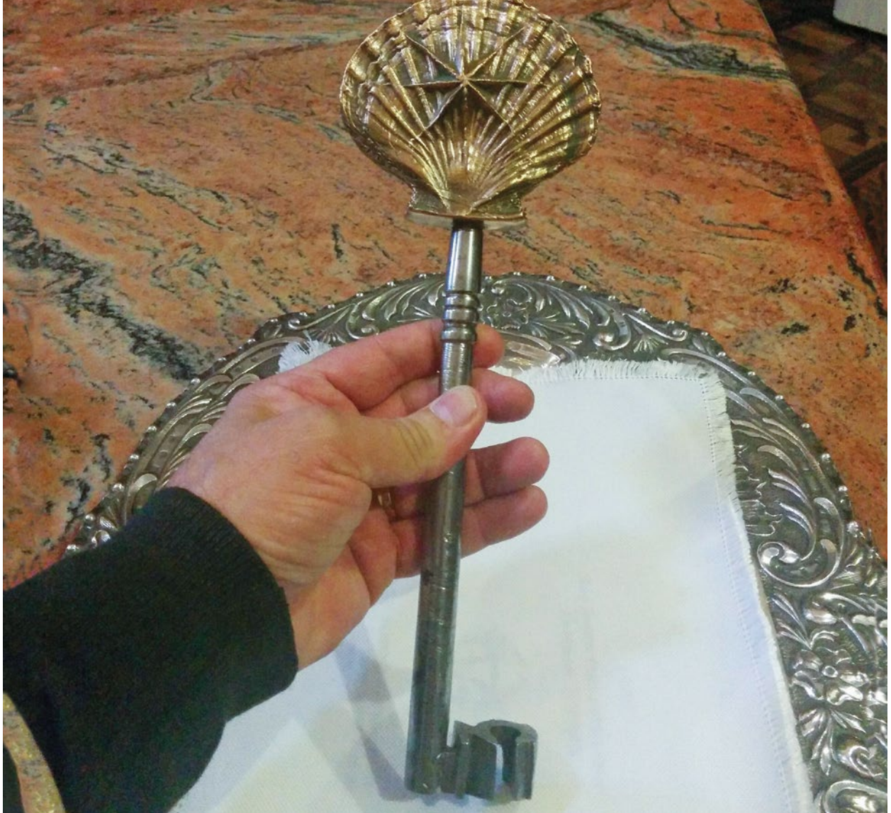
La llave que abre la Puerta Santa de la Catedral de Santiago