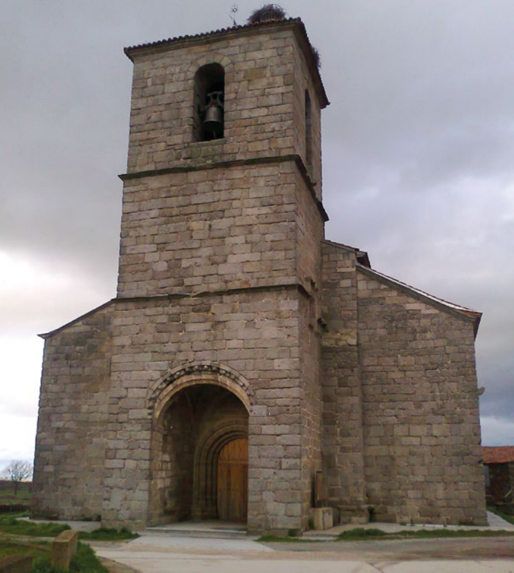
Santa María la Blanca

de treinta años, y la casa parroquial que se encontraba en parecido estado de ruina. Con los parroquianos y algunos jóvenes universitarios, nos pusimos manos a la obra. El campo de trabajo se llamó: “Limpieza y restauración en la Vía de la Plata” . Este título sirvió para que algunos expertos en esta ruta jacobea, se pusieran en contacto conmigo y comenzaran a surgir proyectos de inmediato: puesta en marcha de la Asociación amigos del Camino de Santiago Vía de la Plata de Fuenterroble de Salavtierra, reposición de miliarios, señalización general del Camino a través de esas tierras, etc... Y en la medida que comencé a restaurar la Casa Parroquial con mi gente y comenzaban a pasar los primeros caminantes, vi la necesidad de que fuese un espacio de acogida para todos, aunque en especial para los peregrinos.