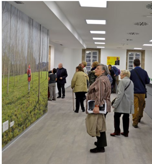
Oficina de Acogida al Peregrino

El Domingo comenzamos rezando Laudes. Después del desayuno nos centramos en la Catedral, visitando las excavaciones arqueológicas llevadas a cabo en diferentes períodos que han dejado al descubierto muchos vestigios de los orígenes de la basílica y de la ciudad. Bajo el pavimento se esconde una intrincada red de necrópolis que se suceden desde época romana hasta el momento de la construcción de la catedral románica, así como restos de las primitivas