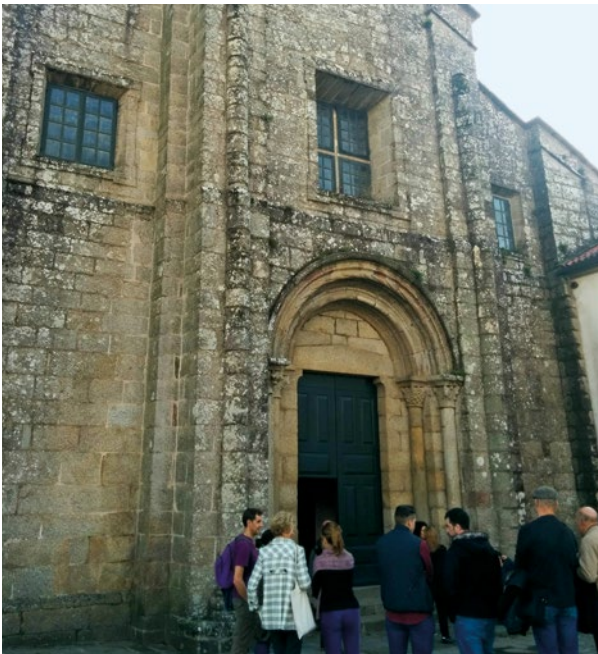
Colegiata de Sar

al Peregrino, jardín, biblioteca, capilla y otros despachos y dependencias para la ACC, la Archicofradía.... Son amplios espacios en que los peregrinos podrán sentirse como en su casa. Según avanzaba la visita a algunos se le soltaron unas lágrimas con la emoción de ver hecho realidad este lugar de referencia para los peregrinos.