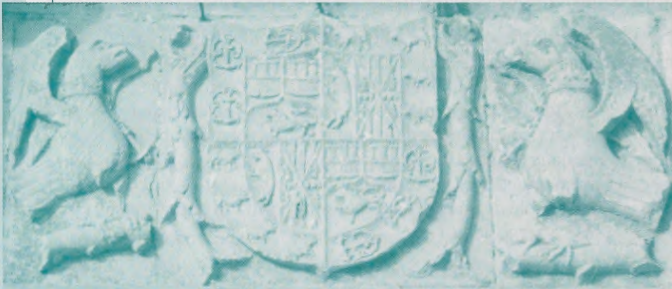
Escudo de los Enríquez fundadores del Convento de San Agustín de Mansilla.