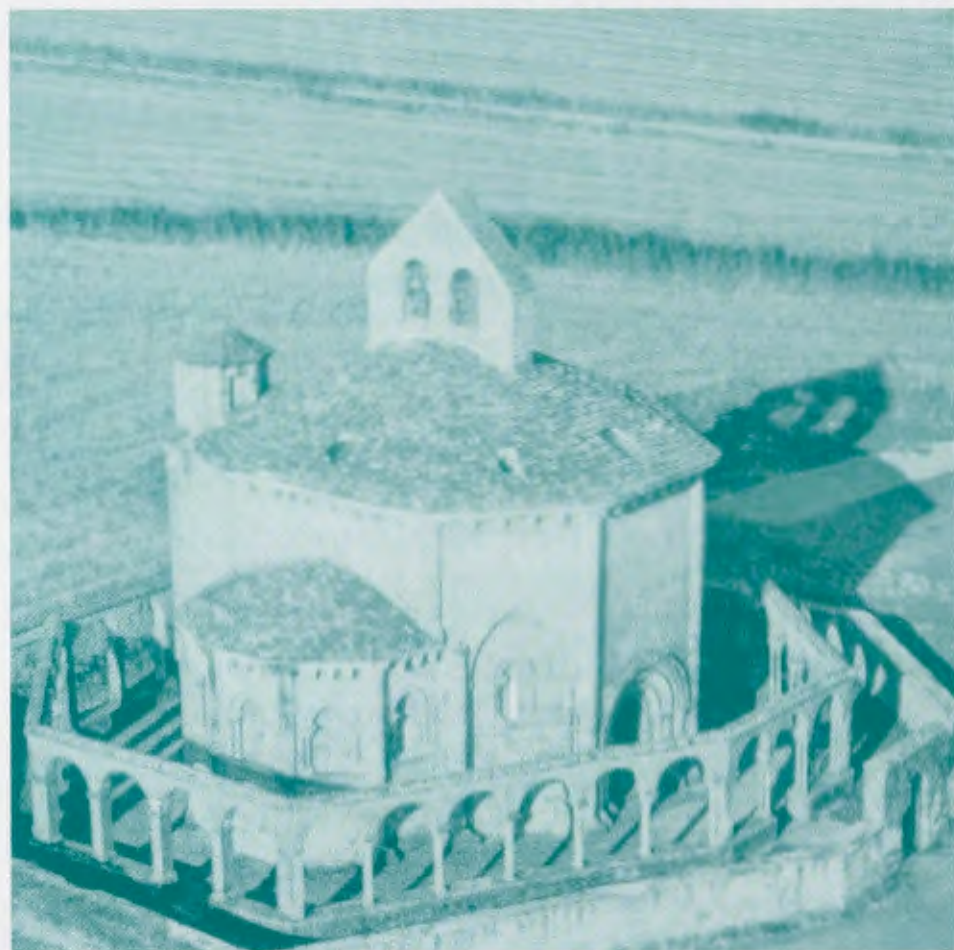
Santuario de Ennate (Navarra)

Paso ahora a contaros lo que ocurrió aquí, como ya os dije, hace dos días*. No es que sea nada importante, pero a mí me pareció algo insólito por lo anacrónico y pintoresco. Viajábamos muy cerca de Eunate cuando vimos