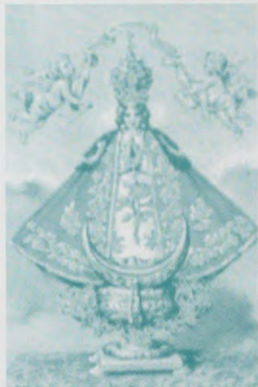
Nuestra Señora de San Juan de los Lagos

Y, curiosamente, pasaron, como no podía ser menos, los peregrinos que encontró en Eunete Mari Paz Abad y que nos impresionaron tanto como a ella. En una de las ocasiones en que nos acercamos hasta el albergue hallamos a dos mujeres que acababan de llegar y nos sorprendió su fisonomía tan exótica que nos indicaba su pertenencia a otra cultura muy diferente. Más nos sorprendió conocer que venían haciendo el Camino de vuelta de Santiago, portando una imagen del Niño Jesús, por cierto tan rústica y arcaica que invitaba poco a la veneración. Nos enteramos de que eran la avanzadilla de un grupo que lo completaban otros tres hombres, que venían algo detrás y que portaban sobre unas rudimentarias andas una pequeña vitrina con una imagen de la Virgen de San Juan de los Lagos.