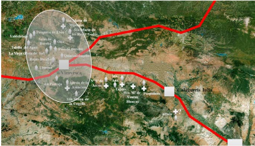
FIGURA. 1. FOCO DE PRODUCCIÓN DE LOS SARCÓFAGOS CON DECORACIÓN INCISA, VÍAS DE COMUNICACIÓN PRINCIPALES Y TEMPLOS CON NECRÓPOLIS TARDORROMANOS EN LA RIOJA.

de estilo decorativo con estelas funerarias alavesas con el mundo tardoantiguo de la zona francesa de Aquitania de los siglos V y VI 17 .