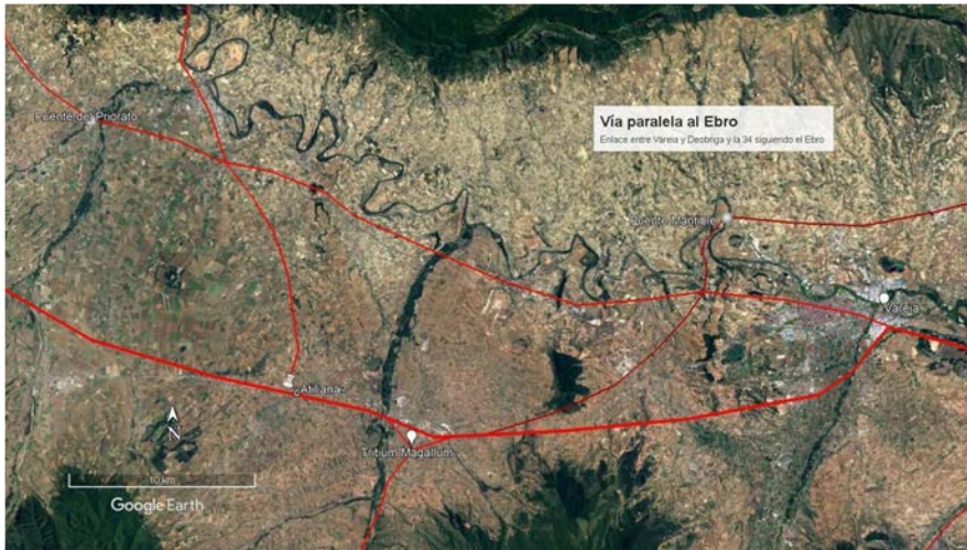
FIGURA. 3. ENTRAMADO VIARIO EN EL NORTE DE LA RIOJA.

Gracias a todos estos datos, se puede decir que esta vía de carácter secundario salía por el oeste de Logroño, continuaba por el cerro de El Cortijo, atravesaba los términos municipales de Fuenmayor, Cenicero y San Asensio donde comenzaba su separación del curso del Ebro. Entre Briones y Ollauri, se producía una bifurcación: un ramal viraba al norte rumbo a Haro atravesando Gimileo y el otro continuaba al sur de Ollauri y al norte de Rodezno siguiendo por Casalarreina, Cihuri, donde se conserva el puente del Priorato 64 , y Sajazarra 65 rumbo a los montes Obarenses.