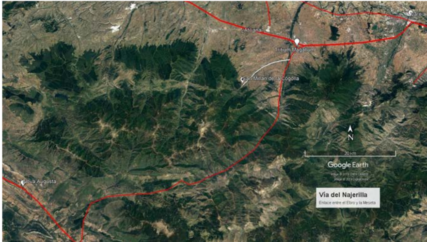
FIGURA. 2. VÍA ROMANA DEL NAJERILLA.

evidencias de un incendio entre las primeras fases del edificio antes de las sucesivas reformas y ampliaciones de época mozárabe. El autor maneja, con las dudas razonables, que las fechas de las cenizas encontradas puedan ser coincidentes con el ataque musulmán porque, poco después, se produjo la restauración bajo los auspicios del monarca Sancho III «el Mayor» (1004-1035) 33 .