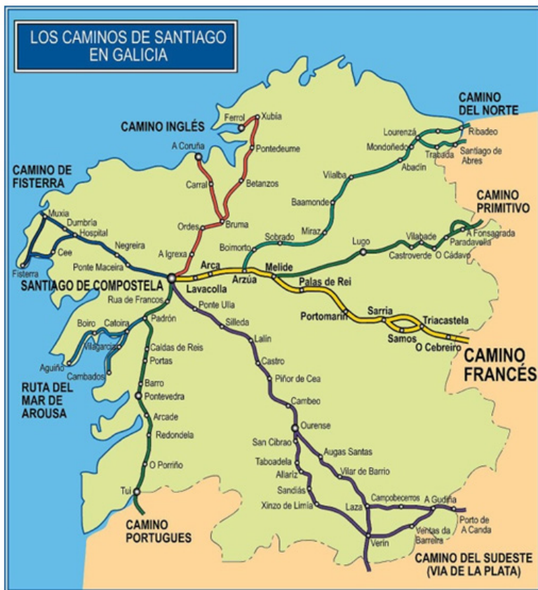
Figura 1. Mapa general de los Caminos de Santiago a su paso por Galicia.