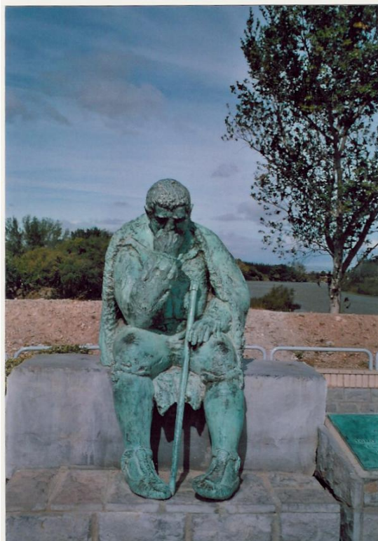
(Monumento a Sancho Panza)

HERRU, SANTIAGO, HERRU! GOT, SANTIAGO, GOT! E SUS EIA, ULTREIA! DEUS ADJUVANOS!